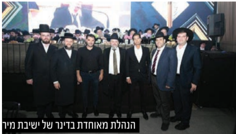
הנהלת מאחדת בדינר של ישיבת מיר