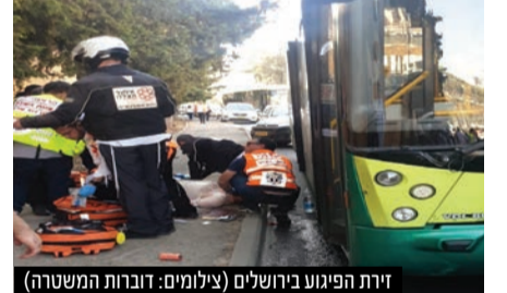
זירת הפיגוע בירושלים