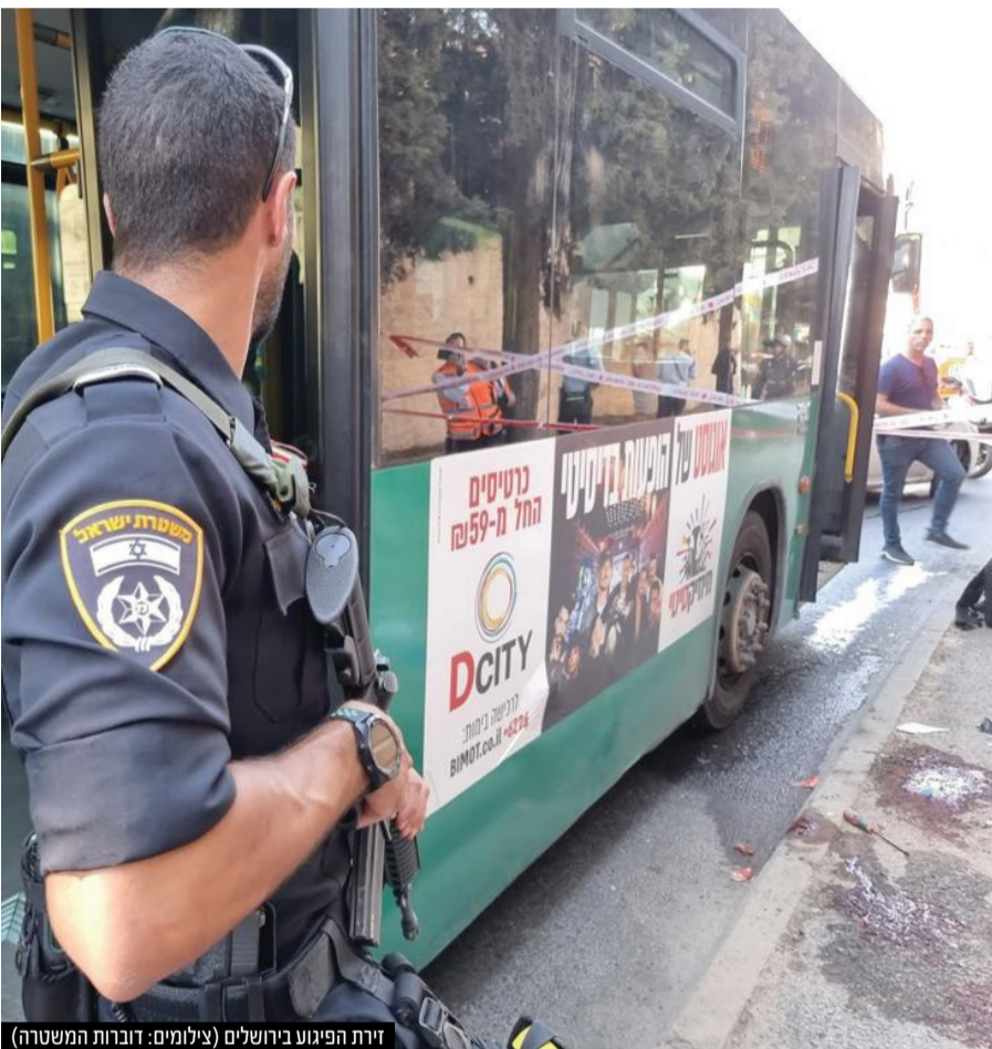
זירת הפיגוע בירושלים

צלם עיתונות שנסע בסמוך ירה במחבל וניטרל אותו • נהג האוטובוס פונה לביה"ח שערי צדק במצב בינוני • בחמאס בירכו על הפיגוע: "תגובה הטבעית לפשעיה של ישראל נגד המקומות הקדושים למוסלמים ולנוצרים בירושלים" • בסוף השבוע נורו ארבע רקטות מרצועת עזה ליישובי הדרום • צה"ל מיהר להפציץ ולהשמיד מתקן לייצור אמצעי לחימה של חמאס בעזה