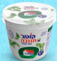
קוטג' תנובה 5% עם זעטר בד"צ ועדת מהדרין