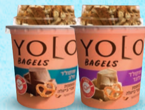
יולו עם שברי בייגלה שוקולד בלונד | שוקולד חלב בד"צ ועדת מהדרין