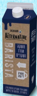
משקה בריסטה אורז ושקדים 1 ליטר בד"צ העדה החרדית