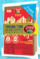
מאגדת זוג עמק 600 גרם X 2 יחידות בד"צ העדה החרדית