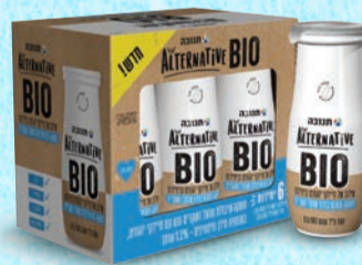
מאגדת משקאות BIO אישיים על בסיס שיבולת שועל ושקדים 100 מ"ל X 6 יחידות בד"צ העדה החרדית