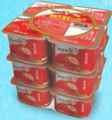
מאגדת יופלה תות 100 גרם X 12 יחידות בד"צ העדה החרדית