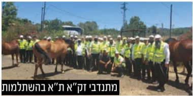
מתנדבי זק"א ת"א בהשתלמות