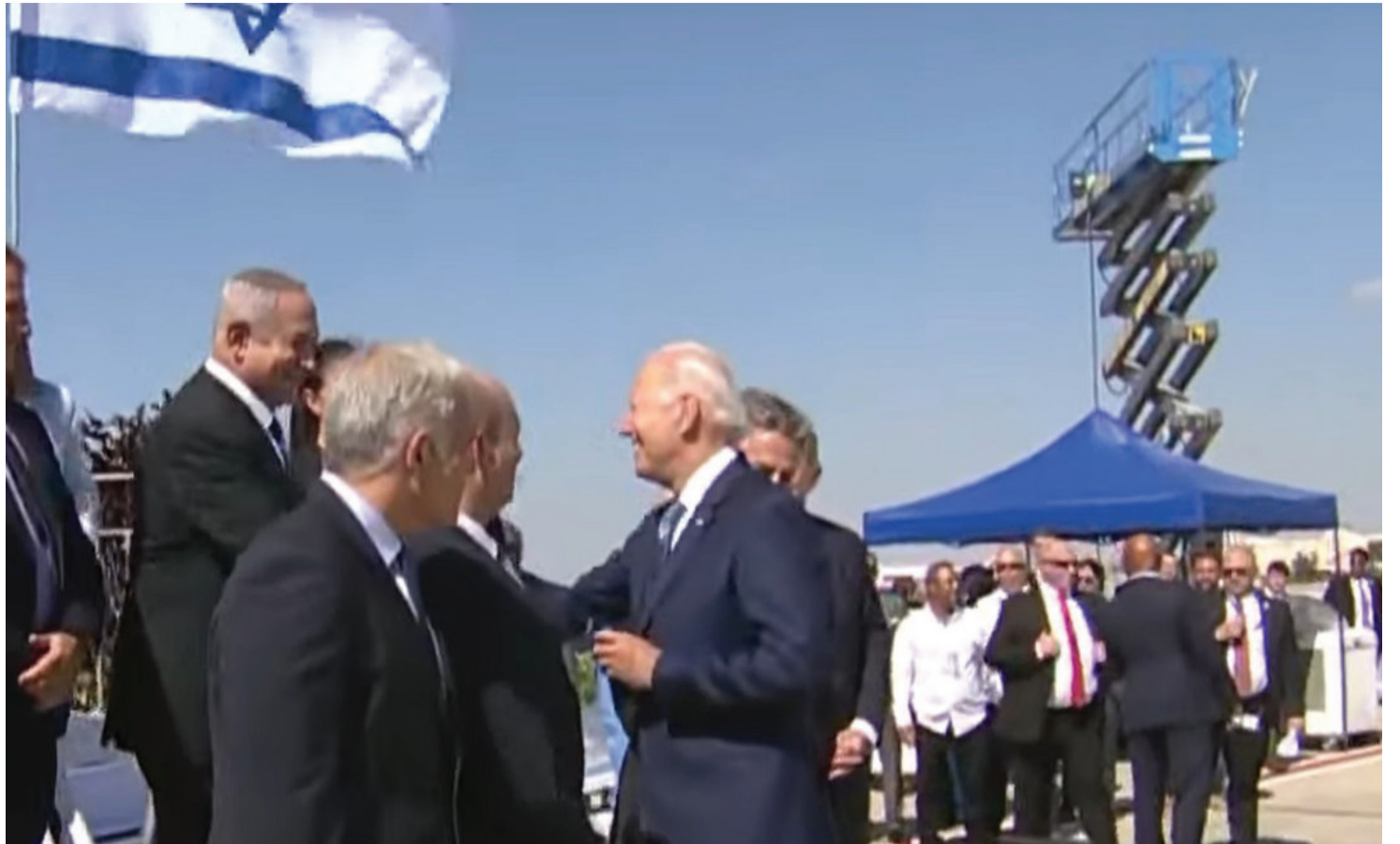
גם בידן יודע במי להשקיע, נשיא ארה"ב וראש האופוזיציה

בתחזוקת הח"כים לאורך הקדנציה ועל חוסר היכולת לגרום למפלגה להמריא. הורוביץ לא חיכה שחבריו יערכו בו ליניץ' מתורבת בניחוח פולורליסטי, ומיהר להודיע כי הוא לא יתמודד לתפקיד היו"ר בפריימריז, שיתקיימו בעוד כחודש.