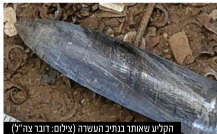
הקליע שאותר בנתיב העשרה