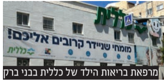
מרפאת בריאות הילד של כללית בבני ברק

קידום המודעות לרפואה בקהילה, נמצא במיקום גבוה בסדר העדיפויות של כללית. על מנת להנגיש את יתרונות הרפואה בקהילה, כללית פועלת במגוון אמצעים לכל חלקי האוכלוסייה, גם בקרב אנשים וילדים עם צרכים מיוחדים. במסגרת זו, התקבלו השבוע תלמידי בית הספר 'אור חדש' לילדים עם מוגבלויות במרכז בריאות הילד של כללית בבני ברק. הסיור נועד להציג את מגוון שירותי הרפואה הניתנים לילדים ודרכי ההנגשה גם לאנשים עם צרכים מיוחדים, להקנות לילדים המיוחדים את כללי ההתנהגות הנכונים במרפאה הקהילתית,