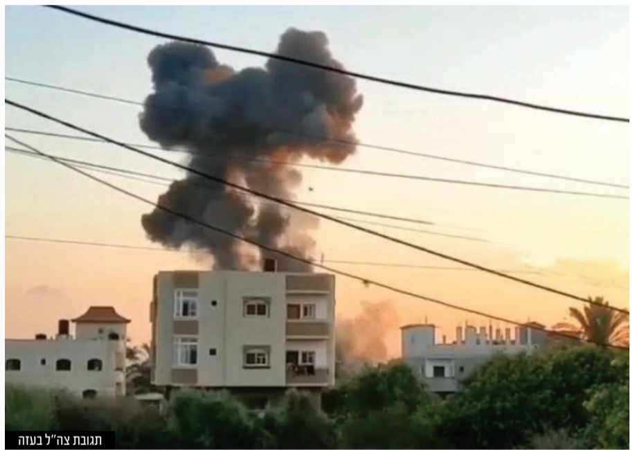
תגובת צה"ל בעזה