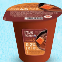
מעדן תנובה דיאט שוקולד קרמל מלוח בד"צ ועדת מהדרין