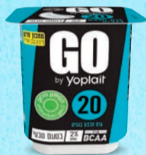
יוגורט GO בטעם טבעי בד"צ ועדת מהדרין