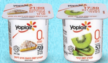
דיאט יופלה קיווי | מרנג לימון בד"צ ועדת מהדרין