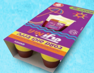
מאגדת קרלו שוקולד בננה 100 גרם X 8 יחידות בד"צ ועדת מהדרין