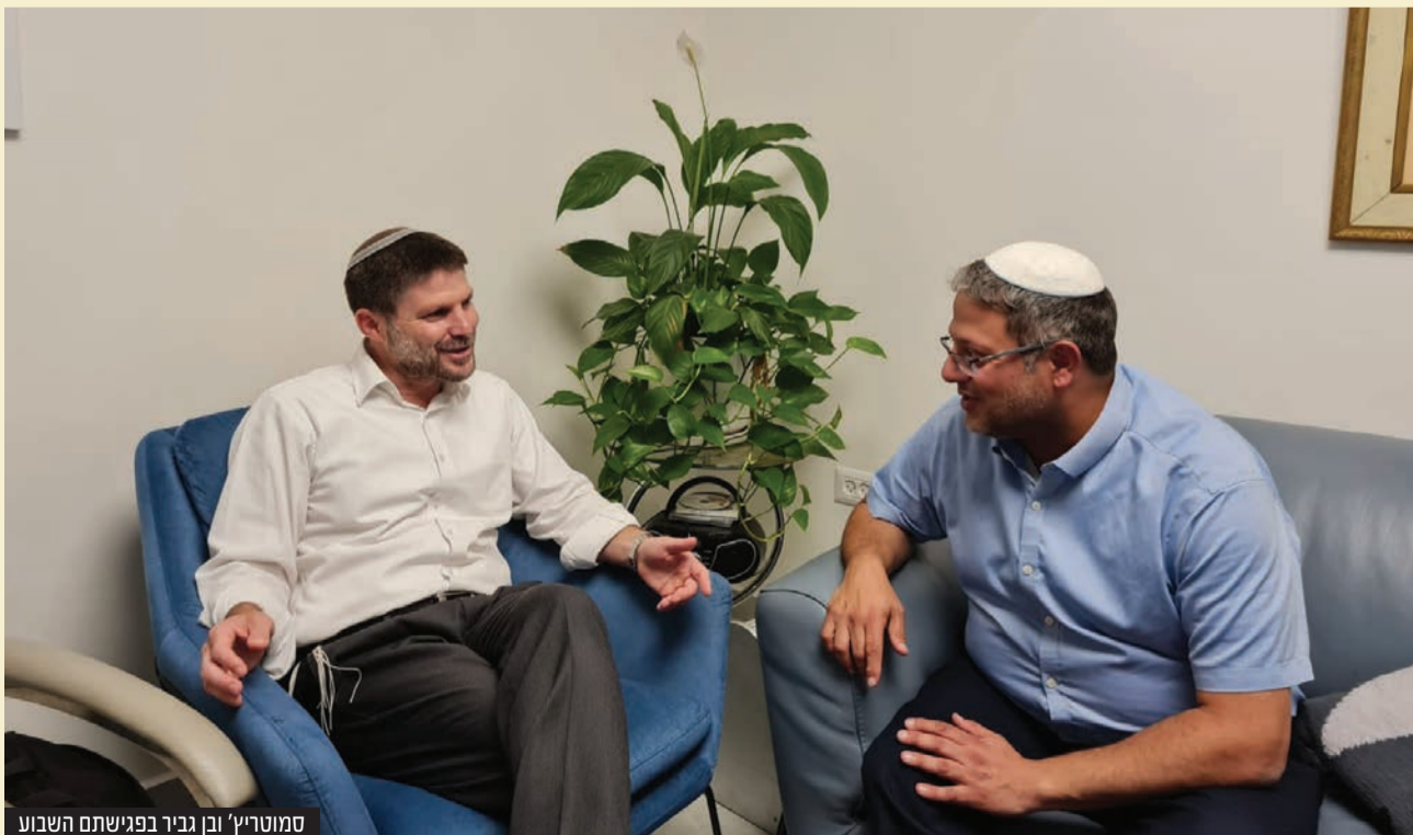
סמוטריץ' ובן גביר בפגישתם השבוע

אחרי שהתקוטטו באמצעות כלי התקשורת, עו"ד איתמר בן גביר ובצלאל סמוטריץ' נפגשו וסיכמו: מו"מ מואץ על התמודדות משותפת לקראת הבחירות. יו"ר הציונות הדתית בצלאל סמוטריץ' ביקש לדחות את הדיונים על התמודדות משותפת, בעוד עו"ד איתמר בן גביר שנהנה מעלייה בסקרים דחק לקיים את המו"מ כבר כעת כדי להיערך לבחירות ולפתוח בקמפיין הנדרשים. ככל שסמוטריץ' ביקש להתמהמה - בן