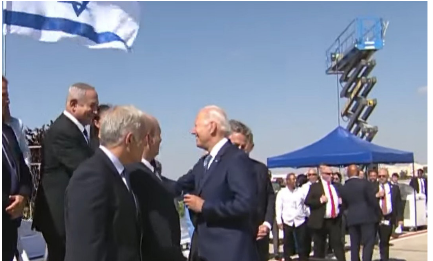
גם בידן יודע במי להשקיע, נשיא ארה"ב רואש האופוזיציה

בתחזוקת הח"כים לאורך הקדנציה ועל חוסר היכולת לגרום למפלגה להמריא. הורוביץ לא חיכה שחבריו יערכו בו ליניץ' מתורבת בניחוח פולוליטי, ומיהר להודיע כי הוא לא יתמודד לתפקיד היו"ר בפריימריז, שיתקיימו בעוד כחודש.