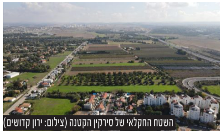
השטח החקלאי של סירקין הקטנה