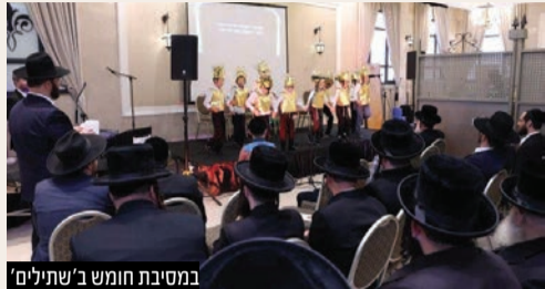
במסיבת חומש ב'שתילים'

תנופת עשייה בקצב מהיר: בהנחיית ראש המסיבת חומש מרגשת במיוחד התקיימה באחרונה עת חגגו ילדי כיתה א' בת"ת 'איילת השחר' שע"י רשת 'שתילים' את תחילת לימודי החומש. האירוע רב הרושם התקיים ברוב פאר והדר באולם באינן בהשתתפות ההורים ובני המשפחה.