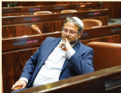
דורש 5 מקומות. בן גביר