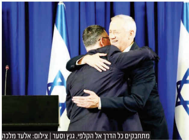
מתחבקים כל הדרך אל הקלפי. גנץ וסער

במידה וגוש נתניהו לא יצלח את מחסום ה-61 המנדטים - מבין כל המועמדים האחרים, לבני גנץ סיכוי לא מבוטל להיות ראש הממשלה ה-15 של מדינת ישראל.