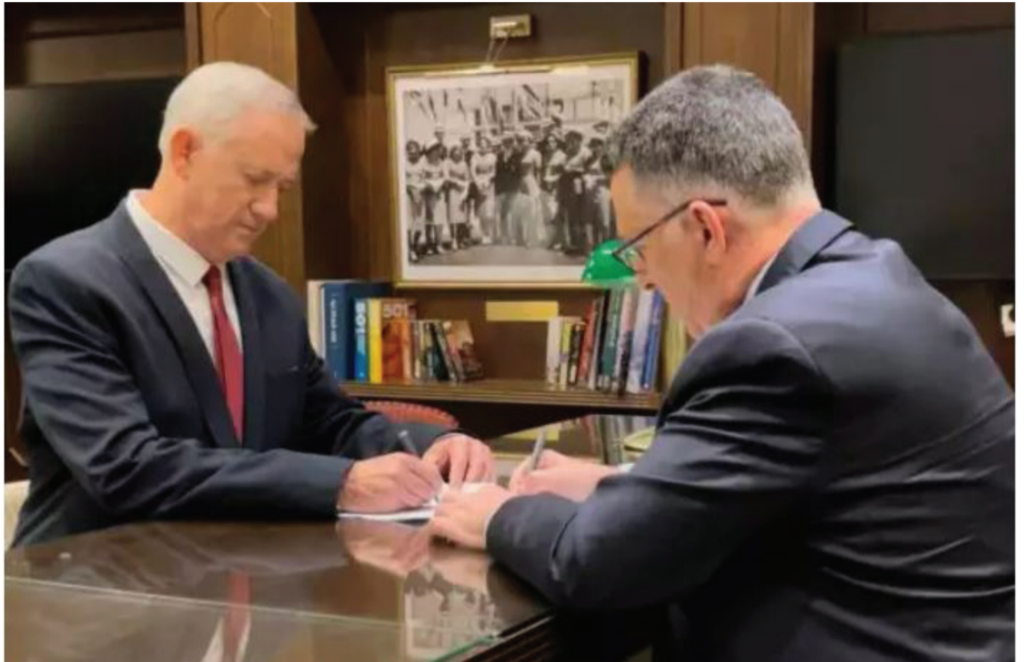
שועל וטירון מתאחדים, גנץ וסער בחתימת ההסכם

ובונים על האחריות הגושית שתמנע מדגל התורה לנקוט בצעדים ממשיים בבחירות הקרובות. אם לא תחול תזווה בעמדות הצדדים, סביר להניח שהמתחיות תתגבר עד לשעת השין, מועד סגירת הרשימות בעוד למעלה מחודשיים.