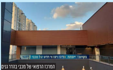
המרכז הרפואי של מנכ"ל בהדר גנים

המרכז החדש ייתן מענה בתקופת השיפוץ של המרכז הרפואי הדר גנים