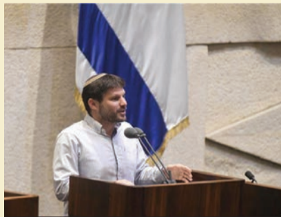
נאב ראש. בצלאל סמוטריץ'

המפלגה. היא שיגרה טפסי הצהרה לכלאף מתפקדי המפלגה וביקשה נאמנות מחודשת. 500 מתוכם השיבו בחיוב. היא הקימה מחדש את מוסדות המפלגה כולל את בית הדין של התנועה בראשות שופט בדימוס. היא מתכוונת להריץ את המפלגה בבחירות הקרובות, עבור הציבור שבעבר תמך בבנט ושקד וכיום אין לו בית פוליטי. חברים בגוף הבוחר בבית היהודי אומרים ל"קו עיתונות", כי לחלקים נרחבים בציונות הדתית אין כיום בית פוליטי. מבנט ושקד הם התאכזבו, אבל מצד שני הם לא רואים עצמם מצביעים למפלגה חרד"לית. סמוטריץ' ובן גביר מייצגים את הצד החרד"לי של חובשי הכיפות הסרוגות ולכן הבית היהודי הוא הבית הפוליטי עבורם.