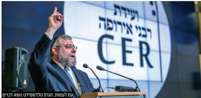
עת לעשות. הגר"פ גולדשמידט נושא דברים

בהודעה לרבני אירופה ולראשי הקהילה כתב הגר"פ גולדשמידט; "עצוב ככל שאהיה מהנסיבות, ברור לי שהחלטתי לעזוב כעת היא לטובת עתיד הקהילה וכנשיא 'ועידת רבני אירופה', אמשיך לשרת כמיטב יכולתי את רבני והקהילות היהודיות באירופה"