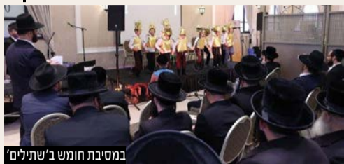
במסיבת חומש ב'שתילים'

תנופת עשייה בקצב מהיר: בהנחיית ראש המסיבת חומש מרגשת במיוחד התקיימה באחרונה עת חגגו ילדי כיתה א' בת"ת 'איילת השחר' שע"י רשת 'שתילים' את תחילת לימודי החומש. האירוע רב הרושם התקיים ברוב פאר והדר באולם באיאן בהשתתפות ההורים ובני המשפחה.