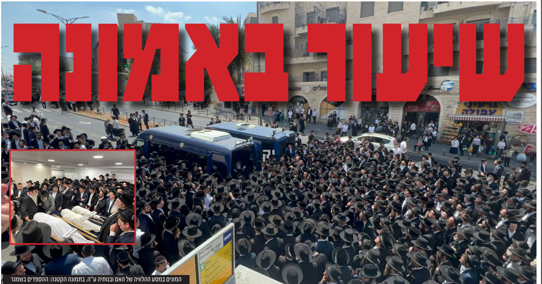
המונים במסע ההלוויה של האם ובנותיה ע"ה. בתמונה הקטנה: ההספדים בשמגר

שעה שמיטותיהם מונחות זו לצד זו, וכאשר מסביב מאות מלווים ממררים בכני על האסון הכבד, הצדיק הנעל והאב הגאון רב דב גלושטיין את הדין ואמר: "קיבלנו את אמא לפרק זמן קצוב. לא היה צריך יותר מזה, קיבלנו את שרה לפרק זמן קצוב לא היה צריך להיות יותר מזה. קיבלנו את חני לפרק זמן קצוב לא היה צריך להיות מזה, בזה אנחנו מאמינים, שה' ינחם אותנו"