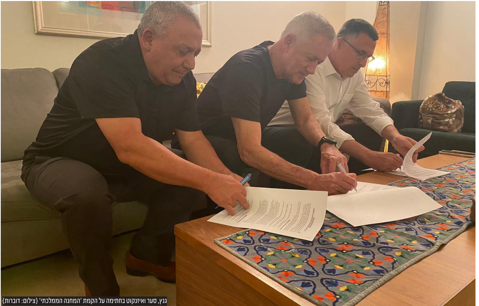
גנץ, סער ואיזנקוט בחתימה על הקמת 'המחנה הממלכתי'

ברקע, נתניהו בוחש מאחורי הקלעים. כדרכו, הוא מנסה להנדס את מפלגות הגוש בכדי שלא לאבד אף קול. השבוע אף הציע יו"ר הליכוד, כביכול במחווה אבירית מצידו, להציב את עידית סילמן במקום השביעי. בכך מנסה נתניהו לממש את הבטחת השריון לסילמן מבלי שזה יבוא על חשבונם של ח"כי הליכוד. בינתיים, סילמן במצב בעייתי: טרם נמצא הרוב שיצביע על היותה סיעת יחיד. ומשכך, לא ברור אם תוכל לקבל שריון בבחירות הנוכחיות. על הבטחות לכהן כשרה לאחר הבחירות היא יכולה להתייעץ עם ניר ברקת ומשה פייגלין.