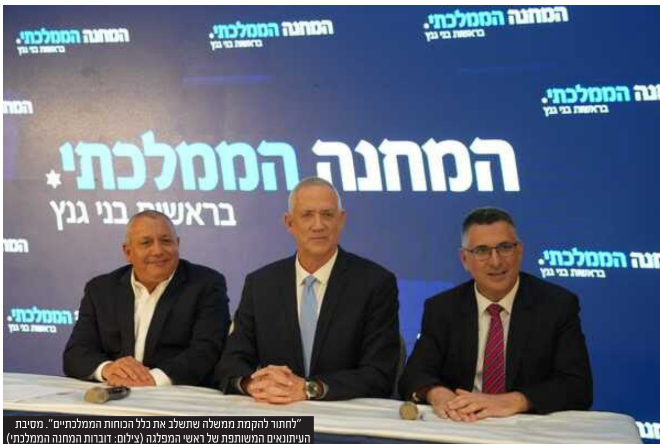
"לחתור להקמת ממשלה שתשלב את כלל הכוחות הממלכתיים". מסיבת העיתונאים המשותפת של ראשי המפלגה

עוד אמר הרמטכ"ל לשעבר: "לראייתנו, עלינו לחתור להקמת ממשלה שתשלב את כלל הכוחות הממלכתיים הפועלים בישראל, תחזיר את היציבות השלטונית ותקדם את השיח המכבד ואת האינטרסים הלאומיים. אנו ניצבים בפני אתגרי בטחון-לאומי מהותיים, ואין לנו את הזכות לא להקים ממשלה