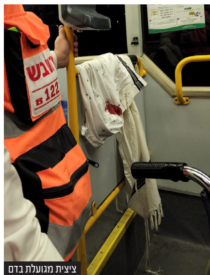
צפיצית מגועלת בדם

חברת הכנסת אורית סטרוק אמרה: "פיגוע הירי במעלה השלום: ירושלים רוויה בנשק בלתי חוקי. כל מי שגר או מבקר בה שומע זאת בלילות. את הנשק הזה צריך היה לאסוף הרבה לפני שהוא יורה על מתפללים בדרכם הביתה מהכותל. עכשיו, כשכוחות הביטחון פושטים על שכונת סילוואן הסמוכה - שלא יצאו ממנה לפני שמנקים לפחות אותה מכל כלי הנשק".