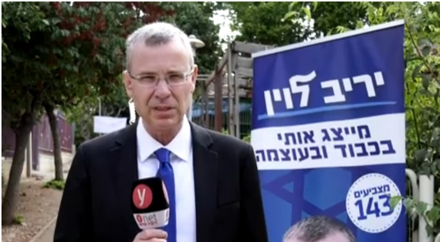
שמונים אלף איש הצביעו לנתניהו ולנאמניו. הפריימריז בליכוד

» כנדוניה, צורף גם מתן כהנא, שצירופו עד כה נמנע - לפחות על פי השמועה - בגלל וטו חרדי. המפלגות החרדיות רמזו לגנץ בסוג של קריצה שאם יש על מה לדבר ביום שאחרי, יהיה זה רק בלי שר הדתות לשעבר, וגנץ נמרח עם ההחלטה. יש רגליים לדבר שהאמירה החד משמעית של יו"ר דגל התורה, ח"כ משה גפני, על כך שהחרדים ילכו עם נתניהו גם לאופוזיציה, הייתה סוג של סתימת הגולל עבור גנץ המאוכזב. לא מן הנמנע שצירוף כהנא היה גם מעשה של התרסה מצדו