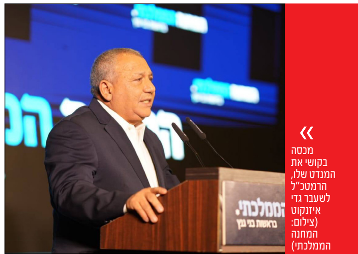
« מנסה בקושי את הרמטכ"ל לשעבר גדי איזנקוט

כל מי שהעז לערער על שליטתו של נתניהו בליכוד, אפילו במרומז, כפי שעשו זאת ישראל כץ ומירי רגב, וקל וחומר במפורש בסגנון יולי אדלשטיין, נענש. כץ לא ביקר כבר 16 שנה בעשירייה השנייה ואדלשטיין קרס מהמקום הראשון לקמפיין גוואלד נואש. אחרים, שנאמנותם לליכוד הייתה חשובה במקצת, כמו ח"כ קרן ברק או גלעד שרון, נשארו הרחק מאחור. גם הגימיקים שאיימו על תדמית הליכוד, כמו מעניקת תליון הנאמנות או מועמדים בעייתיים אחרים, נותרו בגדר קוריוז עם מאות בודדות של קולו