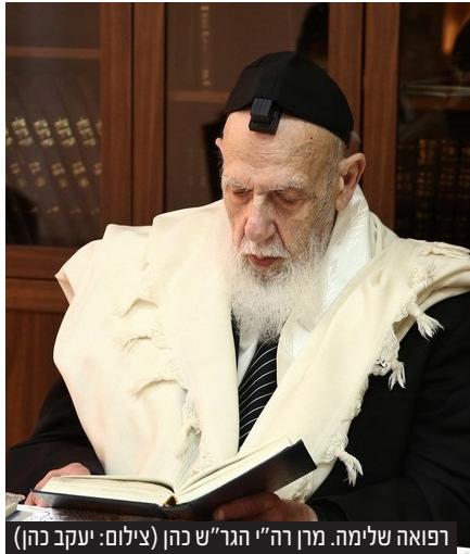
רפואה שלימה. מרן רה"ג הגר"ש כהן ולהוסיף בלימוד התורה בימים אלו, ימי בין הזמנים לרפואתו השלמה והתמדת בריאותו של מרן שלום בן תופחא מלכה בתושח"י.

מרן ראש הישיבה חכם שלום כהן אושפז בבית החולים הדסה עין כרם בירושלים, בשל זיהום שהתפתח ברגלו • מרן עובר סדרת טיפולים על ידי פרופ' מומחה שהובא במיוחד לשם כך • הציבור נקרא להתפלל לרפואת מרן שלום בן תופחא מלכה בתושח"י