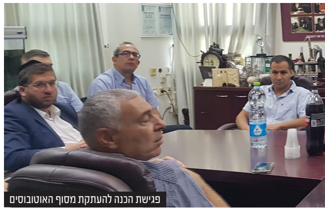
פגישת הכנה להעתקת מסוף האוטובוסים

במסגרת ההיערכות לבניית יחידות הדיור החדשות בשכונה בצפון מזרח העיר, נערכה השבוע פגישת הכנה להעתקת מסוף האוטובוסים למקומו הקבוע, וזאת במטרה לאפשר סלילת דרכים ובניית קיר אקוסטי נדרש, בסמיכות לשכונה החדשה.