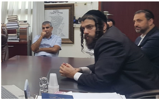
מאת: אלי כהן

במסגרת ההיערכות לבניית יחידות הדיור החדשות בשכונה בצפון מזרח העיר, נערכה השבוע פגישת הכנה להעתקת מסוף האוטובוסים למקומו הקבוע, וזאת במטרה לאפשר סלילת דרכים ובניית קיר אקוסטי נדרש, בסמיכות לשכונה החדשה.