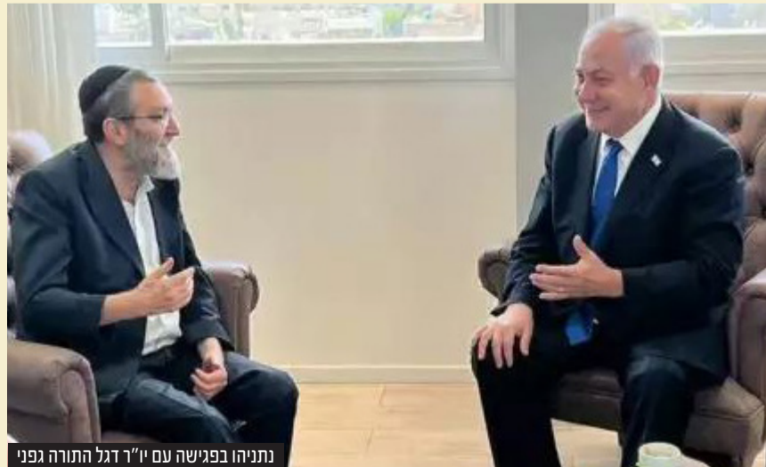
נתניהו בפגישה עם יו"ר דגל התורה גפני

עוד הוסיף ואמר כי "כולם למדו במהלך השנה הזאת כמה רע יכול להיות אם אנחנו לא נמצאים בשלטון. עשיתי חשבון נפש והגעתי לתשובה: צריך ללכת עם הליכוד