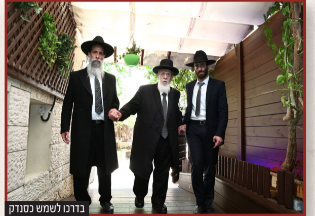
בדרכו לשמש כסנדק