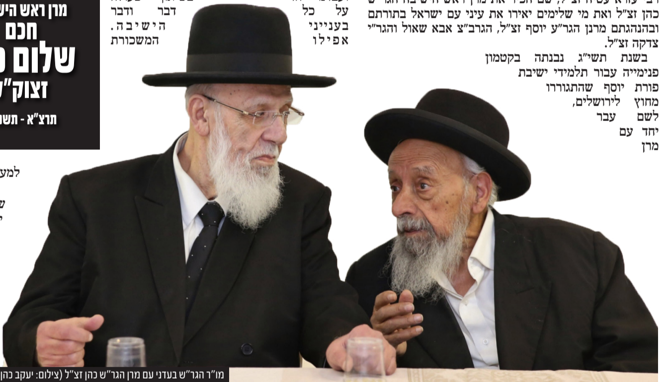
מו"ר הגר"ש בעדני עם מרן הגר"ש כהן זצ"ל

הגר"ש בעדני מספר על 'הוויכוח' שהיה לו עם חכם שלום זצ"ל. "לפני תשע שנים לאחר שמרן רבי עובדיה יוסף זצ"ל הלך מעימנו, הוצע לנו לעמוד בנשיאות המועצת של חכמי התורה של תנועת ש"ס. היה בינינו ויכוח. אני אמרתי לו: אתה תנהיג והוא אמר לי: אתה תנהיג. וכך במשך חודשים ארוכים. כל אחד רצה שהשני יקח את ההנהגה. אני התעקשתי שחכם שלום הוא זה שמתאים להנהיג את הציבור הספרדי. בסופו של דבר ניצחתי בוויכוח אחרי שאמרתי לו שבגלל שהוא כהן, אסור להוריד אותו בדרגתו. בסוף הוא נכנע וקיבל עליו את ההנהגה. גם אחרי שמונה לכהן כנשיא המועצת נשארו אוהבים זה את זה והתייעצנו ביחד על כל דבר ועל כל נושא".