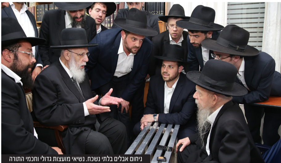
ניחום אבלים בלתי נשכח. נשיאי מועצות גדולי וחכמי התורה

מרן ראש הישיבה חכם שלום כהן זצוק"ל תוצ"א - תשפ"ב