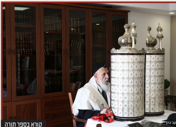
קורא בספר תורה