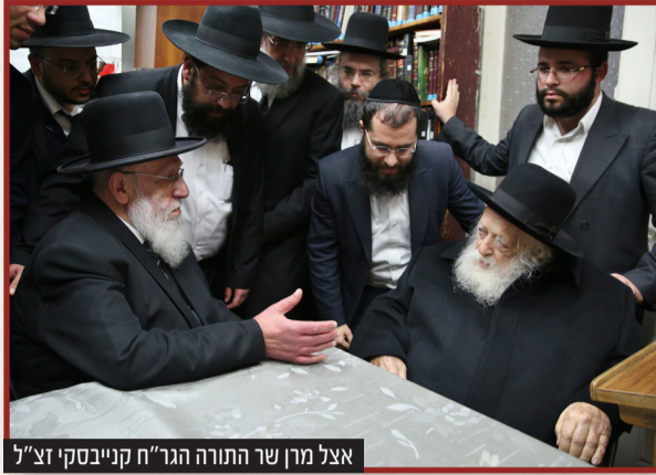
אצל מרן שר התורה הגר"ח קנייבסקי זצ"ל