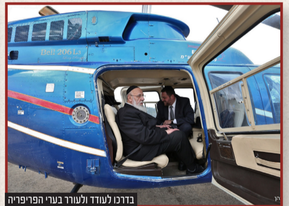
בדרכו לעודד ולעודד בערי הפריפריה