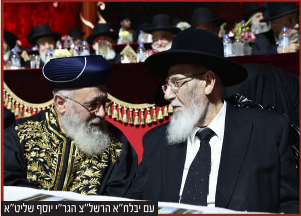
עם יבלח"א הרשל"צ הגר"י יוסף שליט"א