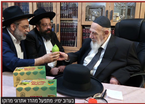
בערוב ימיו: מתפעל מהדר אתרוגי מרוקו