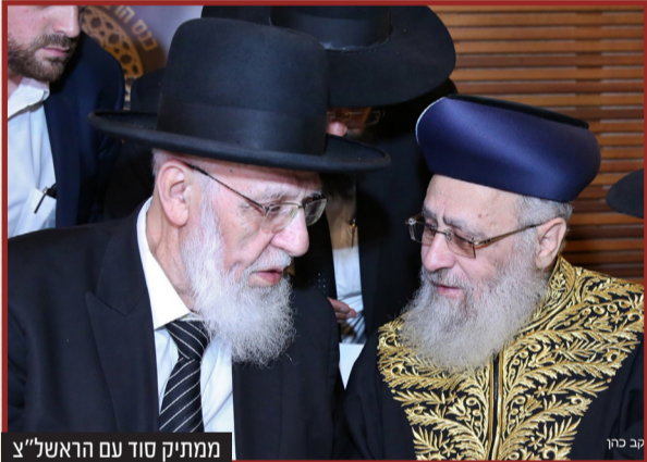
ממתיק סוד עם הראשל"צ