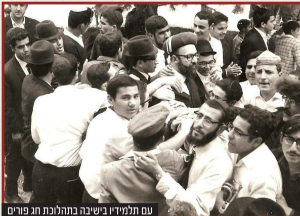
עם תלמידיו בישיבה בתהלוכת חג פורים