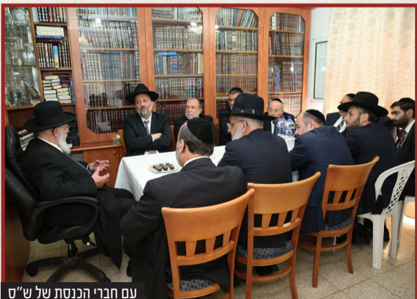
עם חברי הכנסת של ש"ס