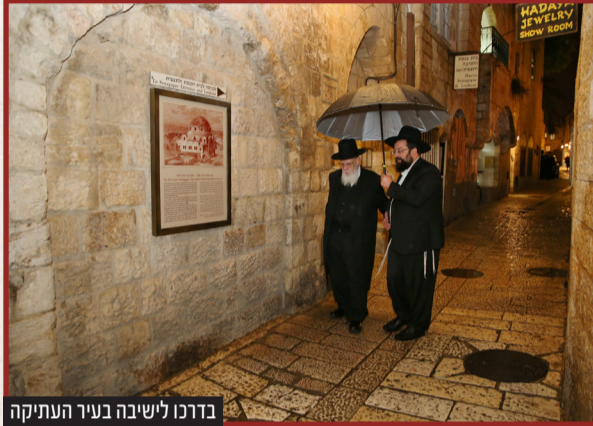
בדרכו לישיבה בעיר העתיקה