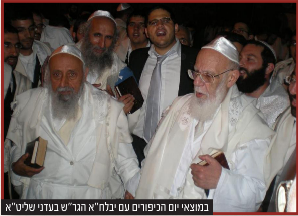
במוצאי יום הכיפורים עם יבלח"א הגר"ש בעדני שליט"א