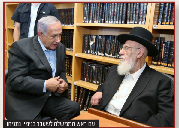
עם ראש הממשלה לשעבר בנימין נתניהו