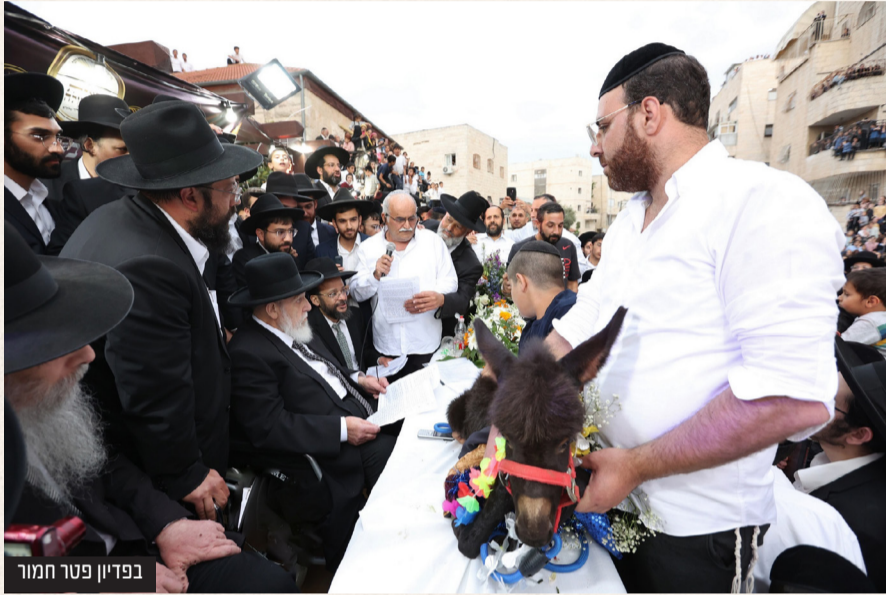
בפד"ן פטר חמור

אלו דבריו בתחילת מכתבו שעורר הדים רבים בכל גווי הציבור בארץ. בהמשך מכתבו מתייחס נשיא מועצת החכמים למפתים שפועלים לגייס בני ישיבות לצבא בפיתויים שונים ומשונים, וכותב: "כל המפתים והמסייעים הם בכלל מחטיאי הרבים, וכתב רבינו הרמב"ם שאין להם חלק לעולם הבא, ואובדין ונידונין על גודל רשעם וחטאתם".