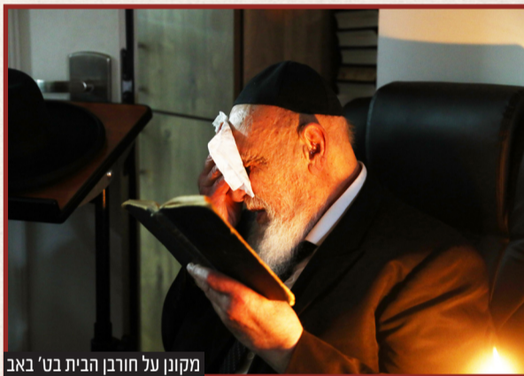
מקונן על חורבן הבית בט' באב