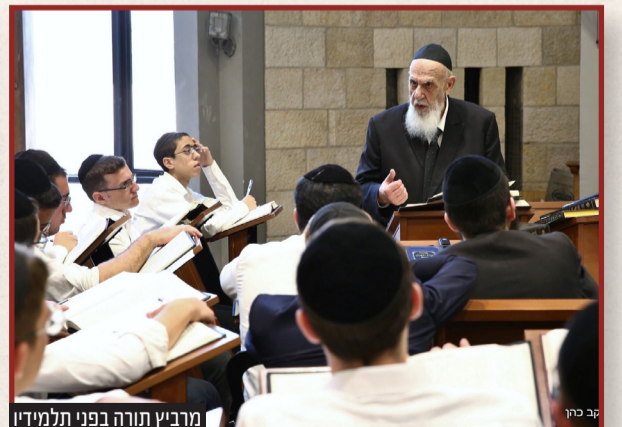
מרביץ תורה בפני תלמידיו