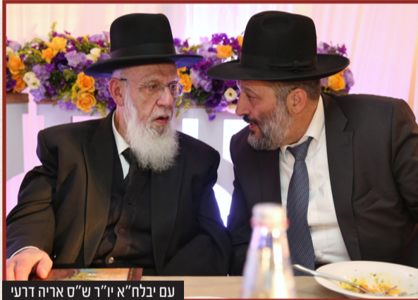
עם יבלח"א יו"ר ש"ס אריה דרעי