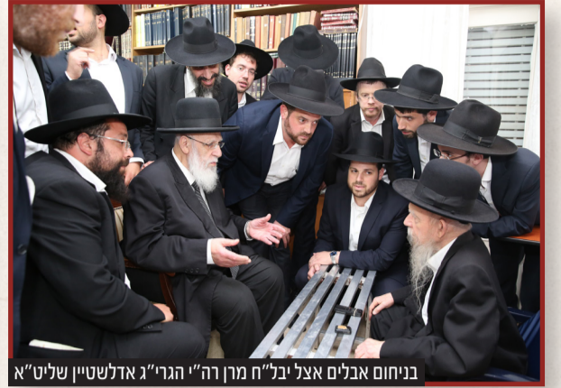
בניחום אבלים אצל יבלח"ח מרן רה"י הגרי"ג אדלשטיין שליט"א