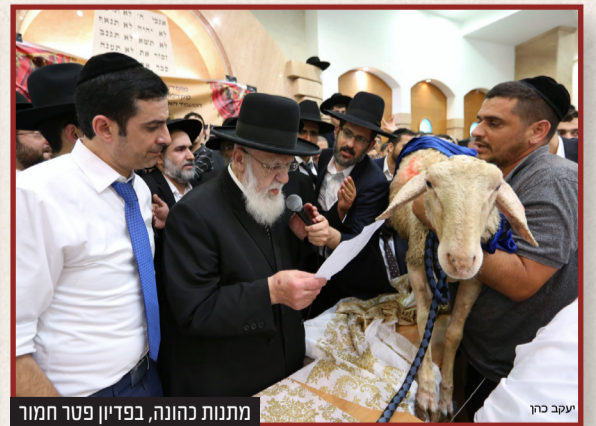
מתנות כהונה, בפדיון פטר חמור