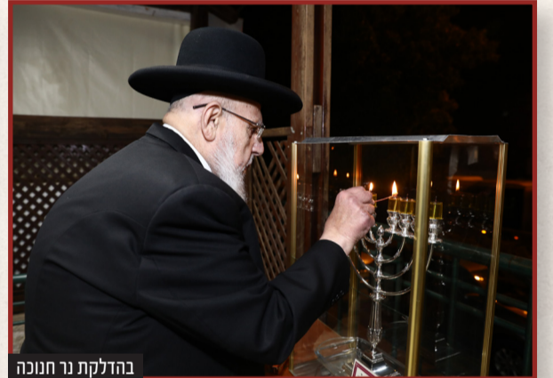
בהדלקת נר חנוכה