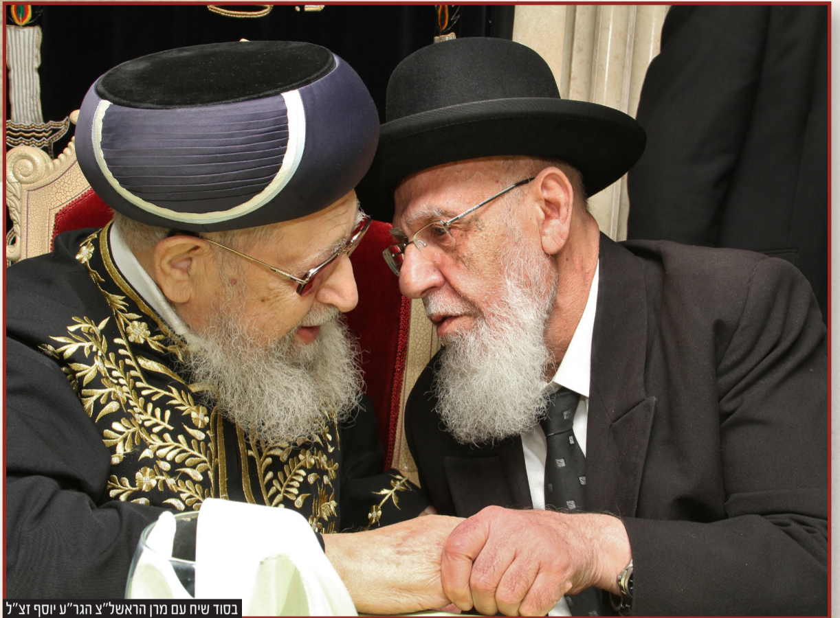
בסוד שיח עם מין הראשל"צ הגר"ע יוסף זצ"ל