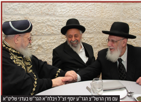
עם מין הראשל"צ הגר"ע יוסף זצ"ל ויבלח"א הגר"ש בעדני שליט"א