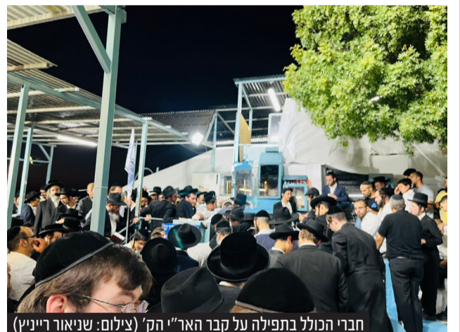
חברי הכולל בתפילה על קבר האר"י הק'