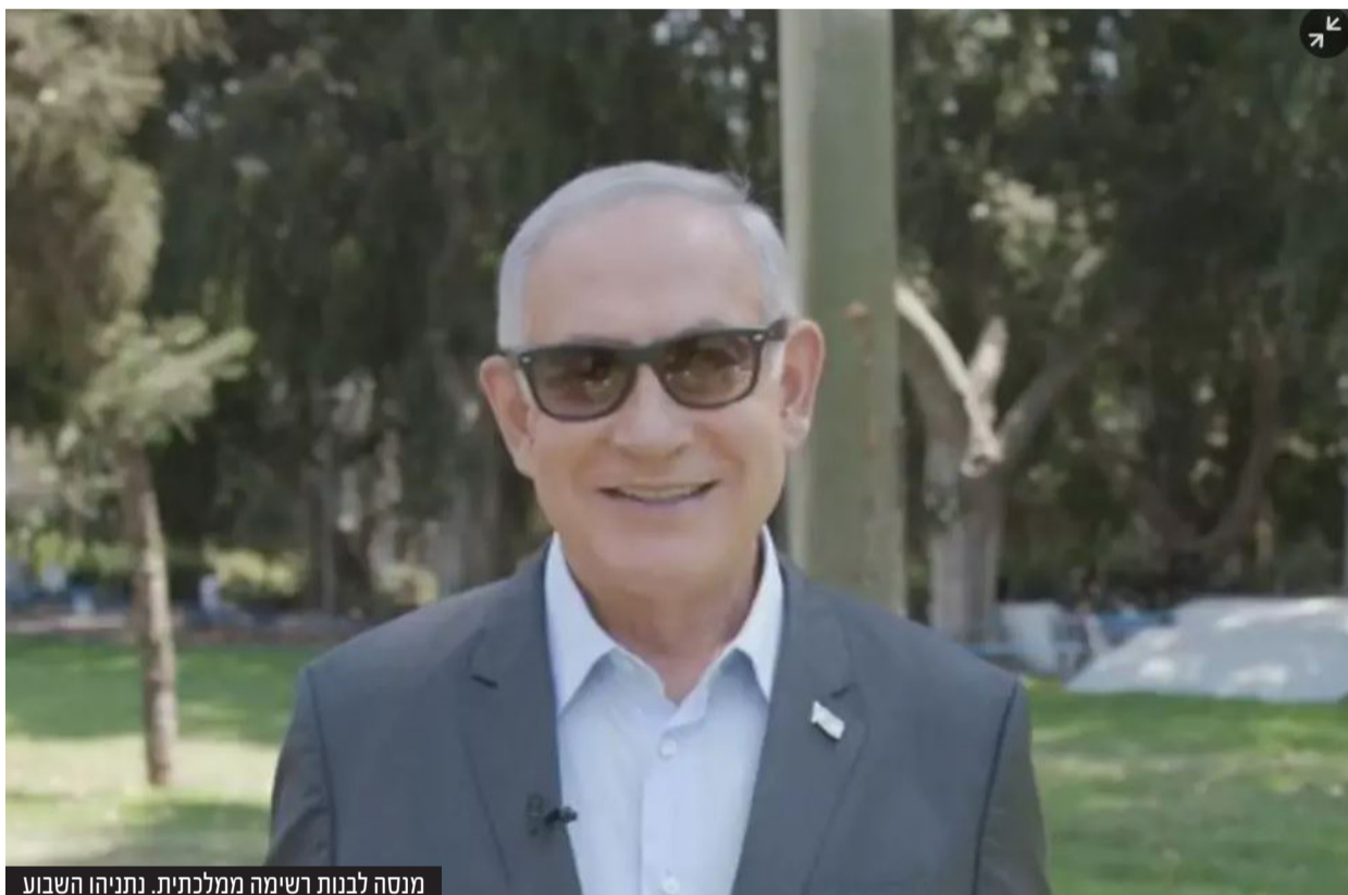
מנסה לבנות רשימה ממלכתית. נתניהו השבוע

"פוליטיקאי צריך לדעת לחזות מה יקרה מחר, בעוד שבוע, בעוד חודש ובעוד שנה. ולאחר מכן להסביר מדוע זה לא מה שקרה", אמר וינסטון צ'רצ'יל, האיש שהעניק לאומה הבריטית כמה מהנאומים שנכנסו לפנתיאון והותירו חותם לדורות הבאים. השבוע האחרון לימד את כולנו שבמציאות הישראלית המורכבת, מלחמות ופוליטיקה שזורות זו בזו. שבוע שהחל עם הדי הרעמים במבצע 'עלות השחר', המשיך עם תוצאות הפריימריז בליכוד ובעבודה ויסתיים עם פוליטיקה ישנה, כאילו לא נורו למעלה מאלף רקטות על יישובי העוטף וערי הדרום. מי שבונה על תזווות בסקרים יממה לאחר סיומה של הלחימה, לא היה כאן בסבבי הבחירות הקודמים. עד פתיחת הקלפיות ב-1 לנובמבר, מבצע 'עלות השחר' יישאר רק כערך בוויקיפדיה. הזיכרון הישראלי הוא קצר מועד. מבצעים צבאיים או מלחמות לא מותירות חותם על הלכי הרוח של החברה הישראלית. כמדינה למודת מלחמות, אף אחת מהן לא גרמה למהפך תודעתי, למעט מלחמת יום הכיפורים שתוצאותיה הקשות חלחלו לתודעה הישראלית והובילו בחלוף ארבע שנים למהפך שהעלה לראשונה את הליכוד לשלטון בבחירות 77. אף פוליטיקאי, לפחות לא מאלו שכבר נמצאים על המגרש הפוליטי, לא הפליא עד כה בתחזיותיו. בשלהי 2018 איש לא העריך שמדינת ישראל תתגלגל לחמש מערכות בחירות בשלוש שנים וחצי. ישראל ידעה כבר ממשלות שלא השלימו את כהונתן, אך ממשלות שלא התחילו את כהונתן, זו המצאה ישראלית חדשה, תוצר מובהק של שיטת המשטר הפרלמנטרית, שאינה מתאימה לעידן הנוכחי.