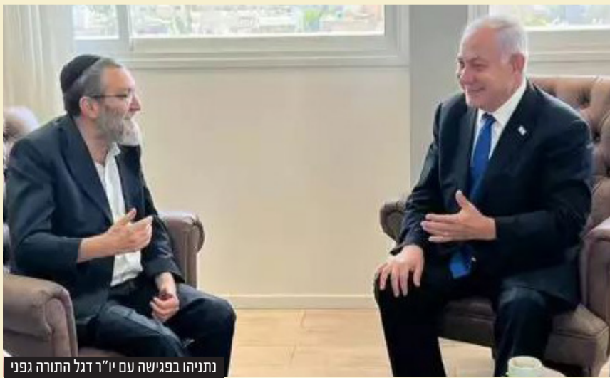
נתניהו בפגישה עם יו"ר דגל התורה גפני

עוד הוסיף ואמר כי "כולם למדו במהלך השנה הזאת כמה רע יכול להיות אם אנחנו לא נמצאים בשלטון. עשיתי חשבון נפש והגעתי לתשובה: צריך ללכת עם הליכוד