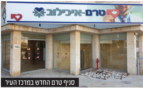
סניף טרם החדש במרכז העיר