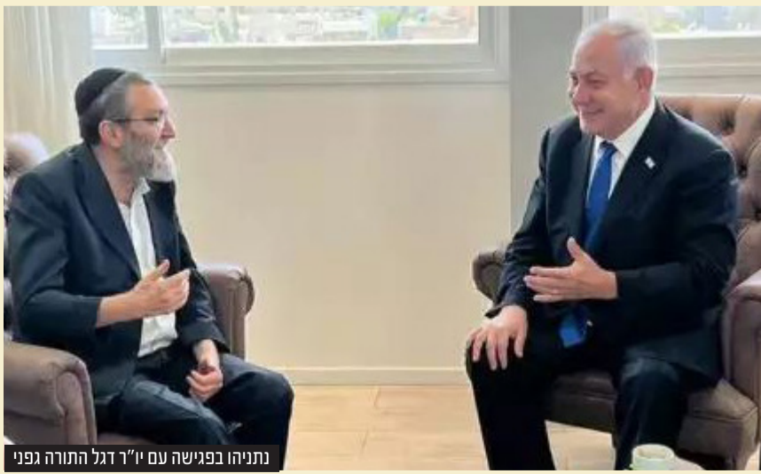
נתניהו בפגישה עם יו"ר דגל התורה גפני

בכל מקרה ולא להחליש את הגוש, גם לאופוזיציה". בשבוע שעבר נפגש נתניהו גם עם יו"ר דגל התורה וגם עם יו"ר אגו"י הטרי יצחק גולדקנופף, עימו נפגש נתניהו לראשונה במהלך הפגישה התחייב גולדקנופף לנתניהו: "אנחנו הולכים רק איתך. לא גנץ ולא לפיד. רק איתך".