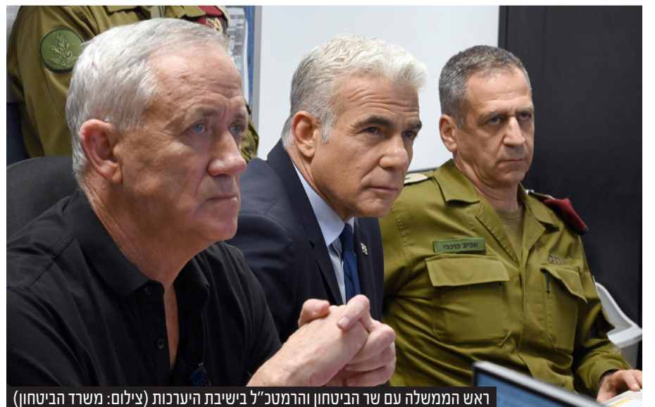
ראש הממשלה עם שר הביטחון והרמטכ"ל בישיבת היערכות