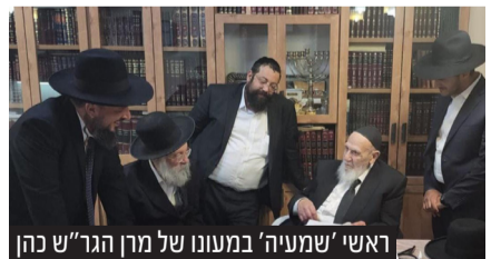
ראשי 'שמעיה' במעונו של מרן הגר"ש כהן

בסיום הביקור בירכו מרנן שליט"א את ראשי ופעילי הארגון בברכת הצלחה מרובה באומרם כי כל המשתדל בעבור נשמות קדושות אלו אשר מזדככות בייסורים ודאי מובטח לו שיזכה למידה כנגד מידה שלא יאונה כל רע לו ולב"ב.