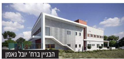
הבניין ברח' יובל נאמן