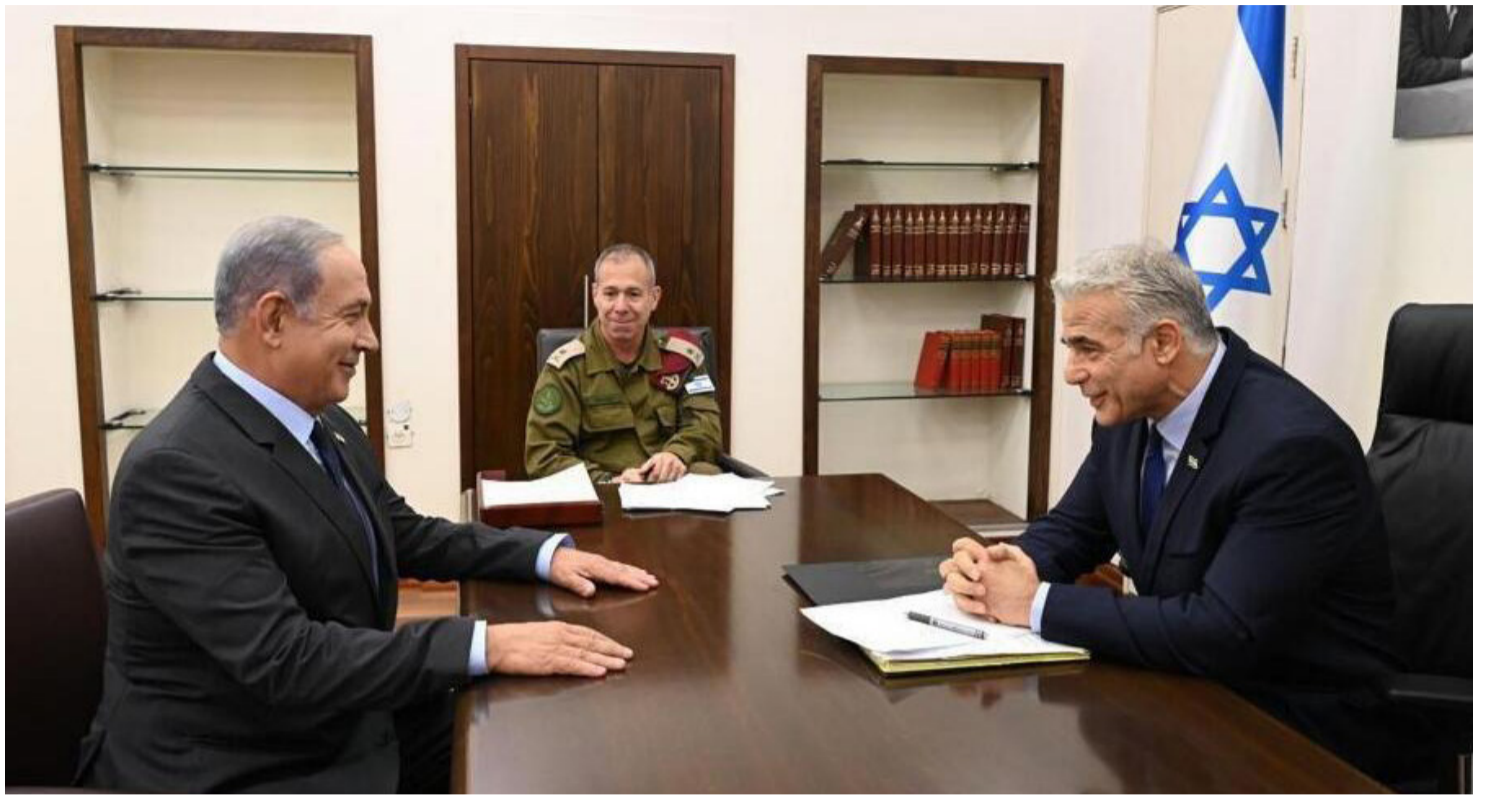
משחקי מלחמה. תמונת המפגש של ראש ממשלת המעבר וראש הממשלה לשעבר

עד לא מזמן היה יציב, כמו גילה גמליאל ואופיר אקוניס, יודעים ששום דבר לא יינתן להם על מגש. מעטים ישרדו, הרוב יישארו בגדר קוריוז לחובבי חן ומשתתפי שעשועוני טריוויה.