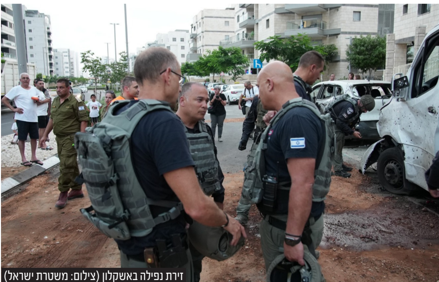
זירת נפילה באשקלון