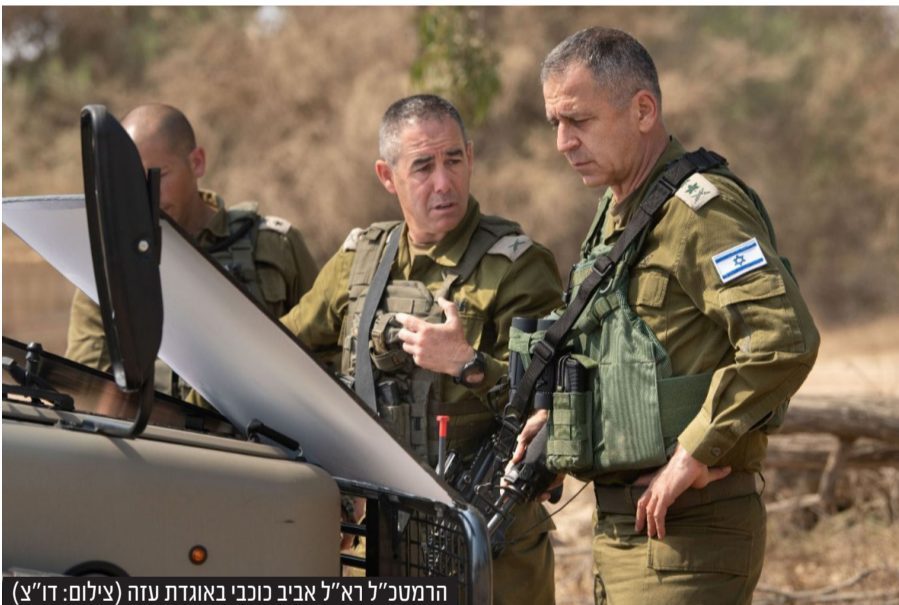
הרמטכ"ל רא"ל אביב כוכבי באוגדת עזה

תושבי עוטף עזה ויישובי הדרום מקווים שהשקט יישמר לאורך זמן. "במבצע 'שומר חומות' הרתענו את חמאס, אני מקווה שבמבצע 'עלות השחר' הרתענו גם את הג'יהאד האיסלאמי", אמר אחד מתושבי הדרום שרגיל לסכבים אינסופיים של צה"ל בעזה.