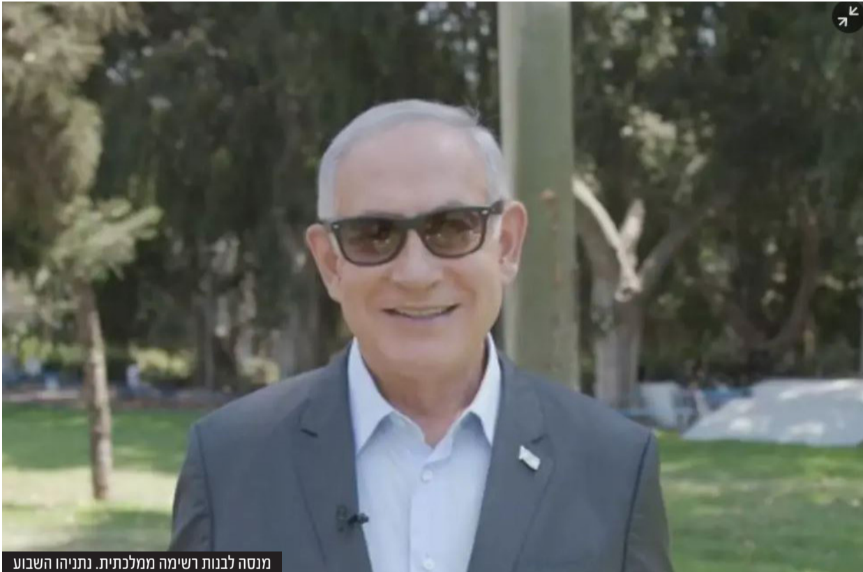
מנסה לבנות רשימה ממלכתית. נתניהו השבוע

שחורה ב-2019. אלו דברי הביקורת שנשמעים כיום מפיהם של ח"כי הליכוד, עם תום המערכה הנוכחית. המיילים דומות, המוזיקה דומה. בעידן שבו האופוזיציה מחויבת לחשק את גלגליה של הממשלה המכהנת, האבסורד זועק לשמים. הארכיון עמוס בציטוטים של ראשי הקואליציה הנוכחית בגנותן של הממשלות הקודמות שפעלו כפי שהממשלה הזו פעלה. עוד לא נבחר ראש ממשלה שלא אמר בסיומו של כל מבצע צבאי בעזה: החזרנו את ההרעה. נתניהו אמר זאת לאחר 'צוק איתן', 'עמוד ענן', 'חגורה שחורה' ו'שומר חומות'. אולמרט אמר זאת לאחר 'גשמי קיץ' ו'עופרת יצוקה'. שרון אמר זאת לאחר 'חומת מגן' ו'קשת בענן'. לפיד אינו שונה והמסר המרכזי שלו לאחר מבצע 'עלות השחר', כמה צפוי: החזרנו את ההרעה. יחד עם הניסיונות להרתיע את האויב, ראש הממשלה, כל ראש ממשלה, מנסה להחזיר גם את ההרתעה הפוליטית. לפיד מנסה לקבוע את מעמדו כמי שבכוחו להוביל את ישראל גם במערכה צבאית אל מול אתגר בטחוני ראשון במעלה. נתניהו, שבמשך שנים משווק עצמו כ'מר ביטחון', מבקש לומר לציבור הישראלי, תחת הנהגתי הישגי המבצע היו גדולים יותר. עבור תושבי הדרום הרגילים למנות קבועות של ירי טילים על בתיהם, ההרתעה לא חזרה לשום מקום. עבורם הפסקת אש, היא לא יותר מהפסקה בבית הספר. הם יסמכו לשמוע שהחופש הגדול הגיע. עד אז, הם נערכים לשיעור הבא. גם הם יודעים שהשיעור בערבית הוא הפחות האהוב על ילדיהם שהתרגלו לישון במרחבים מוגנים.