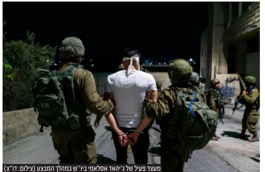
מעצר פעיל של ג'יהאד אסלאמי ביו"ש במהלך המבצע