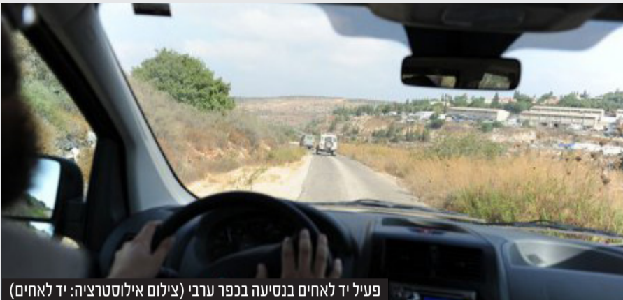
פעיל יד לאחים בנסיעה בכפר ערבי

האישה מיהרה לעדכן את ארגון הפעילים 'יד לאחים' שהכניס לתמונה את השב"כ שעצר לחקירה את הבעל הערבי שאיים על אשתו היהודייה כי יבצע פיגוע אם תעזוב אותו