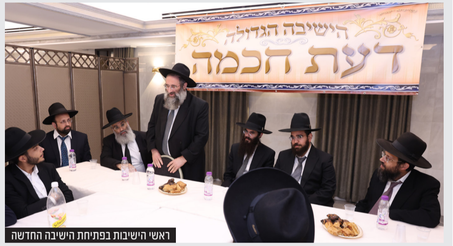
ראשי הישיבות בפתיחת הישיבה החדשה

השבוע התקיים בבני ברק מעמד הכנה לבני שיעור א' שהתקבלו לישיבה הגדולה החדשה 'דעת חכמה' בראשות הגאון רבי יעקב קדוש. במעמד השתתפו הגר"י רוזן ר"י אור ישראל, הגר"א ויזמן ר"י יסודות, המשגיח הגר"ח משקובסקי וראשי ורבני הישיבה. את המשא המרכזי נשא הגר"י רוזן שאמר שמייסדי מקום תורה חדש הם בבחינת ארון הברית וכשם שהארון נשא את נושאי, כך המייסדים מקום