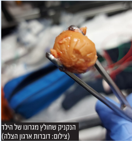
הנקניק שחולץ מגרונו של הילד

בהנחיות שהוציאו בעבר באגף הרפואה של "איחוד הצלה" נכתב: "הדרך למנוע חנק בקרב ילדים - לחתוך את האוכל לחתיכות קטנות ולהקפיד ללמד את הפעוטות והילדים ללעוס היטב את המזון לפני הבליעה".