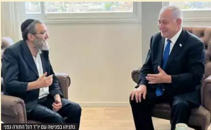
נתניהו בפגישה עם יו"ר דגל התורה גפני

עוד הוסיף ואמר כי "כולם למדו במהלך השנה הזאת כמה רע יכול להיות אם אנחנו לא נמצאים בשלטון. עשיתי חשבון נפש והגעתי לתשובה: צריך ללכת עם הליכוד