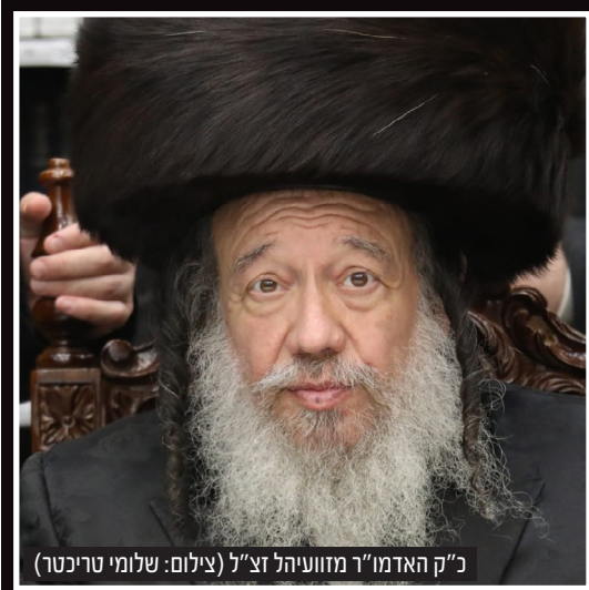
כ"ק האדמו"ר מזוועיהל זצ"ל

בס"ד • העיתון המרכזי של בית שמש מבית רשת 'קו עיתונות' • יום חמישי ה' אלול תשפ"ב 1/9/22 • גיליון מס' 652 קו עיתונות