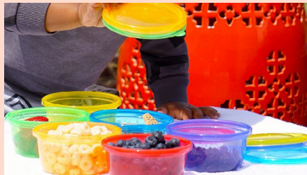
שש קערות עם מכסה מבית NUBY

מעל לחודש עבר מאז החל החופש הגדול, כבר עשינו המון פעילויות עם הילדים והרעיונות היצירתיים כמעט ונגמרים • עם זאת, נותרו עוד מספר שבועות לבלות זמן איכות עם הקטנים, לדאוג לתעסוקתם על מנת שלא ישתעמו ויתנהגו בהתאם • טיפים להורים להתמודדות עם הילדים בשארית ימי החופש הנותרים