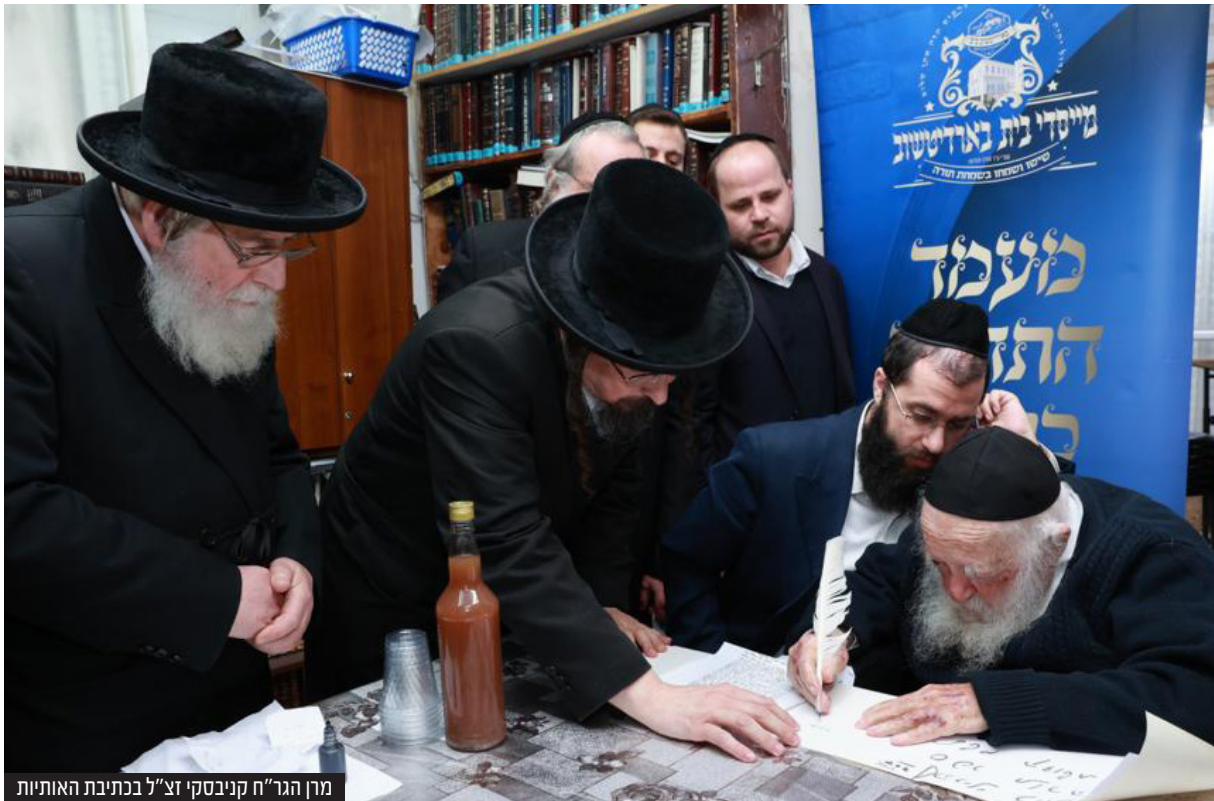
מרן הגר"ח קנייבסקי זצ"ל בכתיבת האותיות