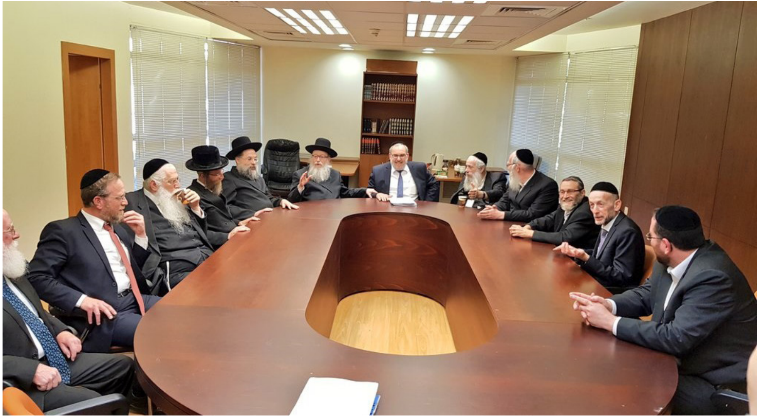
ביחד או לחוד? חברי הכנסת של יהדות התורה בימים יפים יותר