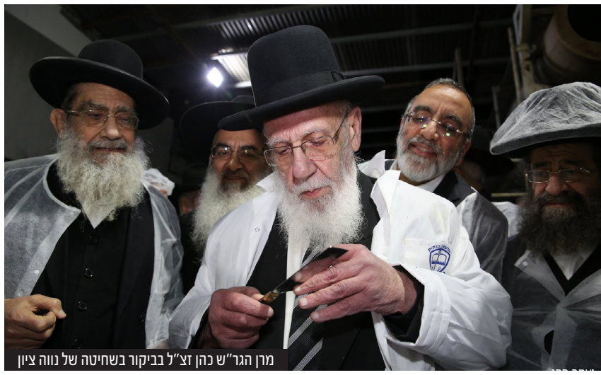
מרן הגר"ש כהן זצ"ל בביקור בשחיטה של נוה ציון