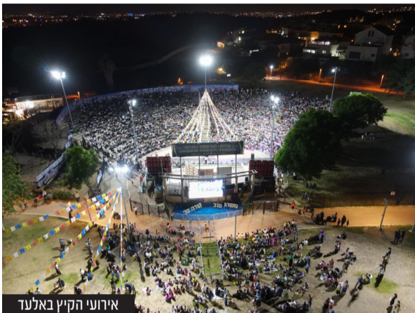
אירועי הקיץ באלעד

עומד על 40 שקלים בלבד, ברכישת כרטיסים במתנ"ס העירוני ברחוב רבי חייא. מדובר על הוזלה של 20 שקלים לכרטיס רגיל שעולה 60 שקלים. במקביל סוכם עם חברת קווים על תגבור הנסיעות והארכת קו האוטובוס הפנימי בימי בין הזמנים עד הכניסה לנחשונים, בחלק ניכר משעות היום, וזאת כדי לאפשר לתושבים להגיע בנוחות למקום.