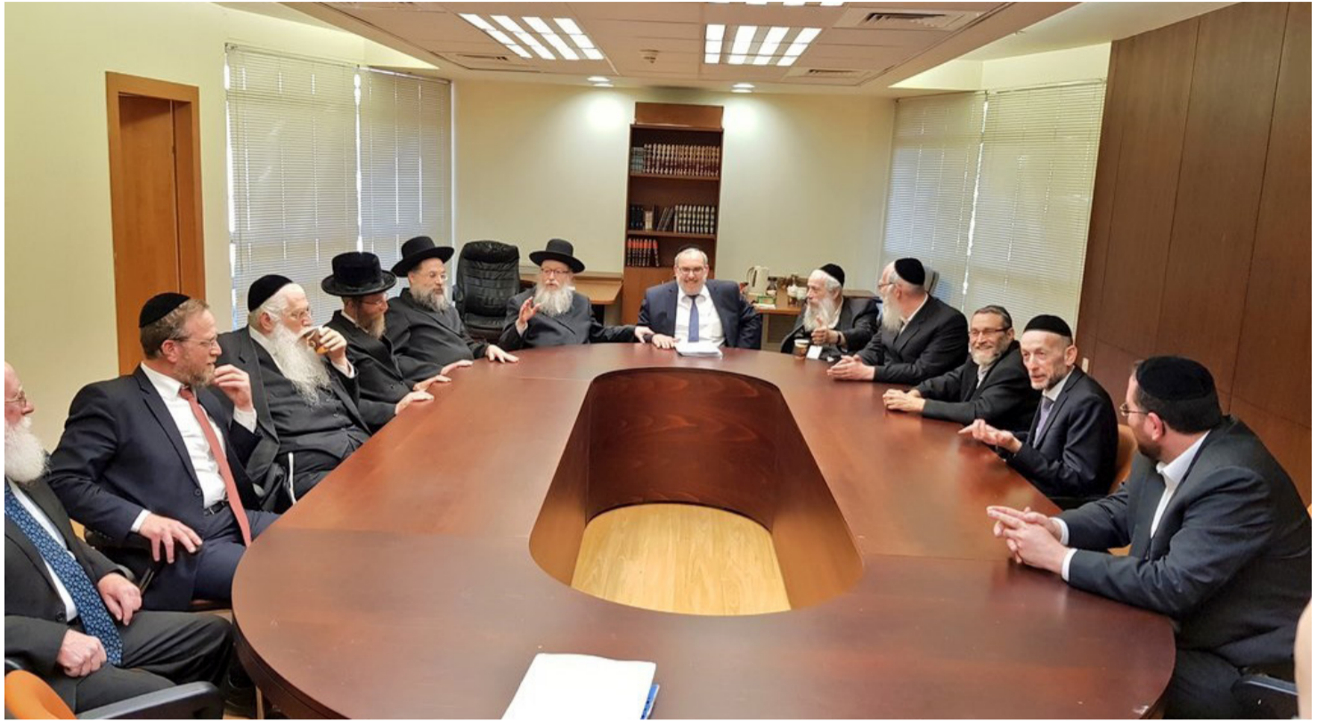
ביחד או לחוד? חברי הכנסת של יהדות התורה בימים יפים יותר