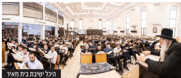
היכל ישיבת בית מאיר