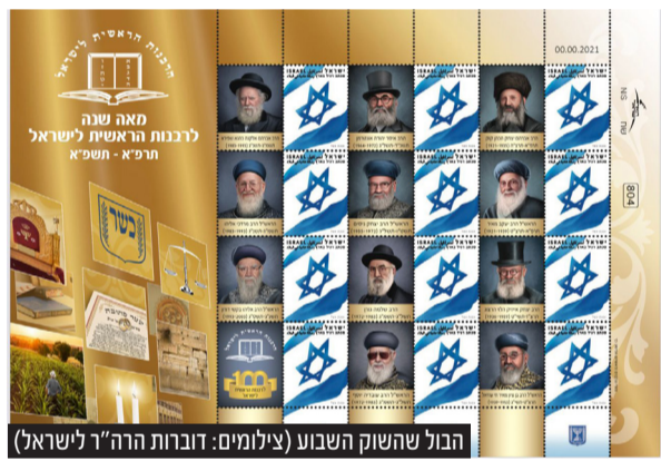
הבול שהשוק השבוע