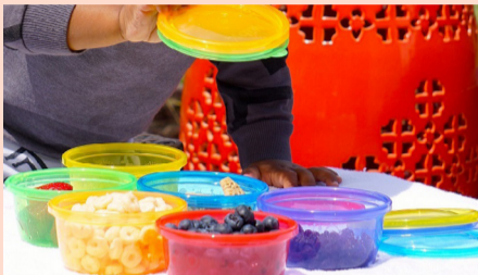
שש קערות עם מכסה מבית NUBY

מעל לחודש עבר מאז החל החופש הגדול, כבר עשינו המון פעילויות עם הילדים והרעיונות היצירתיים כמעט ונגמרים • עם זאת, נותרו עוד מספר שבועות לבלות זמן איכות עם הקטנים, לדאוג לתעסוקתם על מנת שלא ישתעממו ויתנהגו בהתאם • טיפים להורים להתמודדות עם הילדים בשארית ימי החופש הנותרים