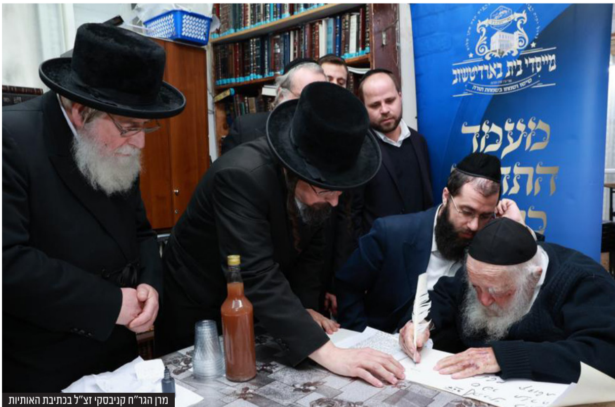
מרן הגר"ח קנייבסקי זצ"ל בכתובת האותיות