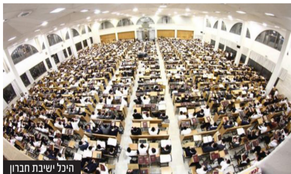
היכל ישיבת חברון

במרכז 'לנחותם' שע"י 'ועד הישיבות' שוקדים בהיערכות רבתית במשך כל השבועות האחרונים שקדמו לזמן אלול - מועד ראשית ותחילת השנה בהיכלי הישיבות, במתן מענה לפניות הרבות בתקופה זו, ובראשם לפונים בעניינם של תלמידים המבקשים לסייעם בסידורם במקום לימוד כראוי, כאשר במוקד המיוחד שע"י המרכז לשם מגיעים כלל הפניות, פועלים בצוותות מתוגברים במתן מענה לכלל הפניות, ובימים אלו פועלים אנשי המרכז בהשתדלות נמרצת מתוך שאיפה ותקווה להשלים בס"ד את המלאכה.