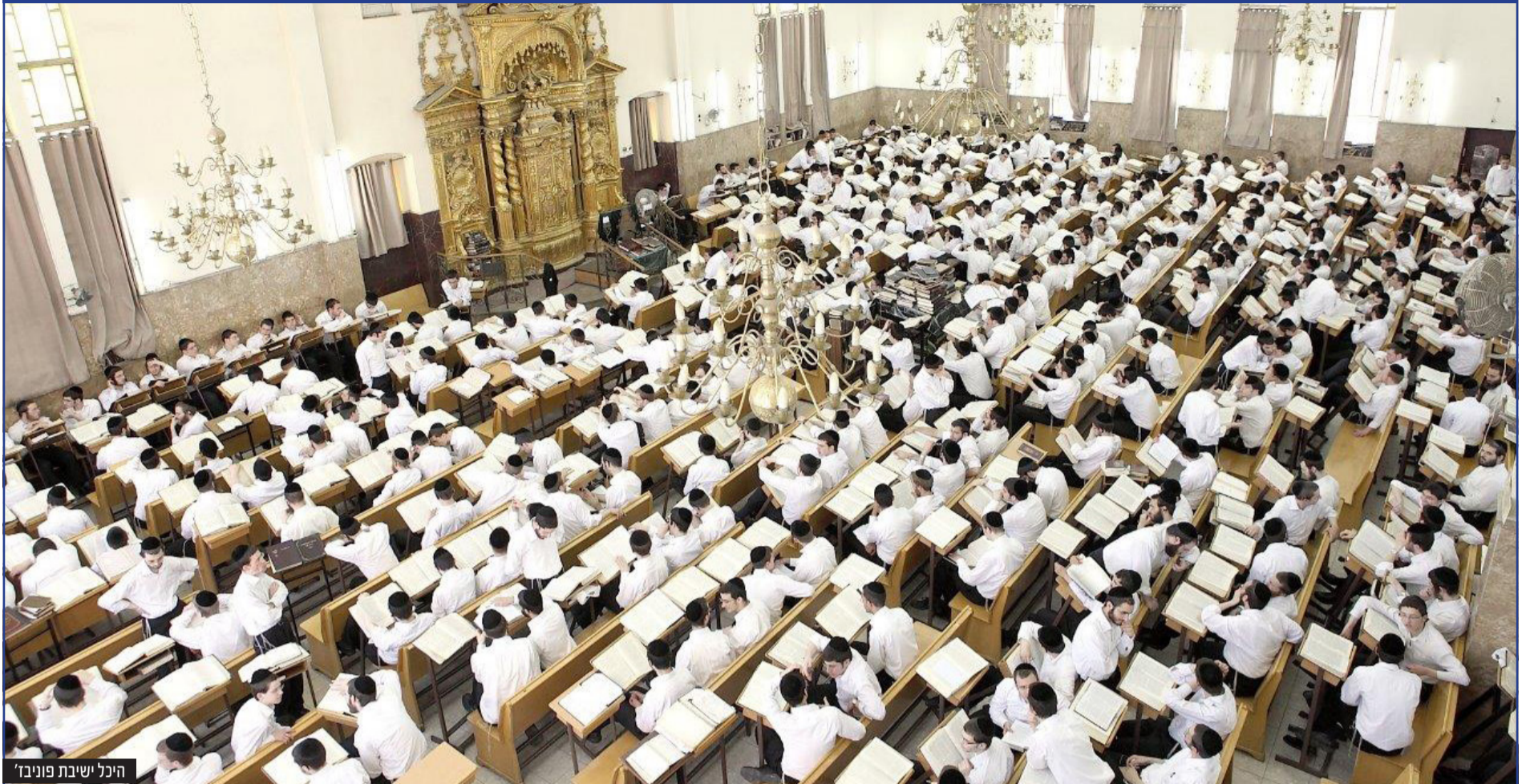
היכל ישיבת פוניב'ז