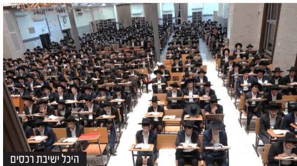
היכל ישיבת רכסים