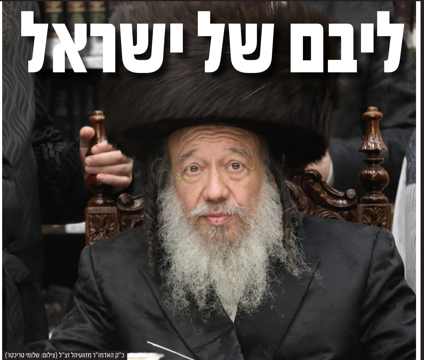
כ"ק האדמו"ר מזוועיהל זצ"ל

וצולל בנבכי הסוגיות בבקיאות מדהימה וחריפות עצומה. במהלך השיעור היה עומד בקצרה על כל נקודה ונקודה בסוגיה שהיתה טעונה ביאור והבנה ובמילים קצרות ותמציתיות היה מבאר ומיישב ברוחב דעתו. האדמו"ר זצוק"ל לא שימש רק כמגיד שיעור הבא לומר את שיעורו ולשוב לתלמידיו, אלא עמד מקרוב אחר שקידתם של תלמידי הישיבה, ופעמים רבות ניגש בעצמו בכדי לשאת ולתת עם תלמידי הישיבה במלחמתה של תורה. לעיתים תכופות כשראה שבחור יושב ללא חברותא התיישב בעצמו על ידו ולמד עמו בצוותא בכדי שלא יבוא חלילה לידי רפיון.