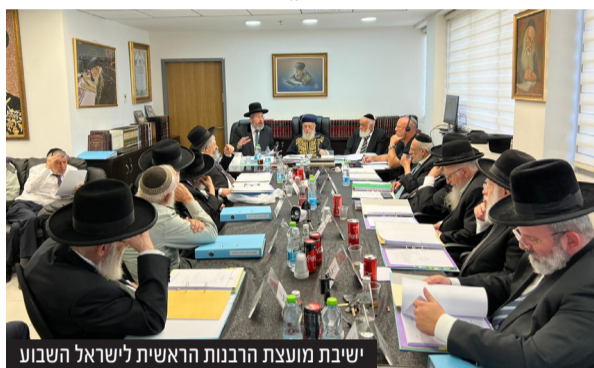
ישיבת מועצת הרבנות הראשית לישראל השבוע

מועצת הרבנות הראשית מברכת על פעילות האכיפה של הלשכה המשפטית בעניין, אותם רבני הנותנים כשרות מחוץ