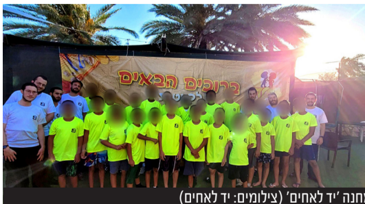
ילדים שחולצו לאחרונה מכפרים ערביים במחנה 'יד לאחים'

בהודעה נוספת מתוך רבות ביקשה אחת האימהות להדגיש: "אין מילים. יד לאחים הם מלאכים. הילדים חוזרים באורות אני יודעת כמה עבדתם קשה יום וילילה בשביל שהמחנה הזה יצא אל הפועל עם הפרטים הקטנים עד הגדולים לעזוב משפחה ילדים ולהירתם ולהיות חלק מהדבר הגדול הזה".