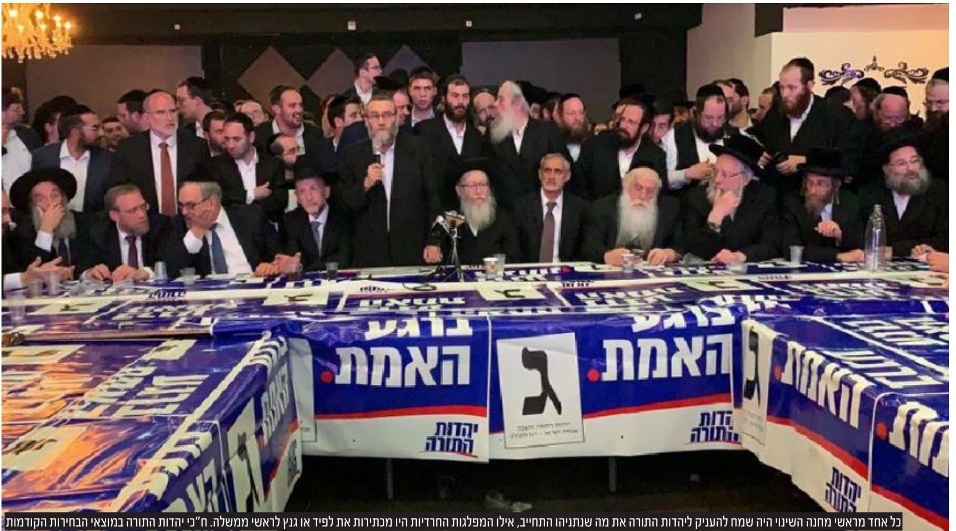
כל אחד מראשי מחנה הימני היה שמח להעניק ליהדות התורה את מה שנתניהו התחייב, אילו המפלגות החרדיות היו מכתירות את לפיד או גנץ לראשי ממשלה. ח"כ יהדות התורה במוצאי הבחירות הקודמות

תקומה, מולדת, הימין החדש, ימינה, הבית היהודי, המפד"ל, איחוד מפלגות הימין, נעם ועוצמה יהודית. כבר כעת נשמעים קולות מתוך מפלגתו של בן גביר שמתנערים מדרכו. מיכאל בן ארי וברוך מרזל, מייסדי עוצמה יהודית, שדרכם לכנסת נחסמה ע"י בג"צ, הכריזו על הפסקת התמיכה במפלגה שהם נמנים עם מייסדיה. תהיו בטוחים שעוד נשמע על הקמתה של מפלגה חדשה שמסבירה לאזרחי ישראל מדוע ח"כ איתמר בן גביר אינו מייצג את ערכי הימין. את הצרות האלו משאיר נתניהו למוצאי הכנסת הבאה. כעת, ראשו ורובו נמצא עמוק בניסיונות להדק את קצוות המחנה. לוודא ש'נעם' חוברת ל'ציונות הדתית'. לדאוג שההסכם בין חלקי יהדות התורה יאושר ע"י כל הצדדים. עכשיו יכול נתניהו לעלות על הביבי-באס ולחרוש את הארץ לאורכה ולרוחבה.