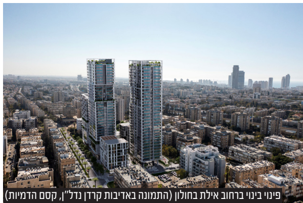
פינוי בינוי ברחוב אילת בחולון ותשתיות באמצעות חברת אל-הר הנדסה ובניין בע"מ. החברה מעורבת בקידום ופיתוח פרויקטים בערים רבות בהן: ירושלים, תל אביב, בת-ים, חולון, אזור, באר יעקב, אשדוד, גן יבנה, גני תקווה, גבעת שמואל, נתניה, חדרה, בנימינה, רמת גן, רחובות, טירת הכרמל, חיפה, נהריה, עפולה ועוד.

יזמית הפרויקט, קרדן נדל"ן, תתכנן מתחם בעירוב שימושים שיכלול מגורים לרבות דיור להשכרה מסחר, משרדים ומבני ציבור