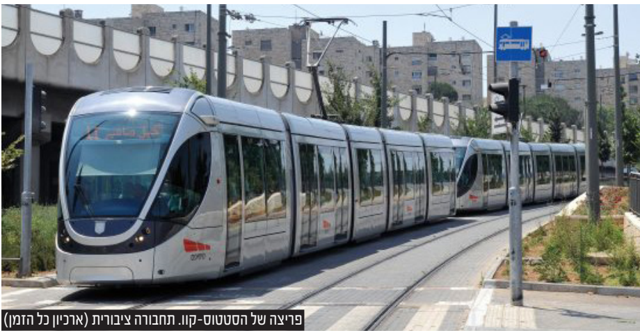
פריצה של הסטטוס-קוו. תחבורה ציבורית