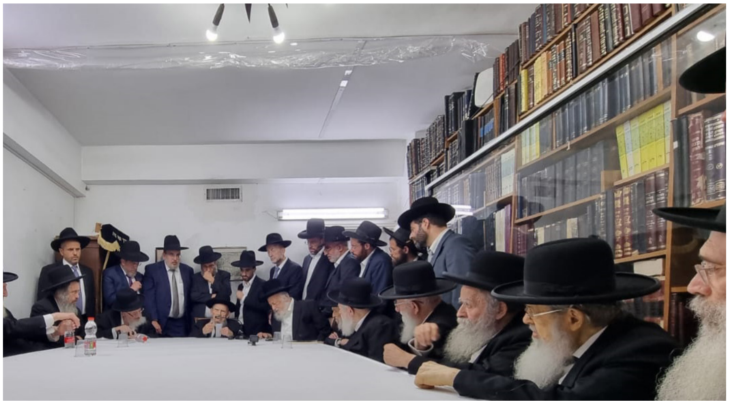
ה'מועצת' מתכנסת אצל מרן ראש הישיבה