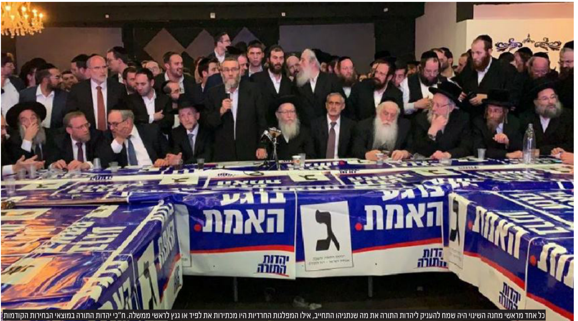
כל אחד מראשי מחנה השינוי היה שמח להעניק ליהדות התורה את מה שנתניהו התחייב, אילו המפלגות החרדיות היו מכתירות את לפיד או גנץ לראשי ממשלה. ח"כ יהדות התורה במוצאי הבחירות הקודמות

תקומה, מולדת, הימין החדש, ימינה, הבית היהודי, המפד"ל, איחוד מפלגות הימין, נעם ועוצמה יהודית. כבר כעת נשמעים קולות מתוך מפלגתו של בן גביר שמתנערים מדרכו. מיכאל בן ארי וברוך מרזל, מייסדי עוצמה יהודית, שדרכם לכנסת נחסמה ע"י בג"צ, הכריזו על הפסקת התמיכה במפלגה שהם נמנים עם מייסדיה. תהיו בטוחים שעוד נשמע על הקמתה של מפלגה חדשה שמסבירה לאזרחי ישראל מדוע ח"כ איתמר בן גביר אינו מייצג את ערכי הימין. את הצרות האלו משאיר נתניהו למוצאי הכנסת הבאה. כעת, ראשו ורובו נמצא עמוק בניסיונות להדק את קצוות המחנה. לוודא ש'נעם' חוברת ל'ציונות הדתית'. לדאוג שההסכם בין חלקי יהדות התורה יאושר ע"י כל הצדדים. עכשיו יכול נתניהו לעלות על הביבי-באס ולחרוש את הארץ לאורכה ולרוחבה.