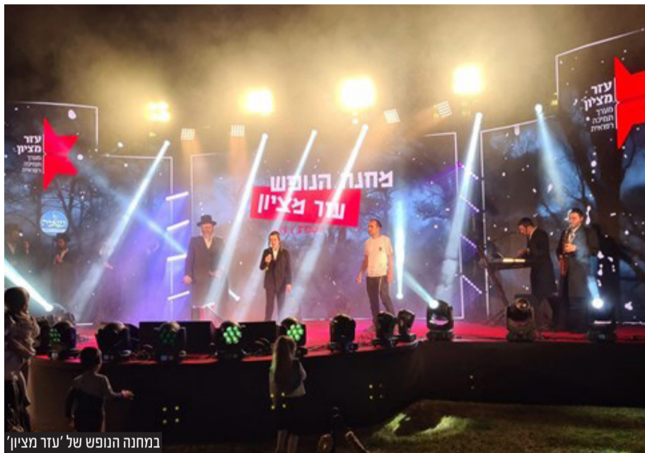
במחנה הנופש של 'עזר מציון'

להודות. בדמעות של ממש הם אמרו בצורה ברורה: קשה לנו לדמיין אותם עוברים את התקופה המורכבת הזו ללא הסיוע של עזר מציון. עזר מציון הוא נקודת האור ושיווי המשקל בזמן המחלה, וצוות הסניף ומתנדביו הם ההקלה בתוך כל הקושי, ההקלה שמאפשרת לעבור אותו עד להחלמה בס"ד."