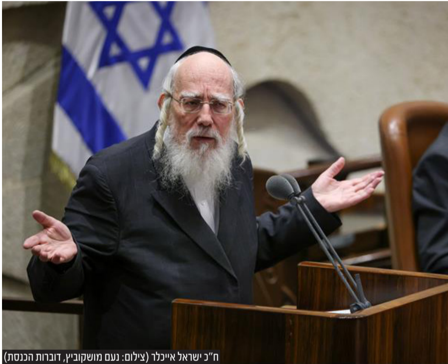
ח"כ ישראל אייכלר

ח"כ ישראל אייכלר בותמ"ל נגד ביטול העיר החרדית במערב קריית גת: "אין לנו נשק לתפוס קרקעות במרחבי הנגב, אבל יש לנו כוח הזכות לגור בארץ ישראל"