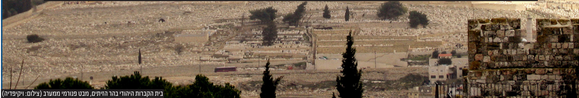
בית הקברות היהודי בהר הזיתים, מבט פנורמי ממערב