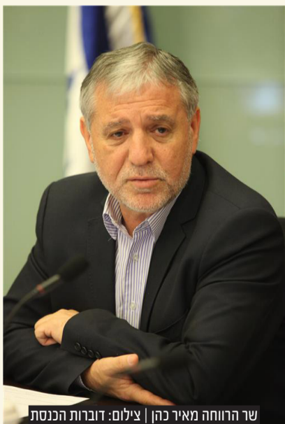
שר הרווחה מאיר כהן

שהחרדים כן ישבו איתנו בשמחה גדולה, האמן לי. הרי זה ברור עם כל הכבוד שאני רוכש לגנץ ולמחנה שלו אבל גם לחרדים ברור שזה או ביבי או יאיר". בהתייחסו לגנץ אמר כהן: "אני מקווה שגנץ לא ילך עם ביבי, גם לא לרוטציה. אנחנו היינו שם, תמכנו בגנץ והיינו עד לדקה ה-90 וקרה מה שקרה. אני מאמין שהצהרותיו הן לא הצהרות חסרות בסיס. כשהוא אומר 'אני לא אשב עם ביבי', הוא יעמוד בזה. בסופו של דבר, האלטרנטיבות הן שתיים - יאיר, יש עתיד חזקה, מדינה יהודית, דמוקרטית, שקצת מחזירה אותנו לאנחנו, ומצד שני קיצוניות, סמוטריץ', בן גביר. אני חושב שגם חלק מאנשי הליכוד מבינים שזה לא הדבר שהם חולמים עליו. יש סיכוי גדול מאוד להרכיב ממשלה חזקה. לאורך זמן גם החרדים יבואו לשבת איתנו." "זה מאבק על צבינה של המדינה, ככה אנחנו רואים את זה. אנחנו נמצאים חזק מאוד, ביום יום, אני אחראי על ההסברה של הברואים בדרום, רק שבוע שעבר הנכתי בית ספר גדול מאוד. סגלוביץ חורש את הארץ בכל מה שקשור להורדת אחוזי הפשיעה, זה דבר שלוקח זמן. אני מאוד מקווה שאחוז ההצבעה יהיה מאוד גבוה, אנחנו עובדים על זה".