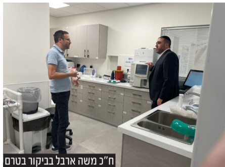
ח"כ משה ארבל בביקור בטרם

ח"כ משה ארבל הודה להנהלת 'טרם' על הסיור המחכים וציין כי כתושב העיר פתח תקווה הוא מבין היטב את החשיבות שבפעילות הסניף "אהיה לכם לעזר בכל הנדרש על מנת להמשיך ולפתח את השירות"