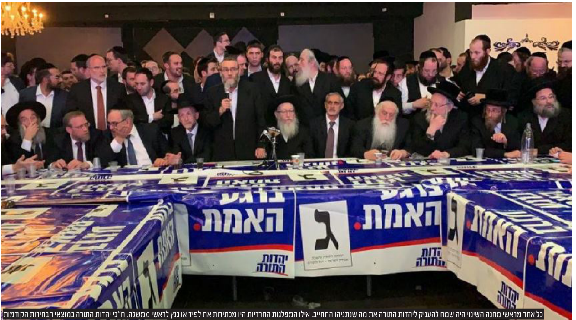
כל אחד מראשי מחנה הימני היה שמח להעניק ליהדות התורה את מה שנתניהו התחייב, אילו המפלגות החרדיות היו מכתירות את לפיד או גנץ לראשי ממשלה. ח"כ יהדות התורה במוצאי הבחירות הקודמות

תקומה, מולדת, הימין החדש, ימינה, הבית היהודי, המפד"ל, איחוד מפלגות הימין, נעם ועוצמה יהודית. כבר כעת נשמעים קולות מתוך מפלגתו של בן גביר שמתנערים מדרכו. מיכאל בן ארי וברוך מרזל, מייסדי עוצמה יהודית, שדרכם לכנסת נחסמה ע"י בג"צ, הכריזו על הפסקת התמיכה במפלגה שהם נמנים עם מייסדיה. תהיו בטוחים שעוד נשמע על הקמתה של מפלגה חדשה שמסבירה לאזרחי ישראל מדוע ח"כ איתמר בן גביר אינו מייצג את ערכי הימין. את הצרות האלו משאיר נתניהו למוצאי הכנסת הבאה. כעת, ראשו ורובו נמצא עמוק בניסיונות להדק את קצוות המחנה. לוודא ש'נעם' חוברת ל'ציונות הדתית'. לדאוג שההסכם בין חלקי יהדות התורה יאושר ע"י כל הצדדים. עכשיו יכול נתניהו לעלות על הביבי-באס ולחרוש את הארץ לאורכה ולרוחבה.