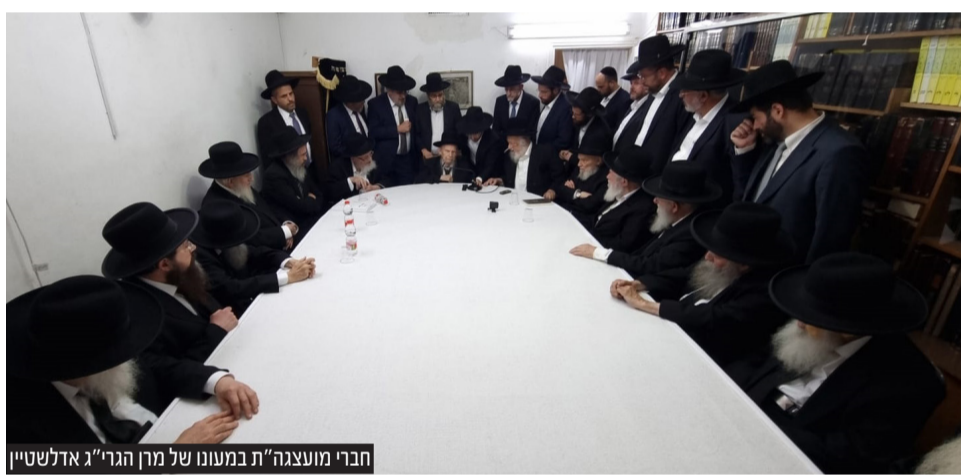
חברי מועצת ה'ת' במעונו של מרן הגרי"ג אדלשטיין

אחרי שהגיעו להסכמות בנושאים המהותיים שעמדו במחלוקת, הוחלט על ריצה משותפת לפי ההסכם הקודם. אגודת ישראל תקבל את המקום הראשון, דגל התורה את התפקיד הראשון. גפני בכינוס: "בשנים הבאות נצטרך ללמוד הכל מחדש בגלל שזה לא מייצג את המצב הקיים" | עמ' 12