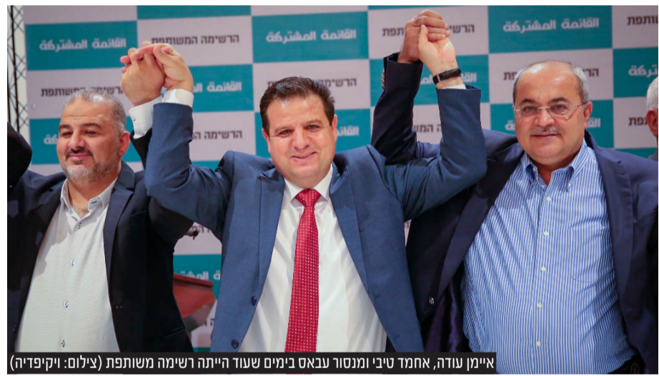
איימן עודה, אחמד טיבי ומנסור עבאס בימים שעוד הייתה רשימה משותפת

לקראת סבב הבחירות הרביעי הודיע יו"ר רע"ם מנסור עבאס על פרישתו מהרשימה המשותפת והתמודדות ברשימה עצמאית. ביום חמישי האחרון הודיעה גם בל"ד על פרישתה