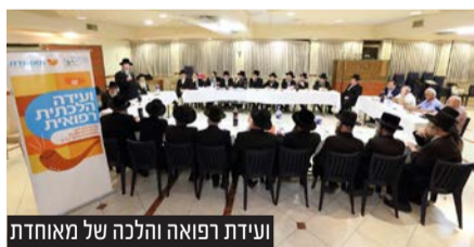
ועידת רפואה והלכה של מאוחדת