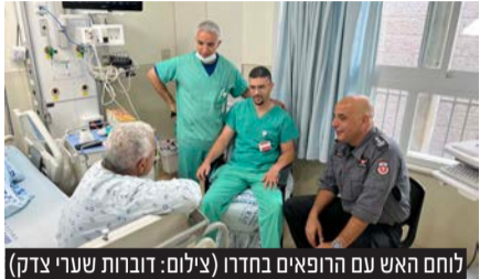
לוחם האש עם הרופאים בחדר

לאחר שנתקף באירוע לבני שכלל החיאה ו-12 שוקים חשמליים, הרופאים בביה"ח שערי צדק הצילו את חייו של לוחם האש; " מטופלים במצבו בדרך כלל לא מספיקים להגיע לבית החולים "