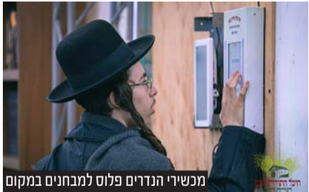
מכשירי הנדרים פלוס למבחנים במקום

בצל הקשיים להגיע לאומן בראש השנה תשפ"ג, במקום מתנהלת לה מהפכה שקטה של 'היכל התורה' הגדול שהוקם במקום, במשך יממה שלמה יושבים ושוקדים על התורה. הצצה לכל הפרטים מהמקום שקיבל את השם "המקלט שלך באומן". וגם: הכניסה והרישום באמצעות הצ'יפ כמו במקוואות