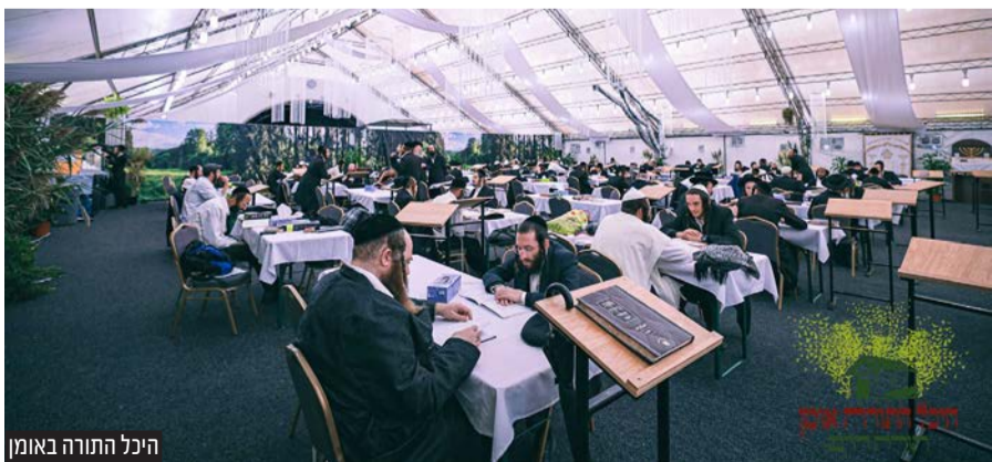
היכל התורה באומן

וזהו בדיוק הסיבה בשלה הוקם היכל התורה באומן: להעניק את השקט, כדי שכל אחד יוכל להבעיר בתוך עצמו את הבעירה האמיתית של לימוד התורה, להשקיע עצמו בעומק התורה הזמנית - לעיין בתורתו של רבי נחמן מברסלב,