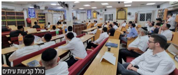
כולל קביעות עיתים

התורה שלי. שולחן השבת שלי גדוש בדברי תורה ופרשת שבוע, ואני יכול להעיד שלתקופת החגים אני מגיע כשאני מלא וגדוש בידע וההלכות. השיעורים ככולל מגוונים בכל מקצועות התורה. כל היום שלי נראה אחר אחר שעות הלימוד בבוקר".