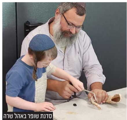
סדנת שופר באהל שרה

בלימודי הלכה, משנה וסדרי תפילה לקראת הימים הנוראים, למדו גם על כשרות השופר וסדר התקיעות. הסדנה, היוותה עבורם המחשה חיה ומרתקת של החומר שלמדו.