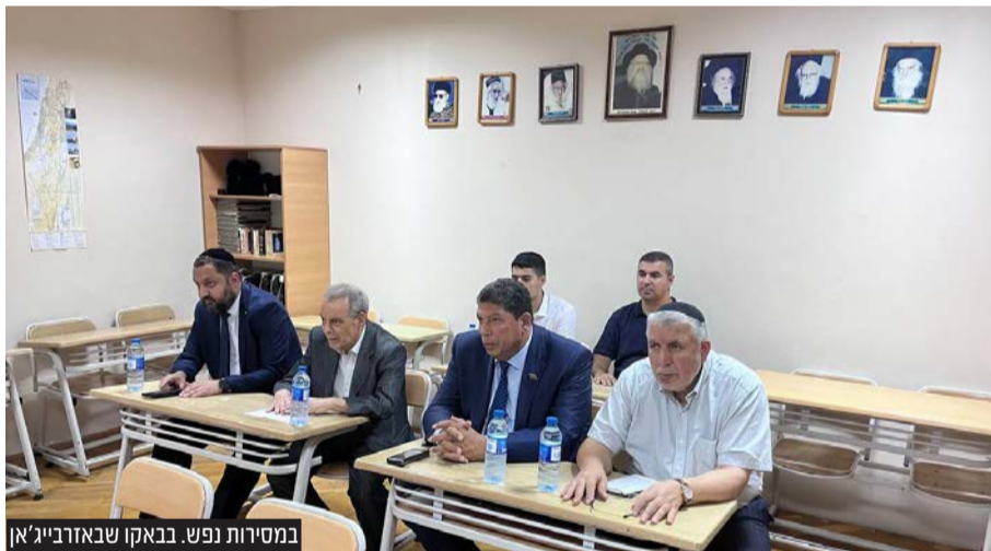
במסירות נפש. בבאקו שבאורבייג'אן

שמעידים החוקרים הוא ארמית עוד מזמן גלותנו, אך ברבות השנים והתלאות ולגו לשפה גם ביטויים ומילים משפות שונות כגון הפרסית, ואזרית, וכן מילים חדשות מרוסית, לגבי הכתב שמקובל אצלנו במסורת, הוא בוודאות כתב עברית עתיקה ודומה מאוד לכתב רש"י.