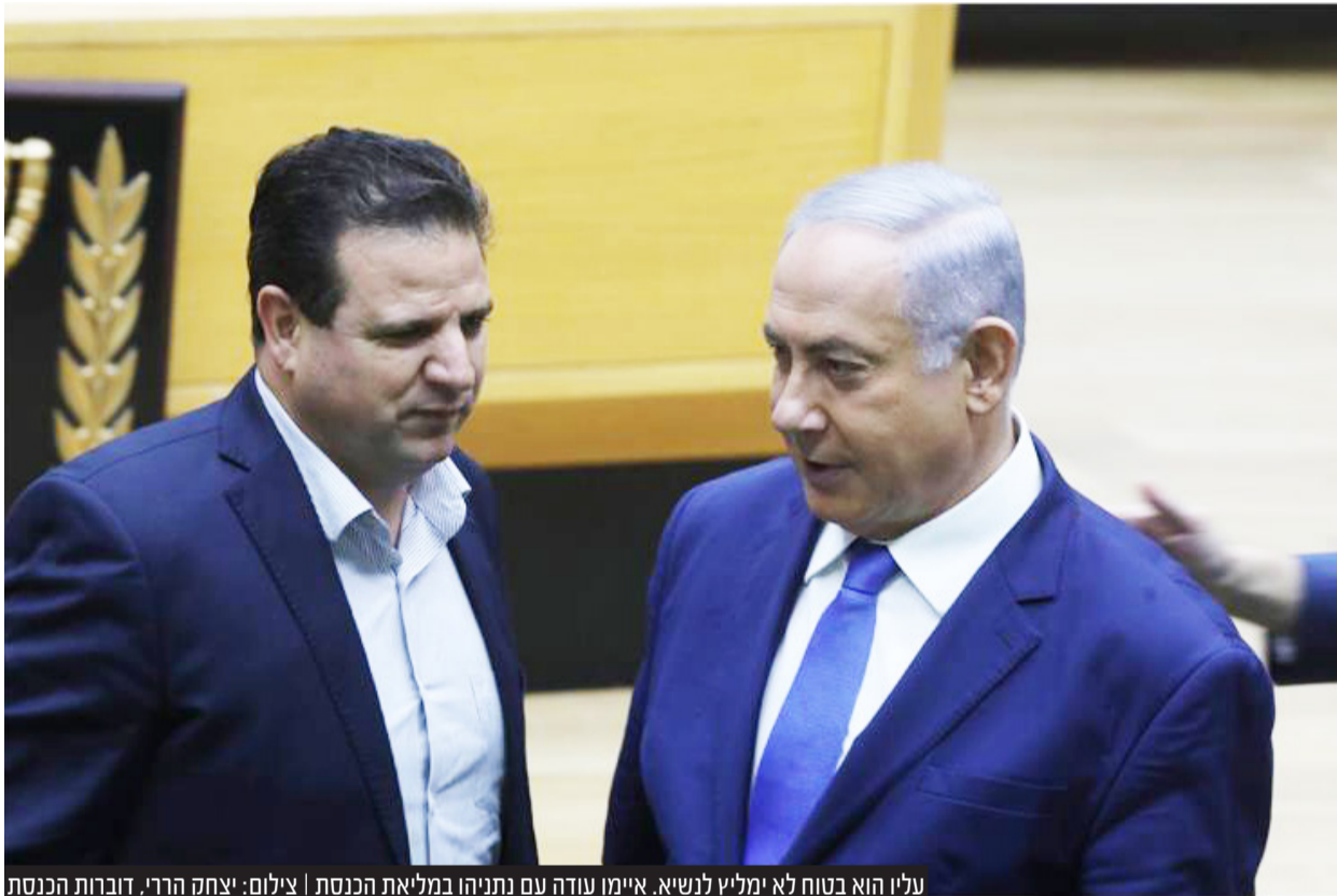
עליו הוא בטוח לא ימליץ לנשיא. איימו עודה עם נתניהו במליאת הכנסת

בשבועות שקדמו להסכם הריצה המשותפת של יהדות התורה, הביעו רבים את חששם, שהתמודדות עצמאית, עלולה לגרום לכך שלראשונה מאז קום המדינה, אף ח"כ מיהדות התורה, לא יכהן בכנסת הבאה.