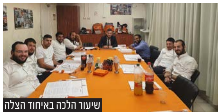
שיעור הלכה באיחוד הצלה

במסגרת היוזמה נפתח באגף הלכה של ארגון איחוד הצלה מוקד מיוחד הפועל 24 שעות המחובר בין חולים או קשישים המרותקים לביתם ואינם יכולים לצאת לבית הכנסת לבעלי תקיעה המתגוררים בקרבת מקום