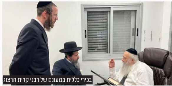
בכירי כללית במעונם של רבני קרית הרצוג

הרבנים. רבני השכונה, חיזקו מאוד את העיסוק ברפואה מונעת שמפחיתה תחלואה ומצילה חיים. בנושא זו סוכם, כי כללית תגביר את הפעילות למודעות מפני סכנות הסכרת וייערכו ימי עיון יעודיים על רפואה מונעת בתחום זה.