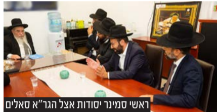
ראשי סמינר יסודות אצל הגר"א סלים

והתפתחות מקצועית מדובר על הסמינר החדשני ביותר במערכת החינוך הע"ס החרדית.