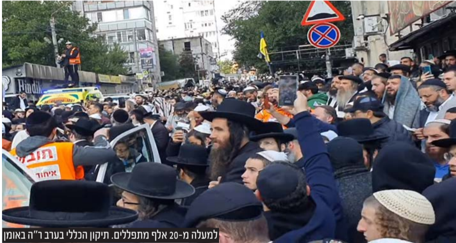
למעלה מ-20 אלף מתפללים. תיקון הכללי בערב ר"ה באומן

ע"פ הדיווח באתר אוקראיני ממקורות בצבא אוקראינה - כוחות רוסיים שיגרו מלט"ים קמיקזה איראניים שאהד-136 לעבר העיר אומן בשעה שלמעלה מ-20 אלף יהודים שהו בעיר במהלך ימי ראש השנה • רק בשבוע שעבר תקף נשיא אוקראינה וולודימיר זלנסקי את בנט ולפיד: "אני לא מבין למה הם לא יכולים לעזור לנו להתגונן אווירית. התקשרתי לשני ראשי הממשלה של ישראל וביקשתי שיספקו לנו כלים. אני מופתע שהם יכולים למכור את המערכת שלהם אבל לא נותנים לנו"