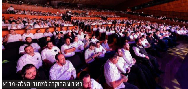
באירוע ההוקרה למתנדי הצלה-מד"א

בערב מושקע שערך מד"א כהכרת תודה לאלפי מתנדבי ארגוני ההצלה החרדיים הפועלים עמו בשיתוף פעולה השתתפו כ-3000 מתנדבים לצד ראשי מד"א • יו"ר מד"א הרב אברהם מנלה: "מד"א הוא הארגון עם מספר המתנדבים הגדול ביותר בעולם" • מנכ"ל מד"א רמ"ג אלי בין: "העוצמה האדירה המשתקפת מהנוכחים כאן, היא עוצמה שאף אחד לא יכול לה, והיא, היא זאת שמוכיחה כי האחדות והשלום תמיד מנצחים"