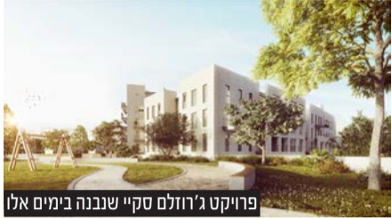
פרויקט ג'רוזלם סקאי שנבנה בימים אלו

בימים אלו החלו העבודות בשטח, כאשר הטרקטורים החלו בחפירות בתוואי הקרקע על מנת שניתן יהיה להניח את היסודות לבניית הפרויקט היוקרתי • פרויקט ג'רוזלם סקאי נבנה בסטנדרטיים המקצועיים הגבוהים ביותר הקיימים בשוק ומכיל מאות יחידות דיור בלב ליבה של ירושלים החדרית, דקות הליכה ספורות מחומות העיר העתיקה, משכונת בית ישראל וממרכז העיר