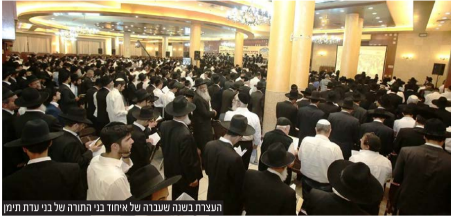
העצרת בשנה שעברה של איחוד בני התורה של בני עדת תימן

המעמד הכביר והמרומם מתקיים מידי שנה - זו השנה השמונה עשרה ע"י "איחוד בני התורה" הפועל רבות למען ציבור האברכים ובני התורה ומהווה כינוס מרכזי שנתי והתלכדות של עולם התורה מקהילות קודש בני תימן, מכל רחבי הארץ