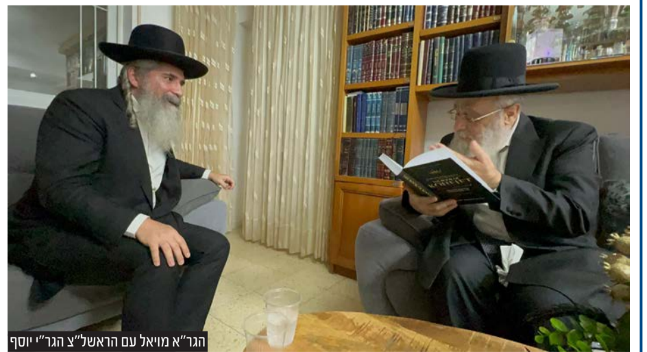
הגר"א מויאל עם הראשל"צ הגר"א יוסף

ביקור מיוחד במעונו של הראשון לציון הגאון רבי יצחק יוסף בירושלים: במהלך השבוע פקד את הבית הגאון רבי אברהם מויאל, ראב"ד הקהילות היהודיות במרכז אפריקה ומחשובי רבני הקהילות הספרדיות בברוקלין. הראב"ד התקבל בכבוד ובמאור פנים על ידי הראשון לציון שאמר לו: זכית להפוך לאבוקת אור גדול בשמי יהדות אפריקה. בישיבה העלה הגר"א מויאל שורה של סוגיות הלכתיות שמעסיקות את הקהילות היהודיות במרכז אפריקה בהמשך לשאלות שהופנו במרוצת השנה האחרונה והראשל"צ הכריע במקום והעלה על נס את עבודת בית הדין החדש באפריקה ביחד עם הרב הראשי של איגוד הקהילות הגאון רבי שלמה בן טולילה.