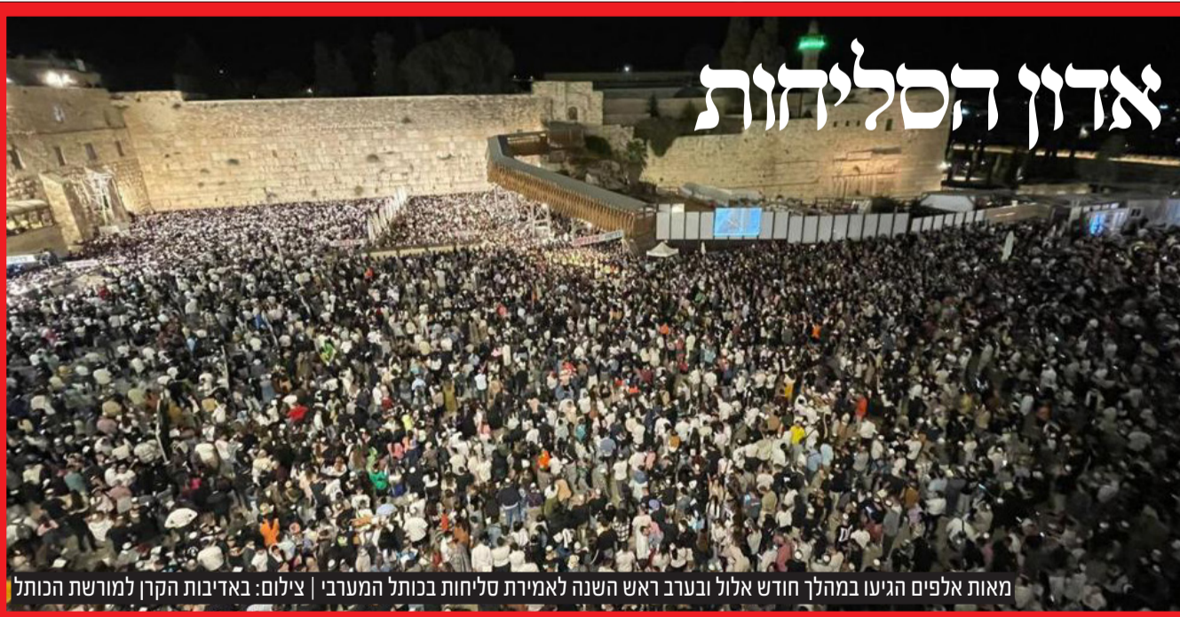
מאות אלפים הגיעו במהלך חודש אלו ובערב ראש השנה לאמירת סליחות בכותל המערבי