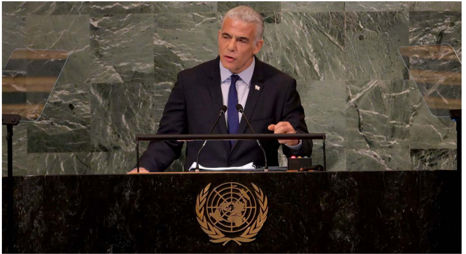
נאום 'שתי המדינות', לפיד באו"ם

שקולם ירד לטמיון. לפיכך, אם בסקרים האחרונים לפני הבחירות היא תצליח לחצות את אחוז החסימה, היא עשויה לעשות זאת גם במציאות, אבל אם היא תמשיך במגמה הנוכחית, סביר להניח שנפגוש אותה בשני לנובמבר בלשכת התעסוקה.