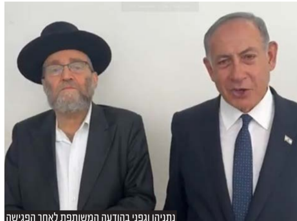
נתניהו וגפני בהודעה המשותפת לאחר הפגישה על בנו אבנר עמו הוא לומד מידי שבוע את פרשת השבוע וציין: "אצלנו זה לא בשביל לקושש קולות בבחירות, זה מושרש". בדגל התורה אמרו לאחר הפגישה כי הפגישה בבית מרן ראש

הישיבה נועדה להעביר מסר ל'מחנה הממלכתי' לפיו יהדות התורה מצאת בבלוק הימין והברית עם נתניהו תימשך גם לאחר הבחירות וכי אין כל כוונה להיכנס לממשלה שהליכוד אינו חלק ממנה. בתום הפגישה בחדרו של מרן ראש הישיבה פירסמו נתניהו וגפני הודעה משותפת. נתניהו סיפר: "יצאנו עכשיו מגדול הדור הרב אדלשטיין שהעניק לנו מחוכמתו, בכל ליבו מאהבת ישראל שבו ומאהבת התורה שבו. הוא איחל לנו שנה טובה ואנחנו איחלנו גם לו והרבה בריאות ואני מאחל הרבה בריאות ושנה מתוקה לכל עם ישראל". ח"כ גפני אמר: "ראש הישיבה קיבל את מר נתניהו בחום ומאוד כיבד אותו והעלה את הדברים החשובים של החינוך והתורה שזה עומד במרכז חייו של העם היהודי שבזכות התורה ובזכות החינוך הזה אנחנו עם הגלות של אלפיים שנה הגענו לכאן וממשיכים להיות עם אחד של ביישנים, רחמנים וגומלי חסדים שאכפת לנו ממה שקורה בעם היהודי בכלל בכל העולם. הוא בירך ואיחל למר נתניהו שנה טובה ואנחנו מקווים שלכולם יהיה שנה טובה, כל אחד באופן אישי וגם לעם ישראל, שתהיה פה ממשלה של שנה טובה".