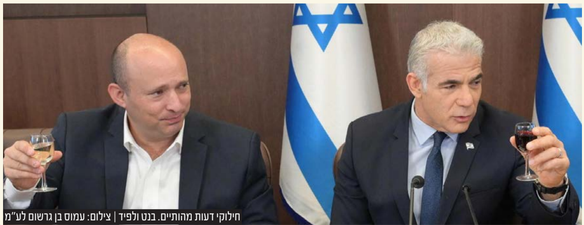
חילוקי דעות מהותיים. בנט ולפיד | צילום: עמוס בן גרשום לע"מ

לאחר פרישת אולמרט, סירבה להכיר בניצחוננו של מופז בפריימריז על ראשות המפלגה. ב-2012 פרשה מקדימה ולקראת בחירות 2013 הקימה את מפלגת 'התנועה' שקיבלה שישה מנדטים בלבד. בבחירות 2015 חברה ליו"ר העבודה יצחק הרצוג ויחד הקימו את 'המחנה הציוני'. בינואר 2019 כשלושה חודשים לפני הבחירות, הדהים היו"ר החדש של מפלגת העבודה אבי גבאי, כשבמהלך ישיבת סיעה הודיע על פירוק המחנה הציוני מבלי לעדכן אותה מראש. לבני ישבה המומה, הסתגרה לאחמ"כ בחדרה ובהמשך הודיעה על פרישה מהחיים הפוליטיים. בליכוד חגגו על חשבונה של מי שהחלה את דרכה בליכוד וסיימה במפלגת העבודה. על האירוע הזה טבע נתניהו את הביטוי: "אני לא מתערב באיך השמאל מחלק את הקולות שלו".