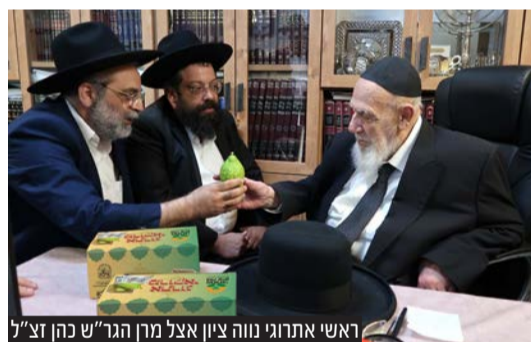
ראשי אתרוגי נווה ציון אצל מרן הגר"ש כהן זצ"ל

לאתרוגים המשווקים על ידי אתרוגי נוה ציון, בהשגחה צמודה של בד"ץ נווה ציון מיסודו של מרן ראש הישיבה חכם שלום כהן זצוק"ל, כבר יצא שם כאתרוגים תימניים מיוחדים ביותר ובעלי מסורת ברורה שאינם מורכבים, בעלי צורת גידול נאה ונקיות נדירה ויצאת מן הכלל, עד אשר בלא ספק זה הוא הדר שאמרה תורה.