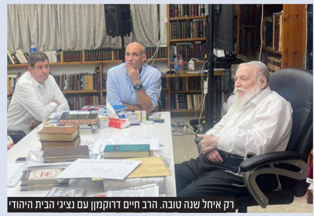
רק איחל שנה טובה. הרב חיים דרוקמן עם נציגי הבית היהודי

בכנס שהתקיים ביום חמישי לפעלי הציונות הדתית, אמר יו"ר המפלגה ח"כ בצלאל סמוטריץ' שמתקיימים מגעים עם אנשי שקד לפרישתה מהתמודדות עצמאית בבחירות תמורת תפקיד שישאיר אותה בעשייה עבור המחנה הלאומי. "אסור לנו לזרוק קולות לפת. אני לא רוצה להרחיב בזה אבל כולנו בהסברה צריכים לומר את זה לציבור. יש סכנה של אחוז החסימה ואנחנו מטפלים בזה". "יש מגעים שאני מנהל בתוך המחנה הלאומי ועם אנשים בסביבת איילת שהיא תמצא את הדרך להיות שותפה בדרך כזאת או אחרת. חושב שזה נכון שתמשיך לייצג את קולה. יש דרך שהיא תמשיך להיות חלק מהעשייה ומהתרומה לישראל במחנה הלאומי בלי שהיא לוקחת סיכונים גדולים ומסכנת את מדינת ישראל ואת המחנה הלאומי. אני מאוד מקווה שהשכל הישר יגבר. יש לי סיבות להיות אופטימי". בעקבות הדיווח בחדשות 12 שהביא את דבריו של סמוטריץ', נמסר מלשכתה של השרה שקד: "בהמשך לפרסומים השקריים מבית היוצר של בצלאל סמוטריץ', שהם המשך ישיר לשרשרת השקרים עליהם הוא יצטרך לצום בכמה ימי כיפור, נבהיר כי מדובר בשקר מוחלט מצוץ מהאצבע. אנחנו מבינים שיש מפלגות שבונות על הקולות של הבית היהודי, אך צר לנו לאכזב, הבית היהודי תרוץ עד הסוף. הדבר הכי ברור מכל הסקרים הוא שבלי הבית היהודי לא תהיה ממשלת ימין ותקום ממשלה עם הערבים.