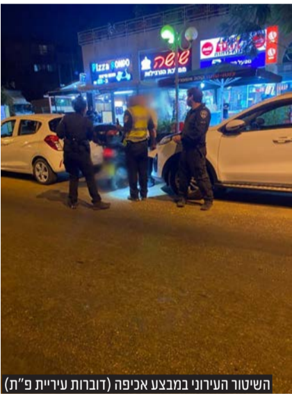
השיטור העירוני במבצע אכיפה