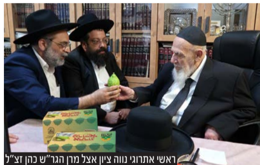
ראשי אתרוגי נווה ציון אצל מרן הגר"ש כהן זצ"ל

לאתרוגים המשווקים על ידי אתרוגי נוה ציון, בהשגחה צמודה של בד"ץ נווה ציון מיסודו של מרן ראש הישיבה חכם שלום כהן זצוק"ל, כבר יצא שם כאתרוגים תימניים מיוחדים ביותר ובעלי מסורת ברורה שאינם מורכבים, בעלי צורת גידול נאה ונקיות נדירה ויצאת מן הכלל, עד אשר בלא ספק זה הוא הדר שאמרה תורה.