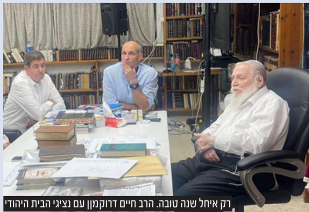
רק איחל שנה טובה. הרב חיים דרוקמן עם נציגי הבית היהודי

בעקבות הדיווח בחדשות 12 שהביא את דבריו של סמוטריץ', נמסר מלשכתה של השרה שקד: "בהמשך לפרסומים השקריים מבית היוצר של בצלאל סמוטריץ', שהם המשך ישיר לשרשרת השקרים עליהם הוא יצטרך לצום בכמה ימי כיפור, נבהיר כי מדובר בשקר מוחלט מצוץ מהאצבע. אנחנו מבינים שיש מפלגות שבונות על הקולות של הבית היהודי, אך צר לנו לאכזב, הבית היהודי תרוץ עד הסוף. הדבר הכי ברור מכל הסקרים הוא שבלי הבית היהודי לא תהיה ממשלת ימין ותקום ממשלה עם הערבים.