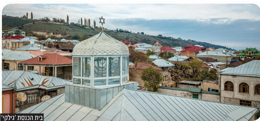
בית הכנסת 'גיליק'

קודם לכן שכנה העיירה על ההר הסמוך ושמה היה 'קוסרי'. רק לאחר מכן, כאשר הפרעות פסקו והיהודים הרגישו בטוחים יותר, הם עברו לעיירה למטה הנמצאת שם עד היום.