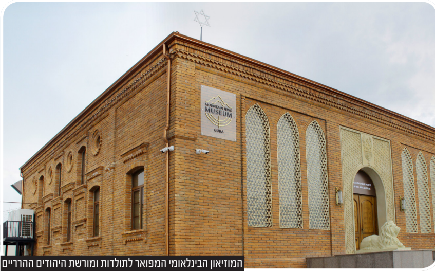
המוזיאון הבינלאומי המפואר לתולדות ומורשת היהודים ההרריים

עד לפני העלייה מברית המועצות בשנות ה-70 היהודים הרריים התיישבו לרוב ברפובליקת אורבייג'ן ובצפון קווקז - בדגסטן, בצ'צ'ניה, בקברדינו-בלקריה ובחבל סטברופול. כיום חלק הארי של קהילת היהודים ההרריים עלו לישראל. הקהילה הגדולה ביותר בתפוצות הוקמה בארצות הברית. במקום השני בכמות היהודים ההרריים היא הקהילה ברוסיה. כמו כן מתיישבים היהודים ההרריים גם באורבייג'ן, בגרמניה, בקנדה ובאוסטרליה.