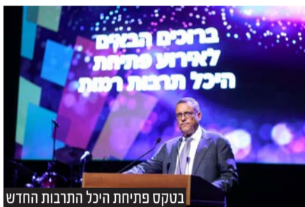
בטקס פתיחת היכל התרבות החדש