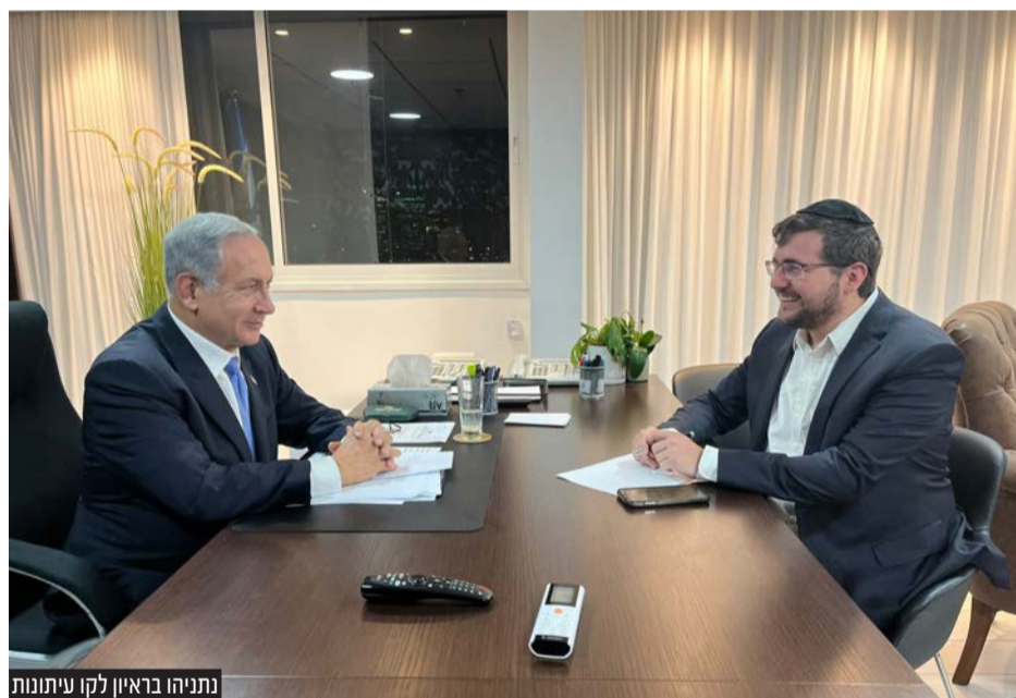
נתניהו בדאיון לקו עיתונות