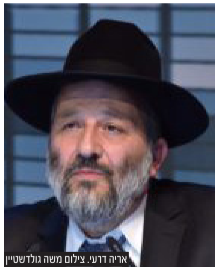
אריה דרעי.