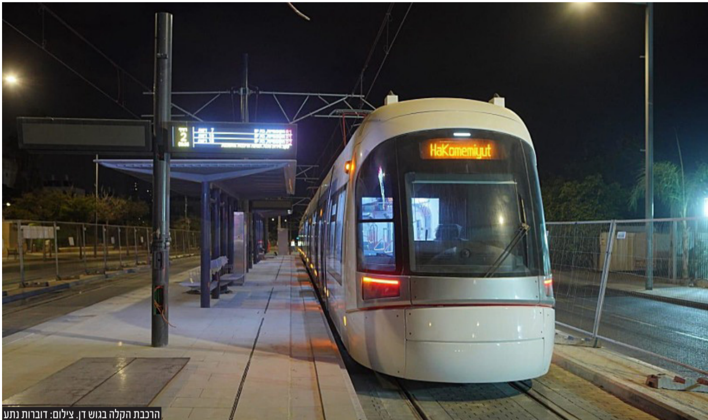
הרכבת הקלה בגוש דן.

יו"ר סיעת יהדות התורה ח"כ מאיר פרוש אמר בתגובה כי "שרת התחבורה של מדינת תל אביב, שדרדרה את מצב התחב"צ בישראל לשפל חדש, מבטיחה כי אם תישאר בתפקיד תתמקד בדבר היחיד שהיא טובה בו - להרוס. ההיסטוריה מוכיחה שמי שמתעסק עם השבת נכשל. בעז"ה בו' בחשוון גם מיכאלי תהפוך להיסטוריה.