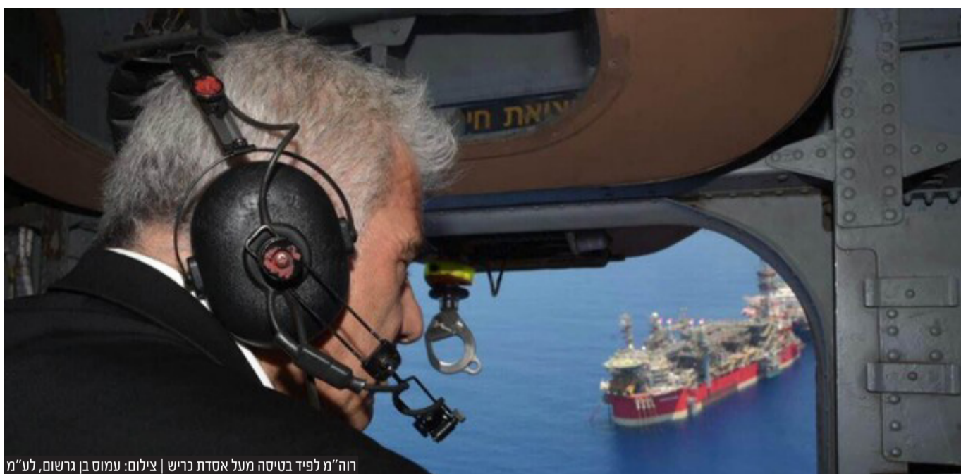
רה"מ לפיד בטיסה מעל אסדת כריש

מי שבחר לתקוף את יו"ר האופוזיציה ח"כ בנימין נתניהו הוא השר לביטחון פנים עומר בר לב. השר בר לב השווה בין נתניהו