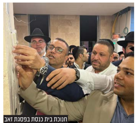
חונכת בית כנסת בפסגת זאב