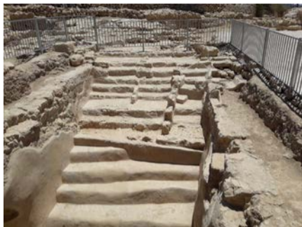
מאת: אריה שוורץ

לקומה העליונה של מערת המכפלה; בית הארחה חברון עובר שיפוץ מקיף בימים אלו בצפייה שיושלם לקראת שבת חיי שרה, והבולט ביותר בשטח, בשלב זה - מבנה בסיס צבאי חדיש ומפואר שהחליף את "פלוגת המתקנים" המוכרת לרבים, וכעת נושא את השם "רובע חזקיהו". מבנה זה הוא הראשון בשכונה שאמורה להיבנות ליד "בית רומנו" (שבו נמצאת כיום "ישיבת שבי חברון"), המבנה בו התגורר ולימד הגאון רבי חזקיהו מדיני, מחבר סדרת הספרים הנודעת "שדי חמד". במקום זה החלה בניית "רובע חזקיהו" - שכונת מגורים יהודית העתידה לכלול כ-30 דירות ומבני ציבור. את כל המראות האלו ועוד רבים יוכלו לחוות המבקרים בחברון בחג הסוכות. ובנוסף, כמובן, הישוב היהודי בחברון אינו מפסיק לשמח את עם ישראל במצוות השמחה בחג ומעלה מבחר הופעות ללא תשלום שיתקיימו ביום רביעי ב' דחומ"ס, כאשר על הבמה יופיעו מיטב זמרי הזמר החסידי ובהם - ליפא שמלצר, חיים ישראל, ישי לפידות, קובי ברומר, ביני לנדאו, ועוד. לכבוד החג כבר הוקמו סוכות ענק לקליטת קהל המבקרים, ומוזיאון "לגעת בנצח" מציע מבחר תכניות מיוחדים יוצעו מוזלים למשפחות, וסיורים מיוחדים יוצעו לקהל הרחב. בכניסה למערת המכפלה מוצג סרט הסברה חדש קצר ומרהיב המספר את תולדות האתר היהודי הראשון בעולם. רכבים מיוחדים יעלו את הקהל לתל חברון ובאתרי תל חברון יתקיימו הפעלות ילדים ויוצגו הצגות מיוחדות שימחישו את החיים בחברון הקדומה, ועוד ועוד. לרשות הקהל יעמדו סדרי הסעות מיוחדים כולל "שאתלים" מוגברים שיאפשרו הגעה ופיזור נוח. לסיכום - בחברון יש הכל: גם הנאה, גם קדושה, גם טיולים וחוויות, גם רוחניות וגם גשמיות. להתראות וחג שמח! פרטים נוספים: 02-9965333.