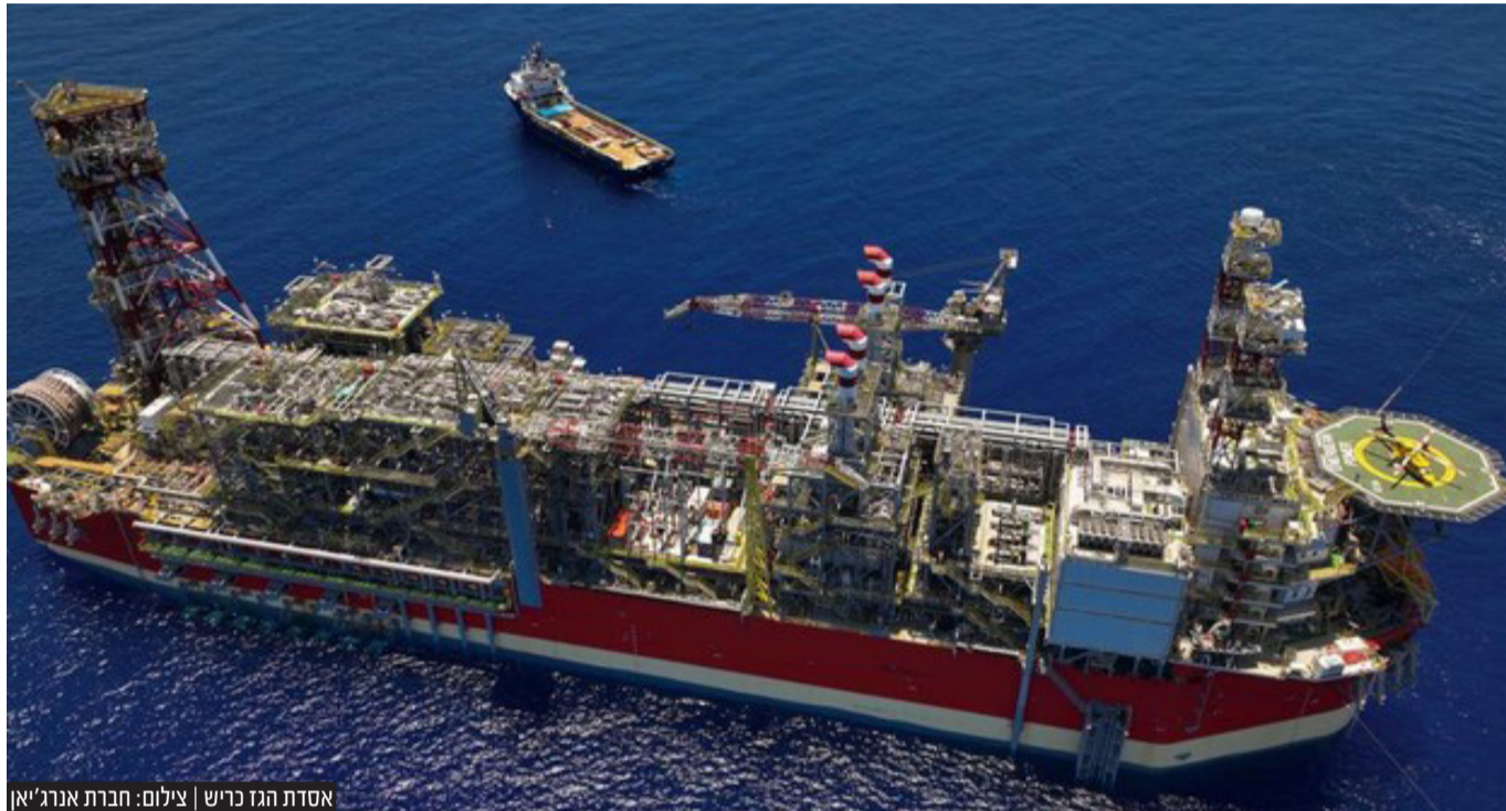
אסדת הגז כריש

חתימת הסכם הגז הימי בין ישראל ללבנון ממשיכה לעורר סערה פוליטית. בישיבת הממשלה התייחס ראש הממשלה יאיר לפיד להסכם ואמר כי ההסכם מחזק את הביטחון הישראלי. "במהלך סוף השבוע התקבלה בלבנון ובשאר העצת המתווך האמריקאי להסכם על הגבול הימי בין שתי המדינות. אנחנו מנהלים דיונים על הפרטים האחרונים, כך שאי אפשר עדיין לברך על המוגמר, אבל כפי שדרשנו מהיום הראשון ההצעה שומרת על מלוא האינטרסים הביטחוניים מדיניים של ישראל, וגם על האינטרסים הכלכליים שלנו".