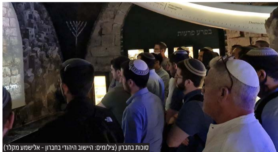
סוכות בחברון

ותיקי חברון אומרים כי בחברון אין רגע דל. ואמנם בעיר העברית הראשונה (בערך 4000 שנה לפני שהוקמה תל אביב...) ישנן התרחשויות היסטוריות בלתי פוסקות מאז הגיע אליה אברהם אבינו והתחיל בה את ההתיישבות העברית בארץ ישראל. בחברון התרחשו הקניין העברי הראשון בארץ, קבורת האבות והאימהות, תפילת כלב בן יפונה במערת המכפלה, כיבושי יהושע בן נון וכלב בן יפונה, המלכת דוד למלך יהודה ולאחר מכן למלך ישראל, הקמת העיר היהודית בימי בית השני, בניין המבנה הענק מעל מערת המכפלה, צמיחת הקהילה היהודית בימי הביניים, פריחת הישוב הישן בעיר העתיקה, ועוד ועוד. כמובן שלרשימה המרשימה הזאת יש להוסיף את אירועי המאה האחרונה - עקירת הישוב לאחר פרעות תרפ"ט, הכיבוש הירדני בתש"ח ושחרור חברון בתשכ"ז, תנועת ההתנחלות והשיבה לחברון והקמת קרית ארבע והיישוב היהודי בחברון מחדש בדורנו. בשנים האחרונות נוספו חידושים לספר ההיסטוריה הענק של תולדות חברון: בתל חברון ההיסטורי התגלו ממצאים ארכיאולוגיים ייחודיים ומרהיבים כמו מקוואות הטהרה הגדולים בארץ, והישוב היהודי בחברון הנהיג מסורת של אירועי זמר חסידי המוניים בחגים שמושכים קהל אלפים ורבבות מידי חג ומועד. בנוסף לכל אלו החלו השנה שינויים משמעותיים גם בשטח, הנראים לכל מבקר. ליד מערת המכפלה נפתח שטח חפירה ארכיאולוגית, בה התגלה רובע מגורים מימי הביניים ואפילו חלקי מבנים מימי בית המקדש השני - כולל חלקי אבנים שנועדו לבניית מערת המכפלה. צמוד למבנה מערת המכפלה הותקן מגדל מתכת הנראה כמו פיגום ברזל, שעתידי לכלול בעתיד מעלית