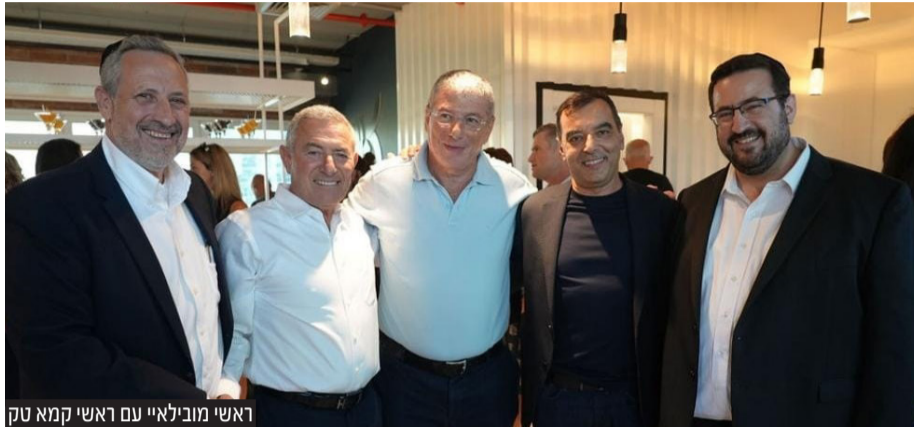
ראשי מובילאיי עם ראשי קמא טק

דברים לאחמ"כ: "הפעילות של קמא-טק משפיעה לטובה על אלפי נשים חרדיות ומשפחותיהם, שעל ידי כך מקימות בתים של תורה עם פרנסה מכובדת. אנחנו מרגישים זכות מיוחדת בכך שגדולי ישראל מורים את דרכנו בכל צעד ושעל, ומוודים לראשי הסמינרים ולמנהלות הסמינרים שמלווים אותנו בשותפות יומיומית, ולראשי חברות ההייטק על התמיכה והשותפות הנפלאה, ומוודים להשם שאנחנו זוכים לעסוק בשליחות החשובה הזאת עבור הציבור החרדי ועבור כלל ישראל".