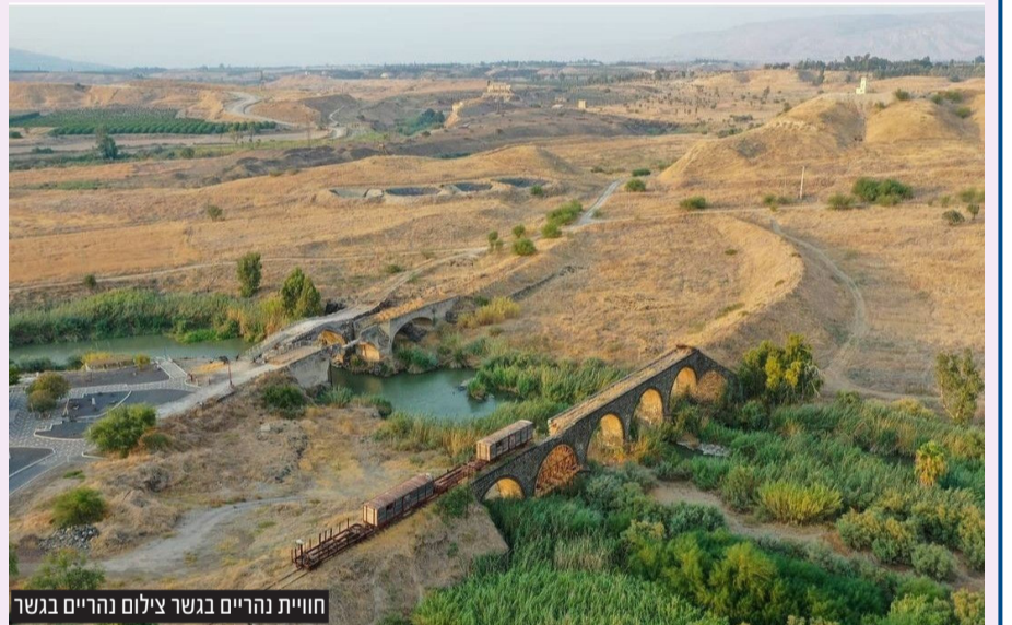
חויית נהריים בגשר

באתר 'נהריים בגשר' שלל פעילויות סוכות מיוחדות לכל המשפחה ביניהן משחק משימות לכל המשפחה 'חפש ת'סליק' בשילוב כתבי חידה; סרט על סיפורם המיוחד של החלוצים שהתיישבו במקום, לחמו בעוז, נאחזו בקרקע ובנו את ביתם; מיצג ענק ומרהיב עם אורות, צלילים, מים וסכרים, המספר את סיפורו של "הסטארט-אפ" הישראלי הראשון - בדגם תחנת הכוח ההידרואלקטרית שהקים המהנדס פנחס רוטנברג הידוע בשם 'הזקן מנהריים'; סיורים מודרכים מעבר לגדר המערכת ותצפיות מרהיבות.