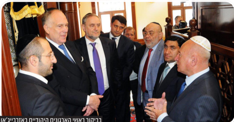
בביקור ראשי הארגונים היהודיים באזרבייג'אן