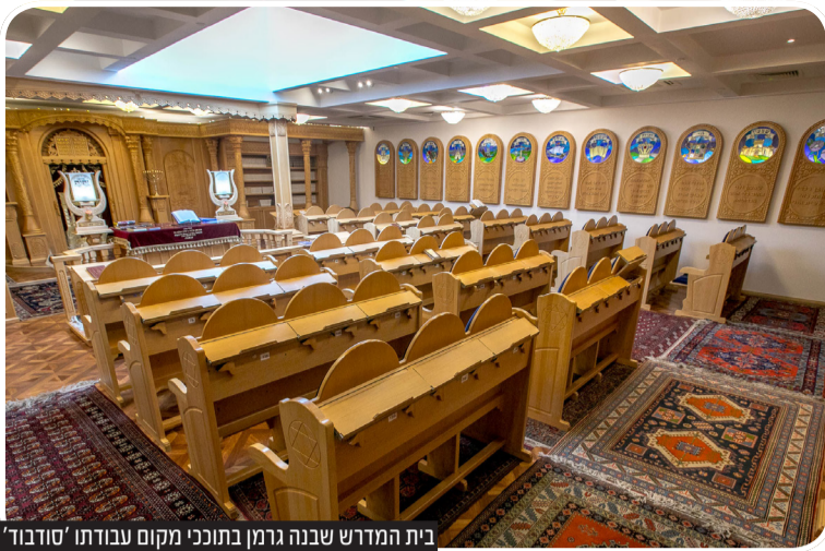
בית המדרש שבנה גרמן בתוככי מקום עבודתו 'סודבד'