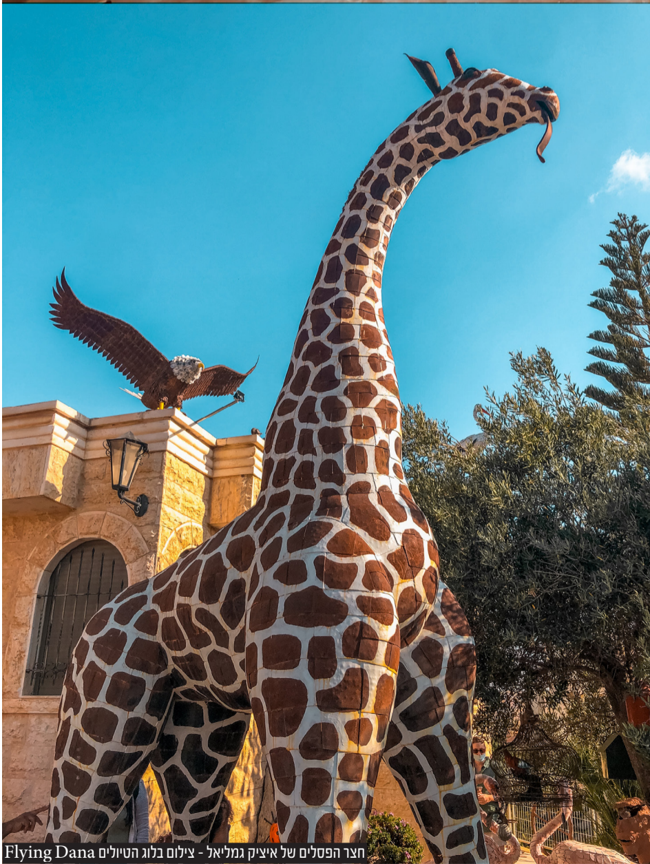
חצר הפסלים של איציק גמליאל