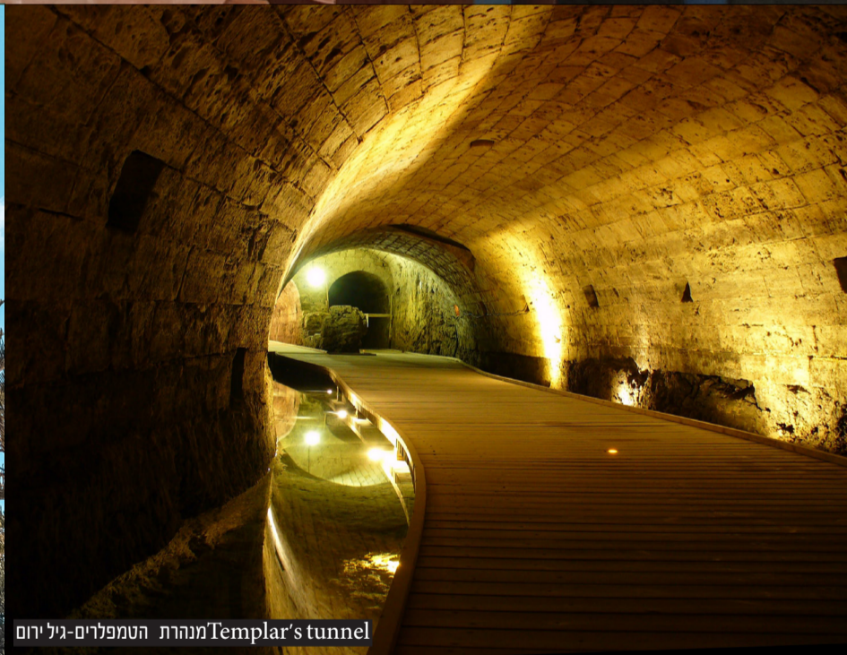
Templar's tunnel מנהרת הטמפלרים-גיל ירום