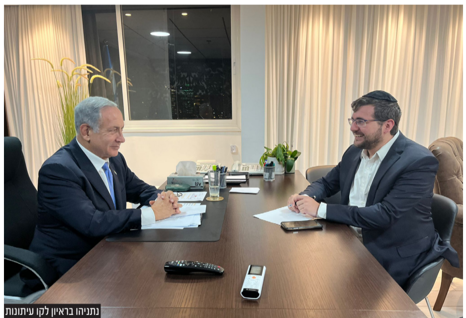
נתניהו בדאיון לקו עיתונות