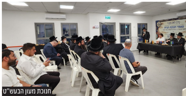
חנוכת מעון הבעש"ט