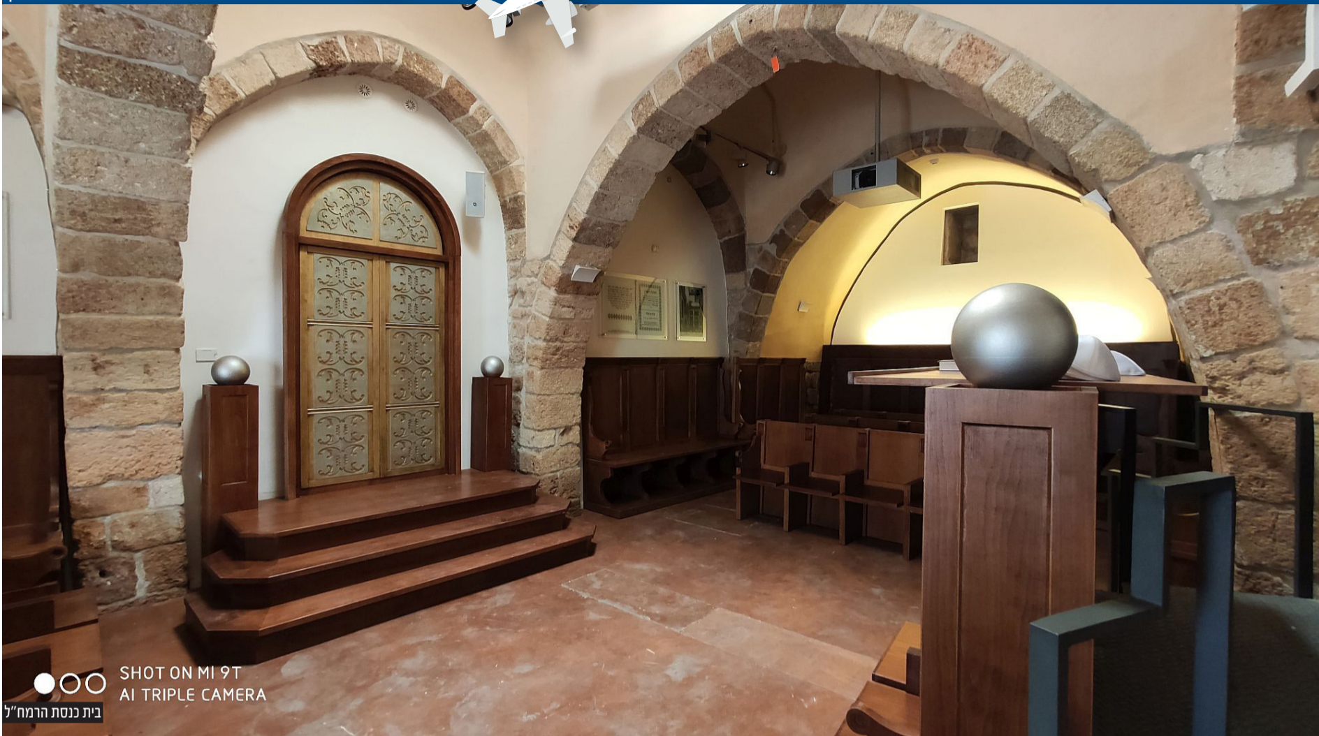
SHOT ON MI 9T AI TRIPLE CAMERA בית כנסת הרמח"ל