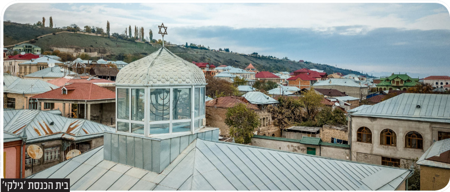
בית הכנסת 'גילקי'