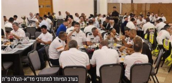
בערב המיוחד למתנדבי מד"א-הצלה פ"ת