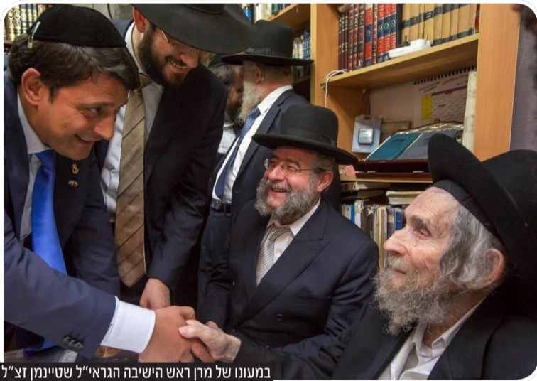
במעונו של מרן ראש הישיבה הגראי"ל שטיינמן צ"ל