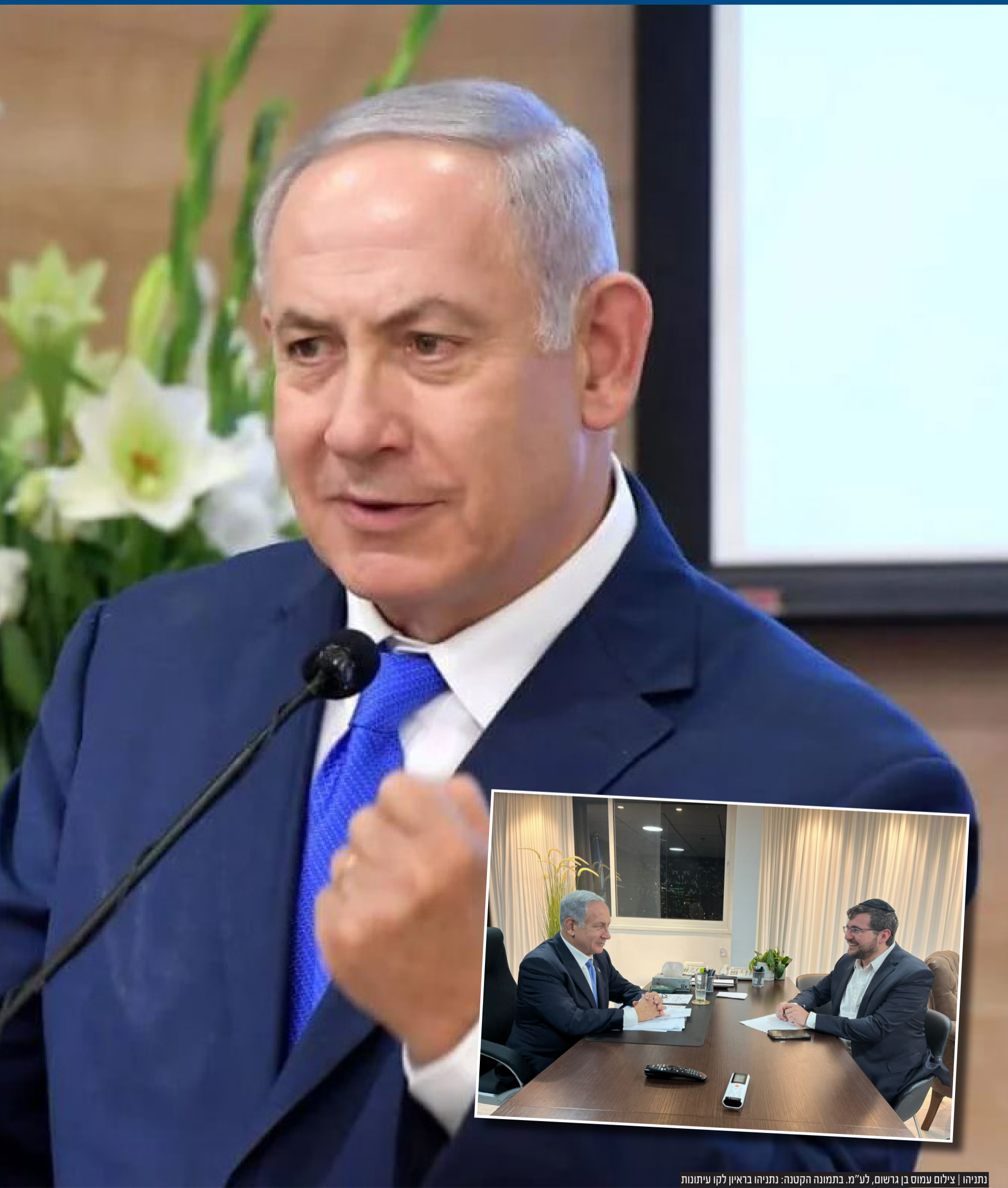
נתניהו בתמונה הקטנה: נתניהו בראיון לקו עיתונות