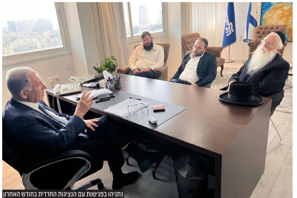
נתניהו בפגישות עם הנציגות החרדית בחודש האחרון