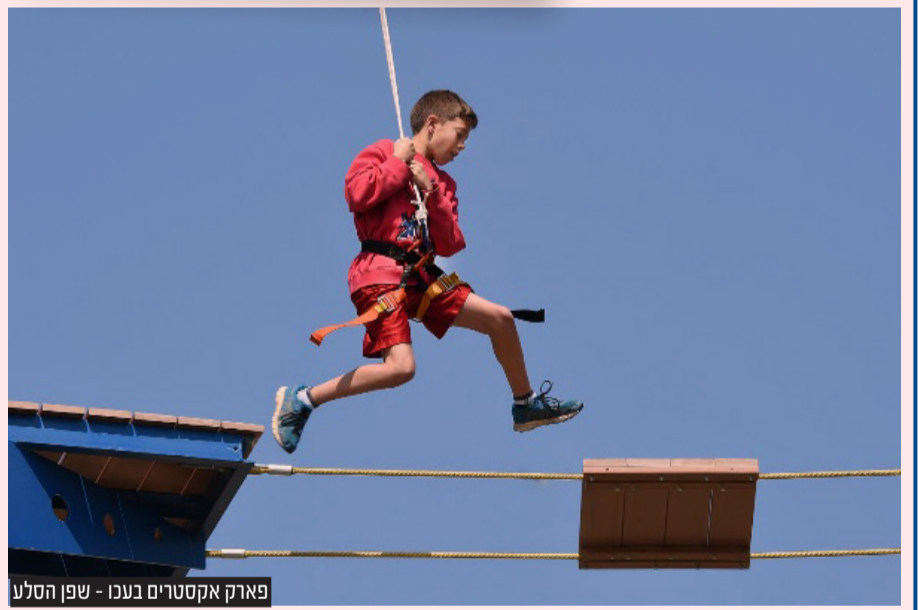
פארק אקסטרים בעכו - שפן הסלע

פארק האקסטרים בעכו הוא הגדול והמקצועי ביותר בישראל, ובו קיר הטיפוס הגדול ביותר במזרח התיכון בגובה 32 מטרים, אומגה ענקית באורך 90 מטרים, מסלולי SKY TRACK ומעל 2000 מטרים של קירות טיפוס, עם כ-8,000 אחיזות טיפוס אשר עוצבו בצרפת במיוחד עבור הפארק. בפארק מגוון מתקנים, המותאמים לכל רמת קושי ולכל גיל. לטובת הקטנטנים וההורים, הכשירו מתחם שעשועים, מרחבים ירוקים עם פינות ישיבה ובית קפה.