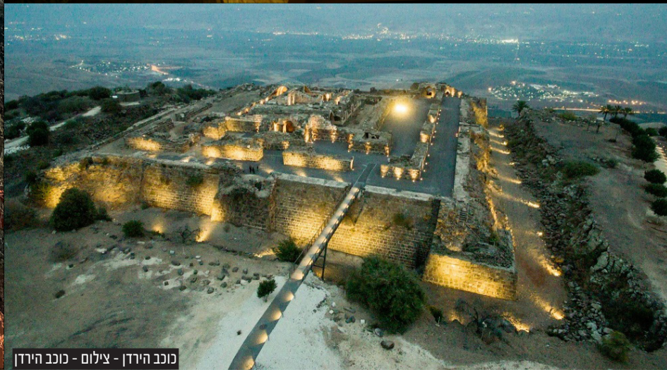
כוכב הירדן - צילום - כוכב הירדן