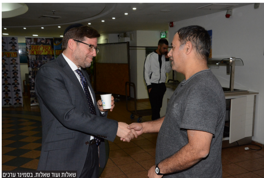
שאלות ועוד שאלות. בסמינר ערכים