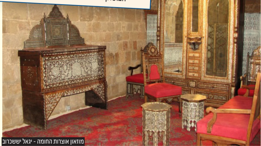
מוזיאון אצרות החומה - יגאל יששכרוב

להזמנת כרטיסים ופרטים נוספים http://www.go-akko.com ילד עד גיל 5 חינם, 30 ש"ח לכרטיס משולב, המאפשר כניסה לכל האתרים: אולמות האבירים, חמאם טורקי, גן הקסום, גן הבוסתן ועוד.