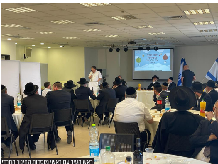
ראש העיר עם ראשי מוסדות החינוך החרדי

הילדים היקרים הם דור העתיד שלנו. "כל חברה מתמודדת עם המון אתגרים פנימיים וחינוכיים. והדרך להתמודד עם זה כדי להשפיע על מה שיקרה בסוף, זה כשנותנים לדור העתיד, שאמור לשאת את הלפיד, את הכלים הנכונים והראויים. ולכן החינוך של דור העתיד לדברים החשובים והערכיים באמת זה העיקר.