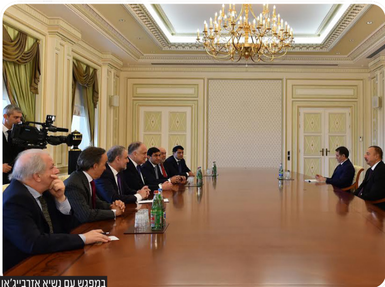
במפגש עם נשיא אזרבייג'אן

שורב החברים בה הם גמלאים בעלי הכנסות נמוכות. בקרסניה סלובודה יש כבישים סלולים ורשת חשמל המוגנת מפני סערות. זה מהווה ניגוד מדהים בקובה השכנה, עיירה ענייה בעלת רוב מוסלמי שנמצאת מול קרסניה סלובודה בגדה האחרת של הנהר גודיאלצ'אי.