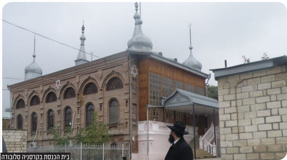
בית הכנסת בקרסניה סלובודה