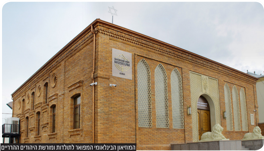
המוזיאון הבינלאומי המפואר לתולדות ומורשת היהודים ההרריים

אלפים מתושבי העיירה העתיקה היגרו למוסקבה, ישראל, גרמניה וארה"ב. קשה