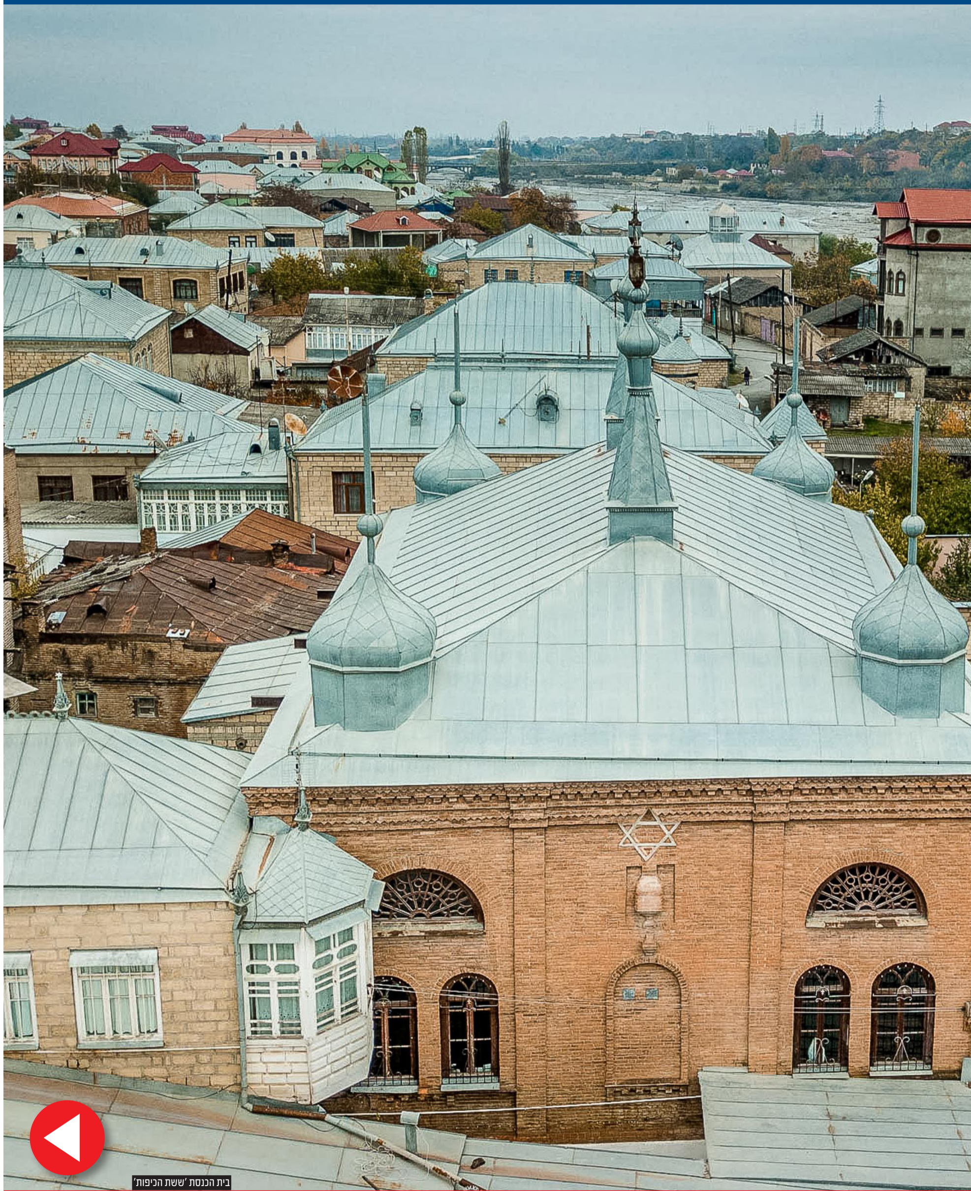
בית הכנסת 'ששת הכיפות'