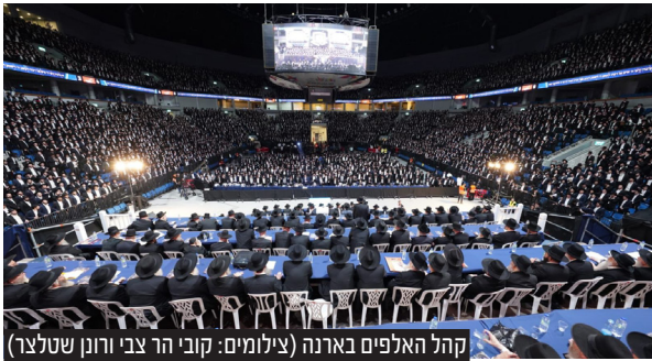
קהל האלפים בארנה