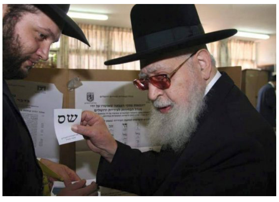
הכותב הוא הפרשן הפוליטי של רדיו קול חי

אם יש משהו שיכול לראות את ממשלת מדינת ישראל העונג שותים קפה ומלגלים על כולנו אחרי עוד ראיון נוטף ארס נגד הציבור החרדי של כמה מבכיריה, מגיע לו שהממשלה היוצאת תמשיך לשלוט כאן קדנציה נוספת. אני מתקשה להבין אנשים שרואים את הנתונים, מכירים את העובדות, חשים על בשרם את הגזירות, בוכים שנה וחצי על המציאות הפוליטית, ודווקא עכשיו, בישראל האחרונה, ימים אחדים לפני הבחירות, הם נזכרים להעלות טענות ישנות. מתחת לפני השטח, מפלגת ש"ס עושה הכל נכון. בתום קדנציה שבה נרשמה משמעת שיא ומאבק עיקש ומשותף של כל חברי הכנסת של המפלגה שהיו חדורי מטרה להפיל את הממשלה הנוכחית, קמפיין המפלגה הוא האפקטיבי והיצירתי ביותר מבין כלל המפלגות. יוקר המחיה, אחד הנושאים הבווערים ביותר כיום, מדבר לא רק לציבור החרדי. ציבור מסורתי ענק שברובו מתגורר בפריפריה, מזדהה עם המסרים של המפלגה. יחד עם זאת, מאז פטירתו של מרן הגר"ע יוסף זצ"ל, לא נרשמה אחדות כזו. בנו של מרן, חבר מועצת חכמי התורה הגאון רבי דוד יוסף, הטיל את כל כובד משקלו להרבות אחדות בקרב הציבור הספרדי, ולאחר שבעבר גייס את תמיכתו של הרה"צ יורם אברג'ל זצ"ל, בימים אלו לאחר שנפגש עימו בביתו, קיבל הגר"ד יוסף את תמיכתו של ראש ישיבת כסא רחמים הגאון הגדול רבי מאיר מאוזו שליט"א. מדובר בלא פחות מסיומה של המחלוקת הספרדית