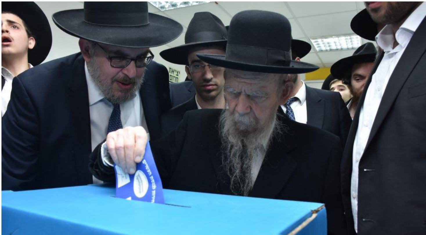
מי רואה אותם יוצאים? מרן גדול הדור בהצבעה

» פינדרוס: "גם אני לא כל כך מתחבר לכל הח"כים... זה בסדר. צריך להתחבר למסר ולקולקטיב של כולנו כציבור וכמי שישמור על זכויות המצביעים. בסוף מי שעומד על זכויותיו של הציבור החרדי בכל הנושאים ומי שנאבק על חיי הדת בארץ ישראל זה יהדות התורה וחברי הכנסת שלה, שעושים את זה באמונה 24 שעות ביממה"