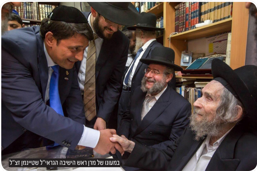
במעונו של מרן ראש הישיבה הגרואי"ל שטיינמן זצ"ל