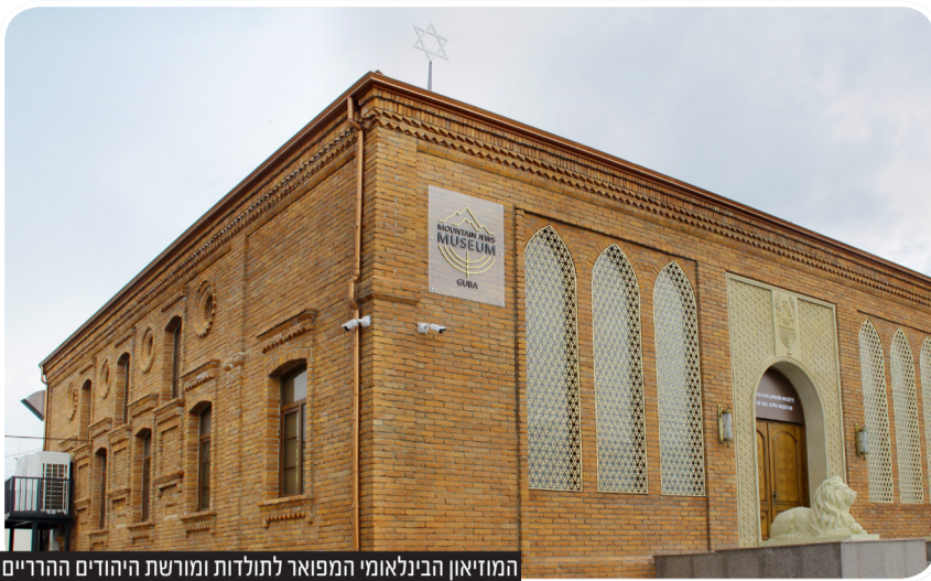
המוזיאון הבינלאומי המפואר לתולדות ומורשת היהודים ההרריים

כיום חלק הארי של קהילת היהודים ההרריים עלו לישראל. הקהילה הגדולה ביותר בתפוצות הוקמה בארצות הברית. במקום השני בכמות היהודים ההרריים היא הקהילה ברוסיה. כמו כן מתיישבים היהודים ההרריים גם באורבייג'ן, בגרמניה, בקנדה ובאוסטרליה.