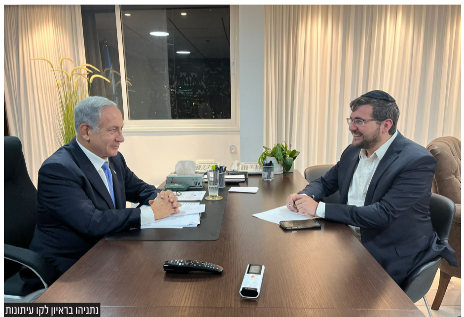
נתניהו בראיון לקו עיתונות