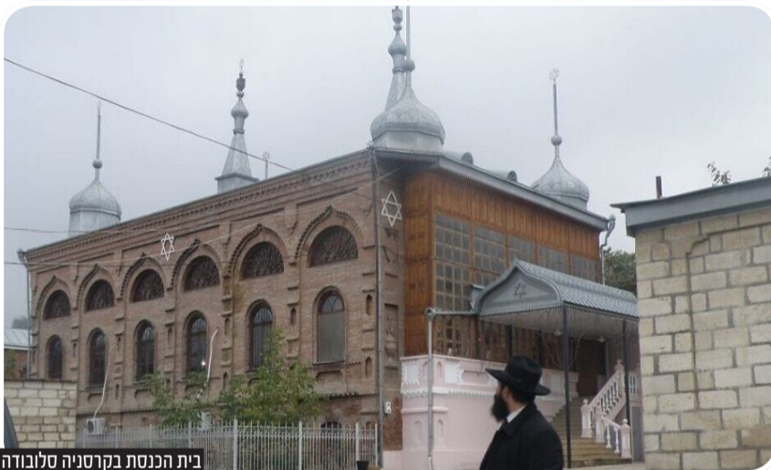
בית הכנסת בקרסניה סלובודה