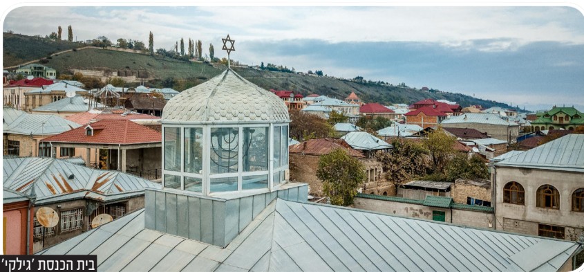
בית הכנסת 'גילקי'

קודם לכן שכנה העיירה על ההר הסמוך ושמה היה 'קוסרי'. רק לאחר מכן, כאשר הפרעות פסקו והיהודים הרגישו בטוחים יותר, הם עברו לעיירה למטה הנמצאת שם עד היום.