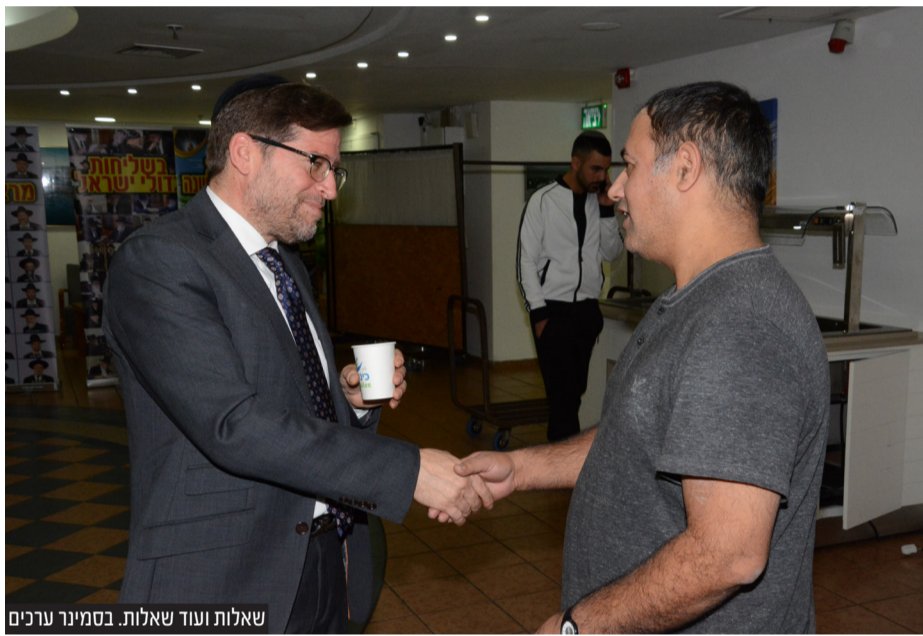
שאלות ועוד שאלות. בסמינר ערכים

תורת ישראל אמת, אלא האם התורה הזאת יכולה להפוך את החיים שלו לטובים יותר. זה נכון גם בציבור הרגיל וגם בציבור המשכיל". "המעניין הוא שכולם מתעניינים בהוכחות לאמינות התורה. גם הציבור האקדמאי וגם הציבור הכללי. בציבור המשכיל יש צורך לבאר יותר את טעמי המצוות של התורה כי קשה להם להזדהות עם תורה שמתנגשת עם הערכים שהם גדלו עליהם, כמו מעמד האישה והשוויון והערכים הפרוגרסיביים שתופסים חלק ניכר מהשיח הציבורי".