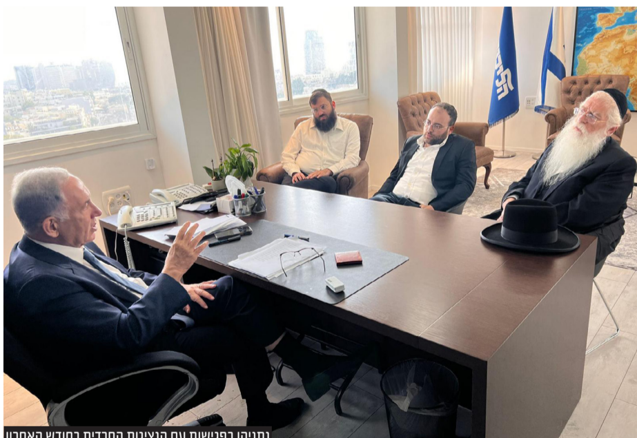
נתניהו בפגישות עם הנציגות החרדית בחודש האחרון