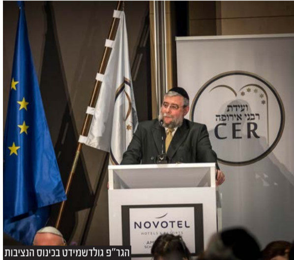
הגר"פ גולדשמידט בכינוס הנציבות