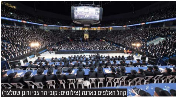
קהל האלפים בארנה