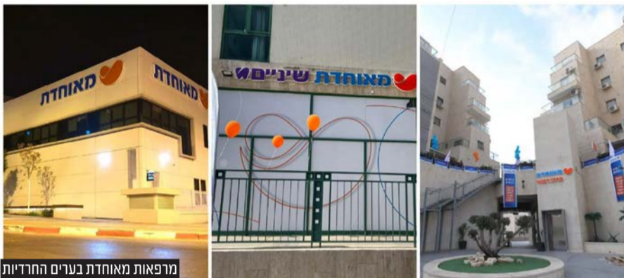
מראות מאחדת בערים החרדיות