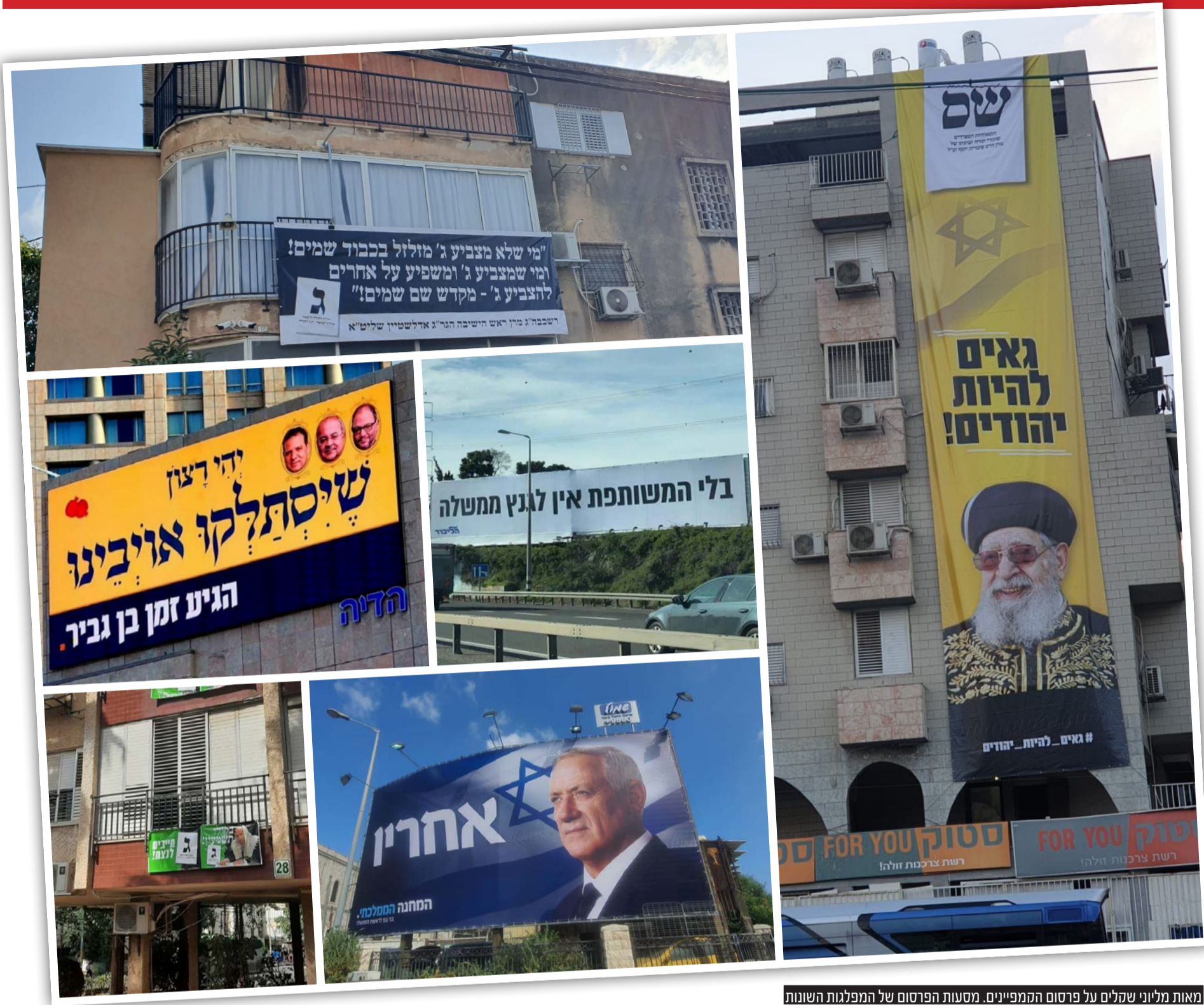
מאות מיליוני שהלים על פרסום ההמפיינים. מסעות הפרסום של המפלגות השונות

שמעתי קול אחד: פרישה מהתמודדות. כולם צידדו בפרישה מכובדת והמתנה לסיבוב הבא. מנגד, אחדים ממקורביה סבורים כי גם את תצליח לגרוף 60 או 70 אלף קולות בסיבוב הנוכחי, תחת ההנחה שהתיקו הפוליטי לא יישבר וישראל תיגדר למערכת בחירות שישית, יהיה לה לפחות עם מה לסחור ולייצר חיבור פוליטי שישאיר אותה בחיים הפוליטיים. איילת שקד לא תיבחר לכנסת ה-25. היא ידעה זאת כבר עם פיזור הכנסת לפני כארבעה חודשים. החיבור עם הנדל והאזור לא גרם לעקומת המנדטים בסקרים לצמוח כלפי מעלה. גם הפרידה מחברי 'דרך ארץ' והחבירה לבית היהודי בראשות יוסי ברודני, לא עוררו סחף ולא הצליחו לייצר תנודות של ממש בסיסמוגרף הפוליטי.