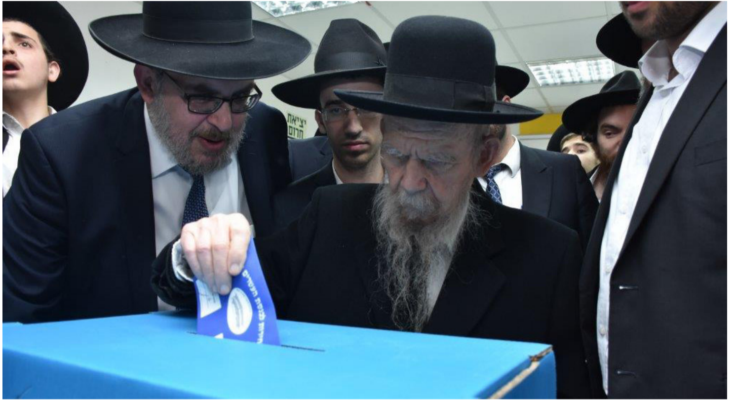
מי רואה אותם יוצאים? מרן גדול הדור בהצבעה | צילום: יהודה פרקוביץ

הדירור יש גם תוכנית ארצית לקדם בניית 200 אלף יח"ד ומתוכם 50 אלף לביצוע מיידית עבור הציבור החרדי. אני אישית מתכוונת להמשיך בעשייה בפניות ציבור בכל הנושאים בסיוע הלשכה המצוינת והיעילה שלי, וגם להתמקד בנושאי דיור, רווחה והשמת דגש מיוחד על תעסוקת חרדים. אלה נושאים שקרובים לליבי ובהם אני מתכוונת להשקיע את עיקר עבודתי."