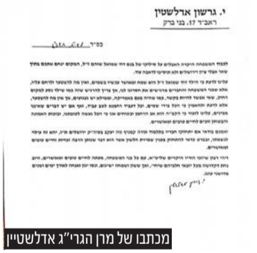
מכתבו של מון הגרי"ג אדלשטיין