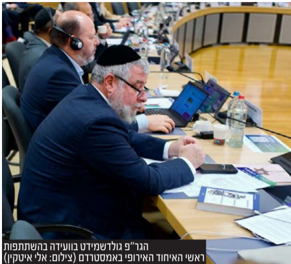
הגר"פ גולדשמידט בוועידה בהשתתפות ראשי האיחוד האירופי באמסטרדם