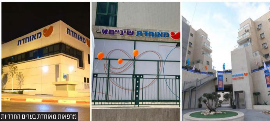
מראות מאוחדת בערים החרדיות