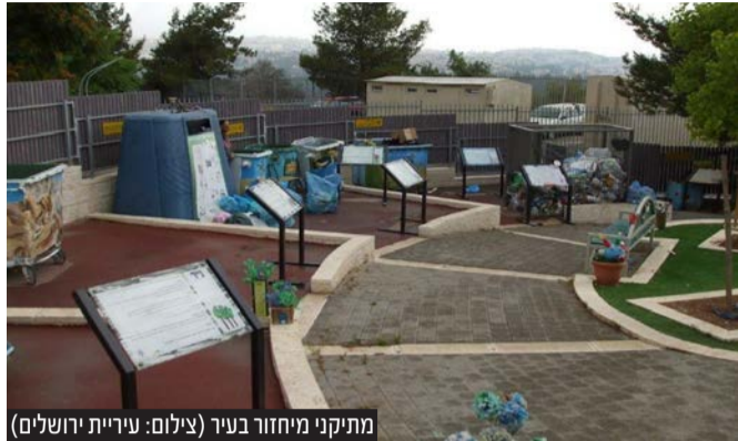
מתקני מיחזור בעיר