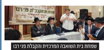
שמחת בית השואבה המרכזית והקבלת פני רבו בקהילת 'חברון היכל יחזקאל' למרן ראש הישיבה הגר"ד כהן שליט"א