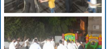
שמחת בית השואבה בקהילת 'היכל משה' - מרכז העיר