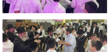
שמחת בית השואבה בישיבה לצעירים מצוינים בראשות ראש הישיבה הרב הגאון ר' זבולון כהנא שליט"א