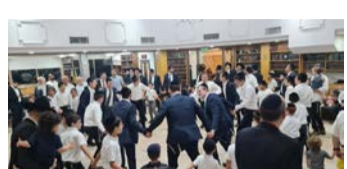
שמחת בית השואבה בקהילת 'צאנז' - מרכז העיר