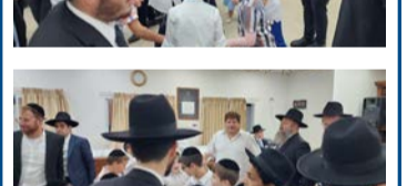
שמחת בית השואבה בקהילת 'בני השיבות' - מרכז העיר