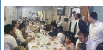
שמחת בית השואבה בקהילת 'אילת השחר' - עמישב