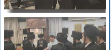
שמחת בית השואבה בקהילת הבעש"ט גני הדר