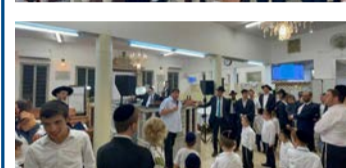
שמחת בית השואבה בקהילת 'זכר חיים' - מרכז העיר