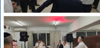
שמחת בית השואבה בקהילת 'בית אברהם' - מרכז העיר