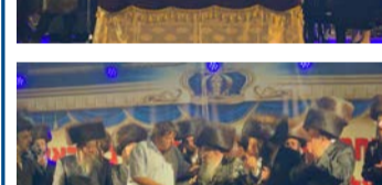
שמחת בית השואבה בחצר חסידות מישקולץ - מרכז העיר