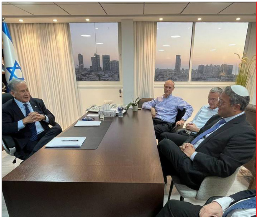
« בדרך למשרד לביטחון פנים, ח"כ איתמר בן גביר עם בנימין נתניהו

נתניהו לוחץ על דרעי לקחת את האוצר ולחסוך לו את כאב הראש, מול סמוטריץ' יטען נתניהו שדרעי קודם לו, משום שהוא מגיע בראשות סיעה של 11 מנדטים וסמוטריץ' מחזיק רק שבעה (שישה נוספים שייכים לעוצמה יהודית והאחד שייך לנעם), מול החברים בליכוד יסביר שדרישותיהן של השותפות הקואליציוניות קודמות לחלוקת השלל הפנימית. אבל דרעי אינו טיפש, הוא מודע למחיר התדמיתי הכבד שהוא עשוי לשלם, בפרט כמי שנושא את דגל מאבקן של השכבות החלשות - בהן שר האוצר אמור לפגוע, ולא מן הנמנע שהוא יסרב להצעה הלא כל כך מפתה