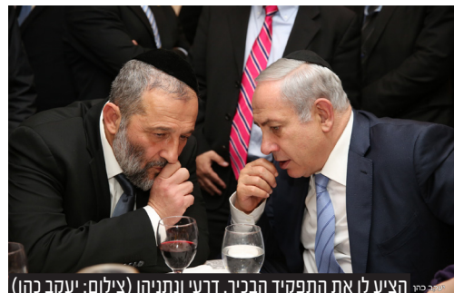
הציע לו את התפקיד הבכיר. דרעי ונתניהו

מיד לאחר השבעת הממשלה, יחל בליץ חקיקה של הקואליציה החדשה: פסקת התגברות, החזרת סוגיית הגיוס למצב של לפני ביטול חוק טל ב-2012, ביטול רפורמת הכשרות, ביטול הרפורמה בסלולר, ביטול העלאת המיסוי על משקאות מתוקים וחד פעמי, מניעת תחבורה ציבורית בשבת, שמירה על הסטטוס קוו, השוואת תקציבי מוסדות החינוך החרדים, חוק גיוס שיבטיח גיוס ע"י הרבנות הראשית, ביטול הקיצוץ המתוכנן בסכסוד מעונות יום לאברכים וביטול סעיף הנכד בחוק השבות