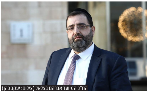
הח"כ המיועד אברהם בצלאל

שבנו או בתו לא מצאו את המסגרת החינוכית התואמת. כיום זוכה בצלאל לקרבתו והערכתו של הראשון לציין ונשיא מועצת הרבנות הראשית הגאון רבי יצחק יוסף שליט"א. בתקופת לימודו בישיבת מיר ובשנים הארוכות שלאחר מכן כאברך בכולל מיר, זכה אברהם בצלאל לקרבה והערכה של ראש הישיבה הגאון רבי נתן צבי פינקל וצוק"ל והמשגיח הגה"צ רבי אהרון חדש צוק"ל.