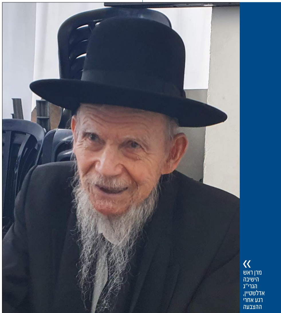
מרן ראש הישיבה הגרי"ג אדלשטיין, רגע אחרי ההצבעה

אם רוצים לשים את האצבע על נקודות המפתח, אפשר לסמן בכל מפלגה נקודה עיקרית אחת: בדגל התורה אין שום ספק כי מדובר בשעות הערב של יום ראשון, במעמד שנערך באופן סימולטני בעשרות מוקדים ברחבי הארץ, בהם התכנסו עשרות אלפי בני אדם כדי לשמוע את הוראתו ודבריו של מרן ראש הישיבה הגרי"ג אדלשטיין שליט"א. יש מנהיג לדור, וכעת זה מתבטא גם בתוצאות הבחירות