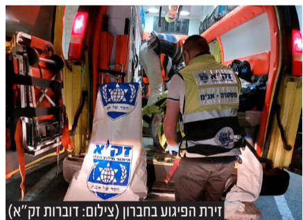
זירת הפיגוע בחברון

יו"ר הציונות הדתית, ח"כ בצלאל סמוטריץ' הגיב אף הוא ואמר: "על זה הבחירות מחר. להמשיך במחדל הביטחוני בחסות גנץ-לפיד והאחים המוסלמים או להשיב את הביטחון האישי, ההרתעה והגאווה הלאומית".