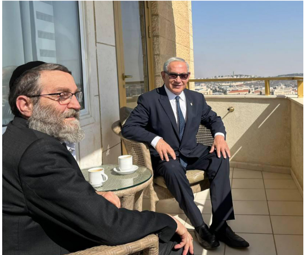
מו"מ על מי מנחות, נתניהו וגפני בפגישה השבוע

» בתסריט אפשרי לחלוטין, שכבר עלה במשרדי דגל התורה, תעדיף הסיעה הליטאית לקחת את הבעלות על פתרון מצוקת הדיור למגזר החרדי, לאור הלחצים הפנימיים הכבדים המגיעים מהציבור, ומתוך חשש שאגודת ישראל לא תוכל לספק לו את הפתרון הראוי. במקרה כזה, ינצל גפני את זכות הבכורה בבחירת התפקידים, ויכהן כסגן שר במעמד שר השיכון או ככזה שהשר המוצב מעליו יהיה מלכתחילה חותמת גומי. או אז, גולדקנופף יבחר במקומו בראשות ועדת הכספים, תפקיד שיחזור אחרי שנות הפוגה ארוכות לידיה של אגודת ישראל. בסך הכל, מדובר במחיר קואליציוני סביר ומינורלי, אם נזכור למשל את השלל שקיבלה מפלגת 'תקווה חדשה' בממשלה הקודמת על ששת מנדטים - סגנות ראש הממשלה, משרדי המשפטים, השיכון, החינוך והתקשורת, המשרד לענייני ירושלים ומורשת ותפקיד השר המקשר בין הכנסת והממשלה, סגן שר במשרד החינוך וראשות ועדת החינוך. תעריף כפול ויותר מזה שצפויה לדרוש יהדות התורה על שני פלגיה. צרות של עשירים בגדול, דרישותיהן של הסיעות החרדיות, גם בהינתן אי אלו חיכוכים וסוגיות שיש לפתור מול הציונות הדתית, הן החלק הקל עבור נתניהו. החלק המורכב יותר עבורו יהיה ההתמודדות עם דרישותיהן של הציונות הדתית ועוצמה יהודית. סמוטריץ' דורש את תיק הביטחון או האוצר, ובנוסף, שני תיקים נאים. בן גביר, כידוע, כבר נעול על המשרד לביטחון פנים, ובנוסף, גם הוא יבקש ככל הנראה שני