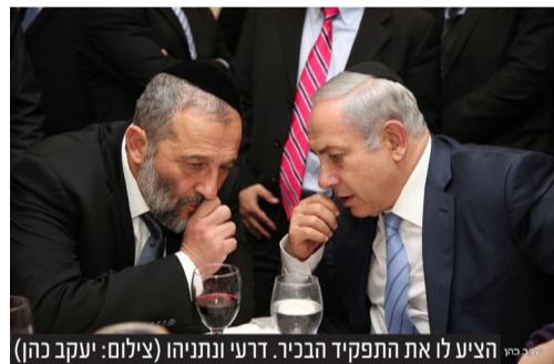
הציע לו את התפקיד הבכיר. דרעי ונתניהו

מיד לאחר השבעת הממשלה, יחל בליץ חקיקה של הקואליציה החדשה: פסקת התגברות, החזרת סוגיית הגיוס למצב של לפני ביטול חוק טל ב-2012, ביטול רפורמת הכשרות, ביטול הרפורמה בסלולר, ביטול העלאת המיסוי על משקאות מתוקים וחד פעמי, מניעת תחבורה ציבורית בשבת, שמירה על הסטטוס קוו, השוואת תקציבי מוסדות החינוך החרדים, חוק גיוס שיבטיח גיוס ע"י הרבנות הראשית, ביטול הקיצוץ המתוכנן בסבסוד מעונות יום לאברכים וביטול סעיף הנכד בחוק השבות