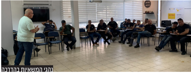
נהגי המשאנות והחובות

בשבוע שעבר נהגי המשא כבד של העירייה עברו הדרכות בטיחות בתעבורה בחורף