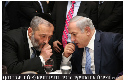
הציע לו את התפקיד הבכיר. דרעי ונתניהו

מיד לאחר השבעת הממשלה, יחל בליץ חקיקה של הקואליציה החדשה: פסקת התגברות, החזרת סוגיית הגיוס למצב של לפני ביטול חוק טל ב-2012, ביטול רפורמת הכשרות, ביטול הרפורמה בסלולר, ביטול העלאת המיסוי על משקאות מתוקים וחד פעמי, מניעת תחבורה ציבורית בשבת, שמירה על הסטטוס קוו, השוואת תקציבי מוסדות החינוך החרדים, חוק גיוס שיבטיח גיוס ע"י הרבנות הראשית, ביטול הקיצוץ המתוכנן בסבסוד מעונות יום לאברכים וביטול סעיף הנכד בחוק השבות