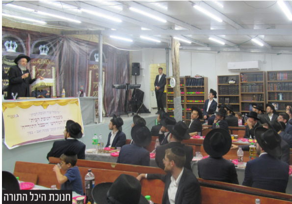
חנוכת היכל התורה

למרבה הפלא בעקבות ההרחבה גדל אף מספר המתפללים והתעורר צורך בהרחבה נוספת המתוכננת א"ה בקרוב.