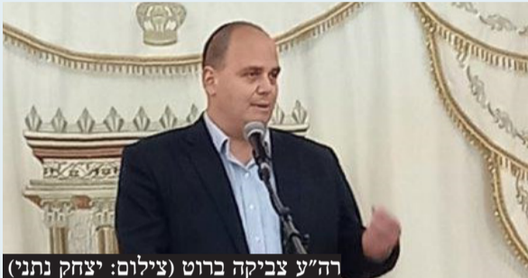
רה"ע צביקה ברוט

לפניהם שנה שלמה של עשייה ומוקדם עדיין לעסוק בבחירות המוניציפאליות, אך יחד עם זאת הם בטוחים שתושבי בת ים יעניקו לצביקה ברוט פעם נוספת את הניצחון אחרי שניכחו לראות את המהפכה האדירה שחולל בכל תחומי החיים בעיר בארבע השנים האחרונות.