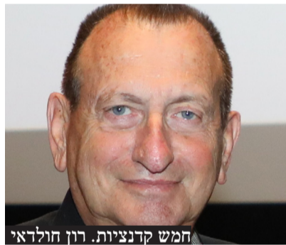
חמש קדנציות. רון חולדאי