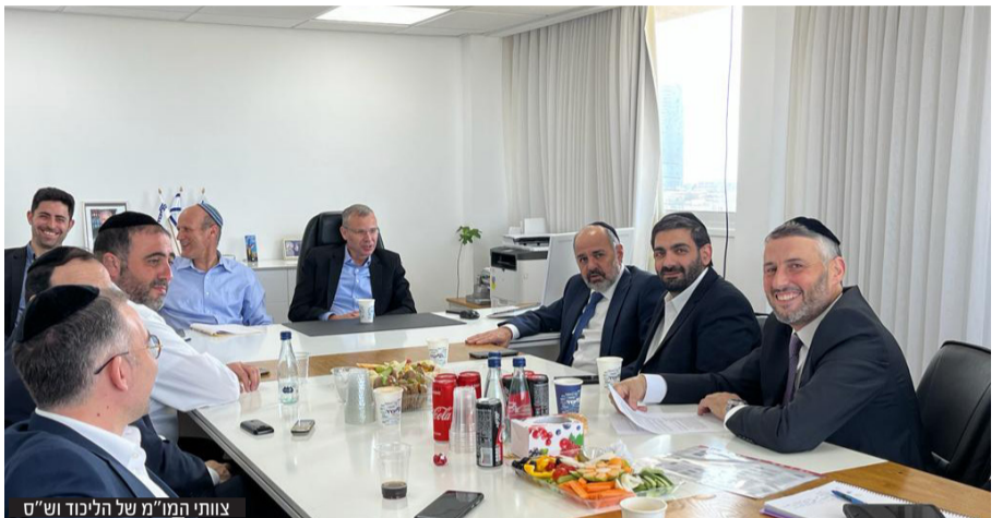
צוותי המו"מ של הליכוד ושי"ם

הח"כים המכהנים. אם נתניהו לא ימנה את דרמור לשר החוץ, ההערכה היא שלתפקיד ימונה אמיר אוחנה.