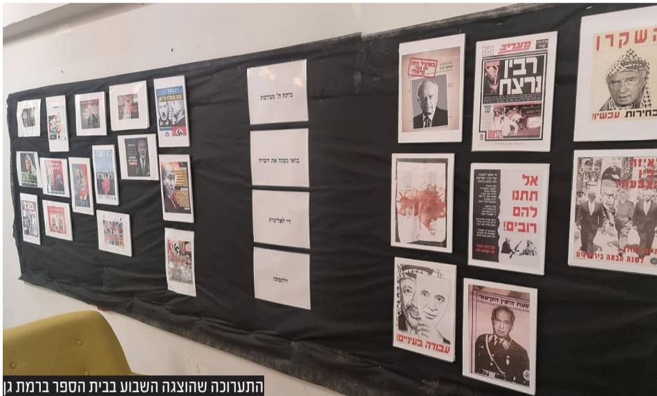
התערוכה שהוצגה השבוע בבית הספר ברמת גן

ועוד נקודה חשובה: זו לא פעם ראשונה שמשפחת נתניהו זוכה בתביעות דיבה. בני הזוג נתניהו זכו בתביעת דיבה נגד העיתונאי יגאל סרנה. נתניהו הבן זכה בתביעת דיבה נגד פעיל השמאל אייבי בנימין. השבוע - נתניהו האב, הבן והרעייה, זכו בתביעה נגד אהוד אולמרט. אם היו טורחים לתבוע את כל מפגיצי הדיבה כנגדם, יכלו ללמד לקח לא מעט מחורשי רעתם.