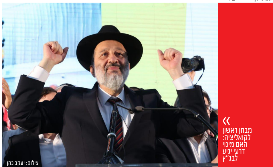
מבחן ראשון לקואליציה: האם מינוי דרעי יגיע לבג"ץ

סמוטריץ', אולי הדבר הכי רחוק מבנט שהפוליטיקה הסרוגה הוציאה מתוכה, הוא גם הדבר הכי דומה לו. מצד אחד, בניגוד לבנט הפרגמטיסט בעל הגמישות האידיאולוגית, סמוטריץ' הוא אידיאולוג למופת, ההתיישבות זורמת בעורקיו וישיבה בממשלה עם עבאס או מרצ היא תועבה בעיניו. מצד שני, לגמרי כמו בנט, סמוטריץ' - גם כשאינו מוקלט בסתר - לא לגמרי מחבב את נתניהו, ובנוסף, יש לו גם את אותה תחושת שליחות נשגבת, בעטייה הוא בטוח שהצלחת ארץ ישראל כולה מונחת על כתפיו, והוא עשוי להאמין באמת ובתמים שעדיף ללכת לסיבוב שישי עם לפיד כראש ממשלה זמני ובלבד שלא להתפשר על ערקתא דמסאנא