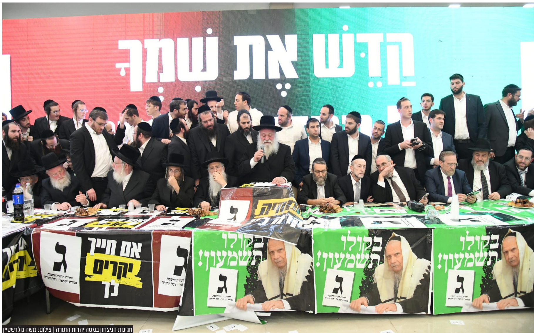
חגיגות הניצחון במטה יהדות התורה

ישראל בדרך למהפך: ע"פ ארבעת המדגמים של ארבעת הערוצים, הליכוד יחד עם מפלגות הגוש עוברות את 61 המנדטים. שעה קלה לאחר פרסום המדגמים נתניהו שוחח עם ראשי המפלגות הדתיות והחרדיות. תוצאות מדגם ערוץ 11: הליכוד 30, יש עתיד 22, הציונות הדתית 15, המחנה הממלכתי 13,