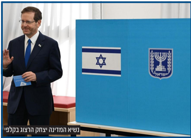
נשיא המדינה יצחק הרצוג בקלפי