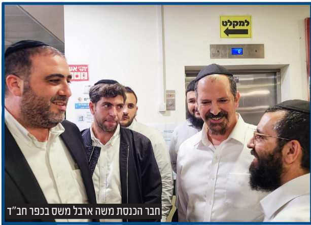
חבר הכנסת משה ארבל משש בכפר חב"ד