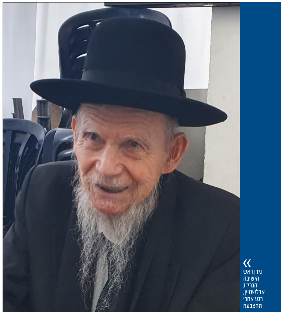
מרן ראש הישיבה הגרי"ג אדלשטיין, רגע אחרי ההצבעה

אם רוצים לשים את האצבע על נקודות המפתח, אפשר לסמן בכל מפלגה נקודה עיקרית אחת: בדגל התורה אין שום ספק כי מדובר בשעות הערב של יום ראשון, במעמד שנערך באופן סימולטני בעשרות מוקדים ברחבי הארץ, בהם התכנסו עשרות אלפי בני אדם כדי לשמוע את הוראתו ודבריו של מרן ראש הישיבה הגרי"ג אדלשטיין שליט"א. יש מנהיג לדור, וכעת זה מתבטא גם בתוצאות הבחירות