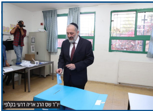
יו"ר שש הרב אריה דרעי בקלפי