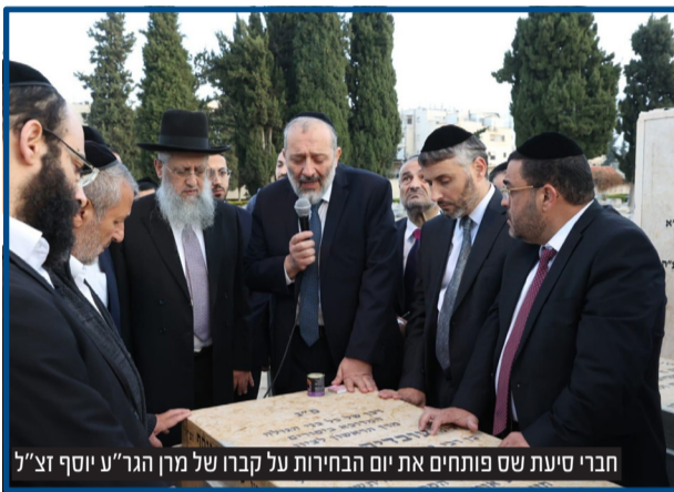
חברי סיעת שש פותחים את יום הבחירות על קברו של מרן הגר"ע יוסף זצ"ל