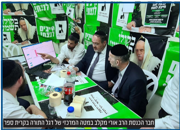
חבר הכנסת הרב אורי מקלב במטה המרכזי של דגל התורה בקרית ספר