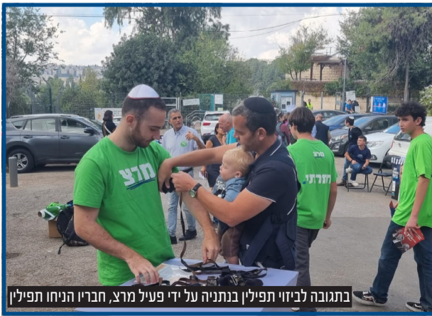
בתגובה לביזוי תפילין בנתניה על ידי פעיל מרצ, חברי הניחו תפילין