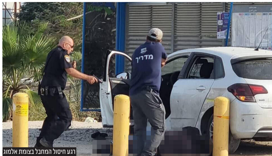
רגע חיסול המחבל בצומת אלמוג