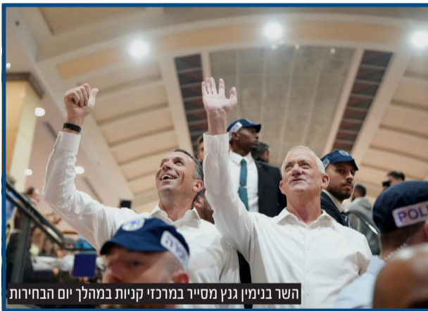
השר בנימין גנץ מסייר במרכזי קניות במהלך יום הבחירות