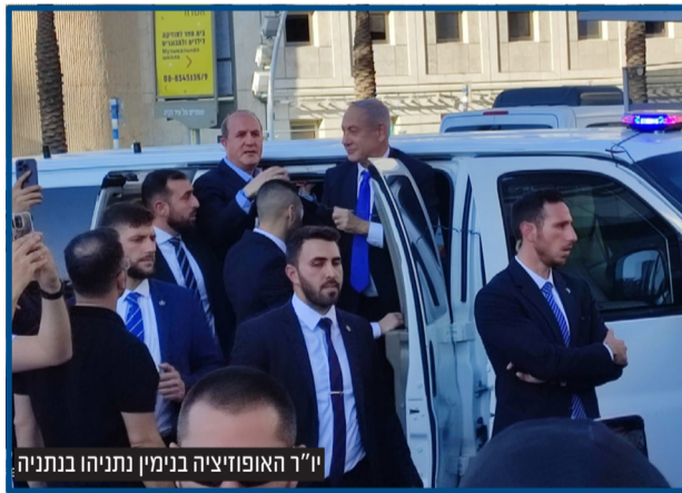
יו"ר האופוזיציה בנימין נתניהו בביתה