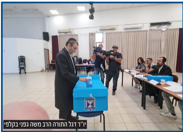
יו"ר דגל התורה הרב משה גפני בקלפי