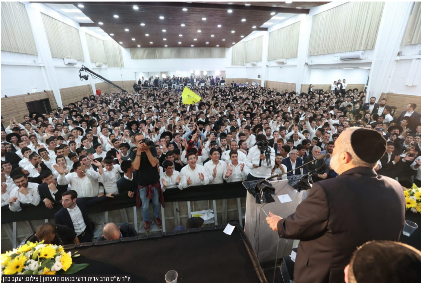
יו"ר ש"ס הרב אריה דרעי בנאום הניצחון

שר המשפטים. אנחנו נקים ממשלה לאומית, רוב העם היהודי רוצה את זה. אני מתעקש על זה. מה שהיה לא יהיה יותר. אנחנו נחזק את הזהות היהודית ואת המשילות".