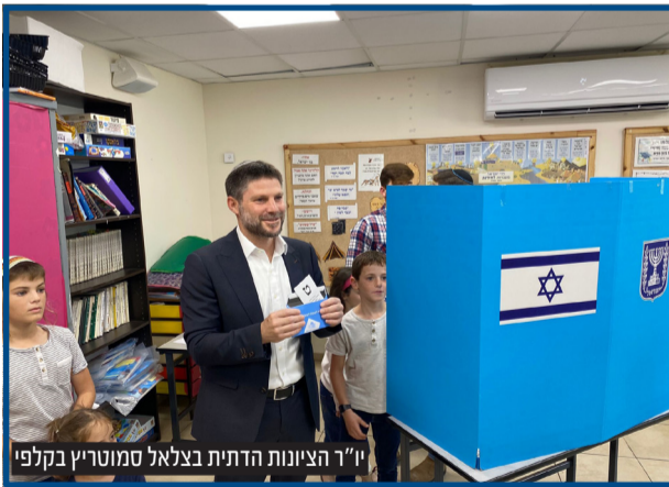
יו"ר הציונות הדתית בצלאל סמוטריץ בקלפי