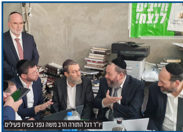
יו"ר דגל התורה הרב משה גפני בשיח פעילים