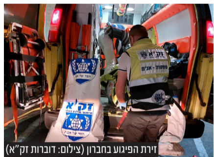
זירת הפיגוע בחברון

יו"ר הציונות הדתית, ח"כ בצלאל סמוטריץ' הגיב אף הוא ואמר: "על זה הבחירות מחר. להמשיך במחדל הביטחוני בחסות גנץ-לפיד והאחים המוסלמים או להשיב את הביטחון האישי, ההרתעה והגאווה הלאומית".