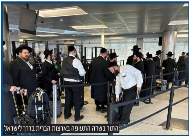
התור בשדה התעופה בארצות הברית בדרך לישראל