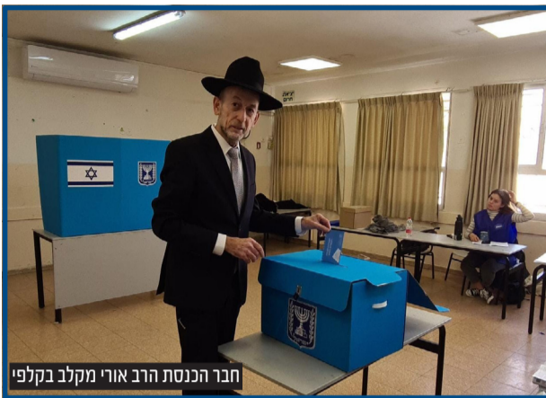
חבר הכנסת הרב אורי מקלב בקלפי