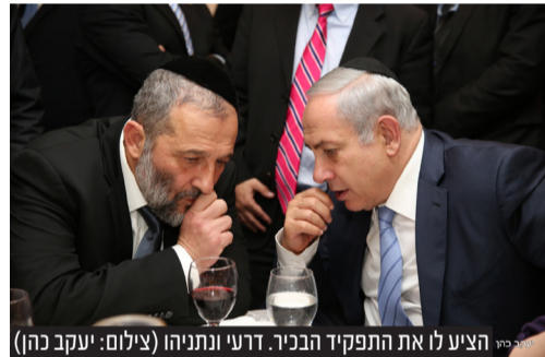
הציע לו את התפקיד הבכיר. דרעי ונתניהו

מיד לאחר השבעת הממשלה, יחל בליץ חקיקה של הקואליציה החדשה: פסקת התגברות, החזרת סוגיית הגיוס למצב של לפני ביטול חוק טל ב-2012, ביטול רפורמת הכשרות, ביטול הרפורמה בסלולר, ביטול העלאת המיסוי על משקאות מתוקים וחד פעמי, מניעת תחבורה ציבורית בשבת, שמירה על הסטטוס קוו, השוואת תקציבי מוסדות החינוך החרדים, חוק גיוס שיבטיח גיוס ע"י הרבנות הראשית, ביטול הקיצוץ המתוכנן בסבסוד מעונות יום לאברכים וביטול סעיף הנכד בחוק השבות