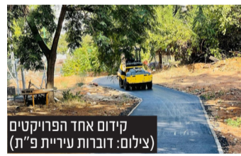
קידום אחד הפרויקטים

בנוסף, בהמשך ההחלטת המדינה בימים האחרונים לאפשר לרשויות המקומיות לקבוע הנחה