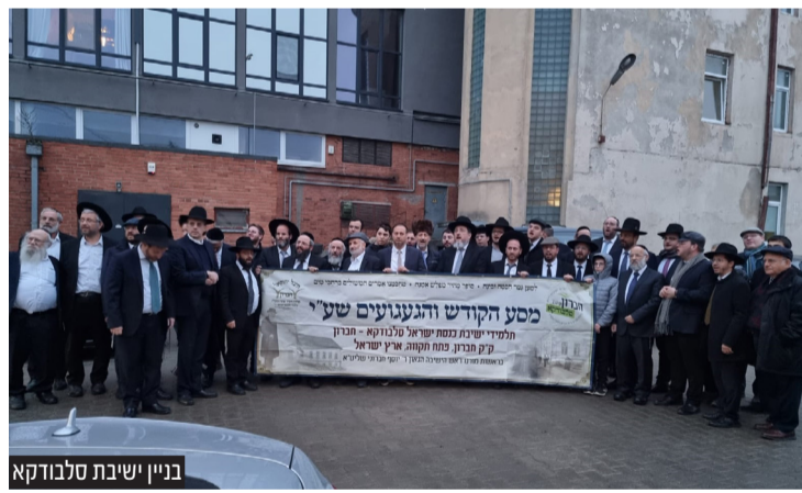
בניין ישיבת סלבדקא