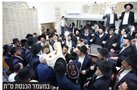
במעמד הכנסת ס"ת

בתהלוכה חגיגית שכמותה לא נראתה כבר שנים רבות בחוצות פ"ת, הוכנס ספר התורה שנתרם ע"י משפחת גלנצברג, לבית הכנסת שנבנה לפני כמעט מאה שנה ולאחרונה מחדש כנשר נעוריו