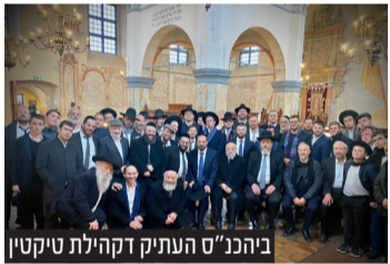
ביהכ"נ'ס העתיק דקהילת טיקטין

ארוכה. במהלך המסע התקיימה תפילת רבים בקבר הגר"א לישועת הכלל והפרט.