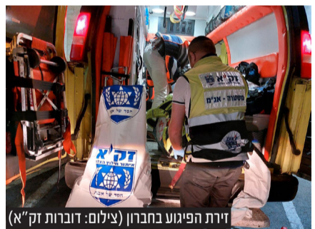
זירת הפיגוע בחברון

יו"ר הציונות הדתית, ח"כ בצלאל סמוטריץ' הגיב אף הוא ואמר: "על זה הבחירות מחר. להמשיך במחדל הביטחוני בחסות גנץ-לפיד והאחים המוסלמים או להשיב את הביטחון האישי, ההרתעה והגאווה הלאומית".