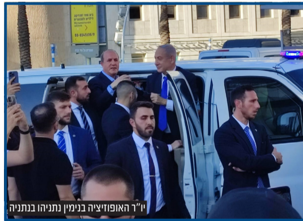
יו"ר האופוזיציה בנימין נתניהו בביתה