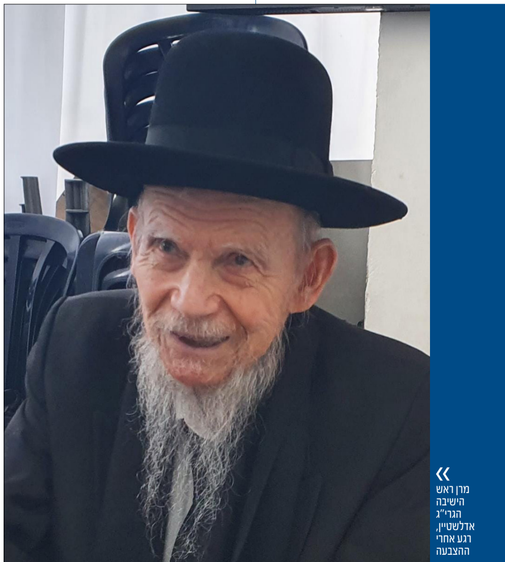
מרן ראש הישיבה הגרי"ג אדלשטיין, רגע אחרי ההצבעה

אם רוצים לשים את האצבע על נקודות המפתח, אפשר לסמן בכל מפלגה נקודה עיקרית אחת: בדגל התורה אין שום ספק כי מדובר בשעות הערב של יום ראשון, במעמד שנערך באופן סימולטני בעשרות מוקדים ברחבי הארץ, בהם התכנסו עשרות אלפי בני אדם כדי לשמוע את הוראתו ודבריו של מרן ראש הישיבה הגרי"ג אדלשטיין שליט"א. יש מנהיג לדור, וכעת זה מתבטא גם בתוצאות הבחירות