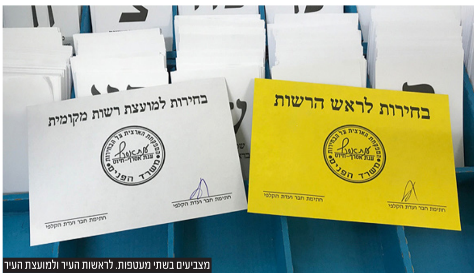
מצביעים בשתי מעטפות. לראשות העיר ולמועצת העיר

"בפעם הראשונה מאז 1993 הונהג השנה יום שבתון בבחירות לרשויות המקומיות, במטרה להעלות את שיעור ההצבעה", כתב פרופ' רזין. "עד 1973 נערכו הבחירות לרשויות המקומיות ביחד עם הבחירות לכנסת - ושיעור המצביעים בבחירות היה קרוב ל-80%. הפרדת הבחירות לרשויות המקומיות מהבחירות לכנסת הצניחה את שיעור המצביעים ל-57%-59%. לביטול יום השבתון ב-1993 היתה בהתחלה השפעה מינורית, אבל עם הזמן ובהתאמה לתהליך דומה שקרה בבחירות לכנסת, חלה ירידת מדרגה נוספת ב-2003 לשיעור ההצבעה של 50%-51%.