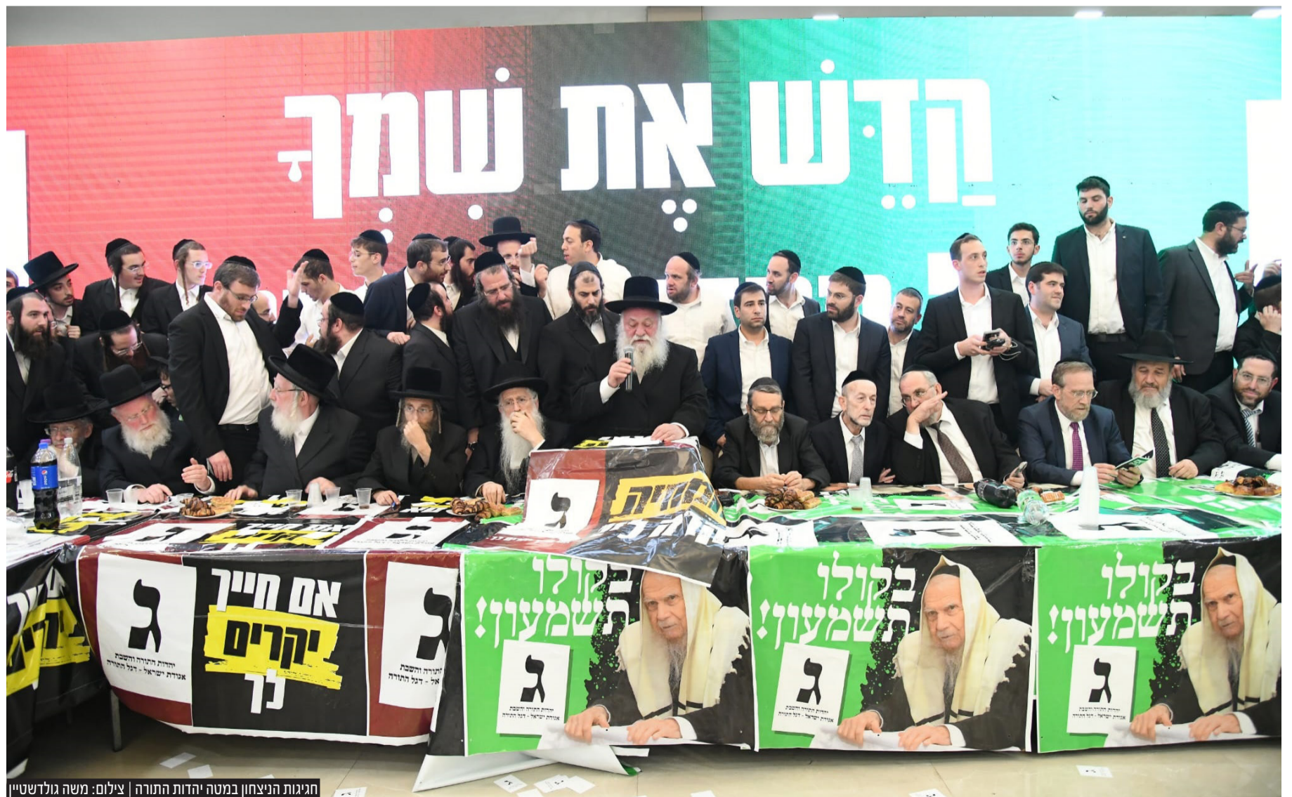
חגיגות הניצחון במטה יהדות התורה | צילום: משה גולדשטיין

ישראל בדרך למהפך: ע"פ ארבעת המדגמים של ארבעת הערוצים, הליכוד יחד עם מפלגות הגוש עוברות את 61 המנדטים. שעה קלה לאחר פרסום המדגמים נתניהו שוחח עם ראשי המפלגות הדתיות והחרדיות. תוצאות מדגם ערוץ 11: הליכוד 30, יש עתיד 22, הציונות הדתית 15, המחנה הממלכתי 13,