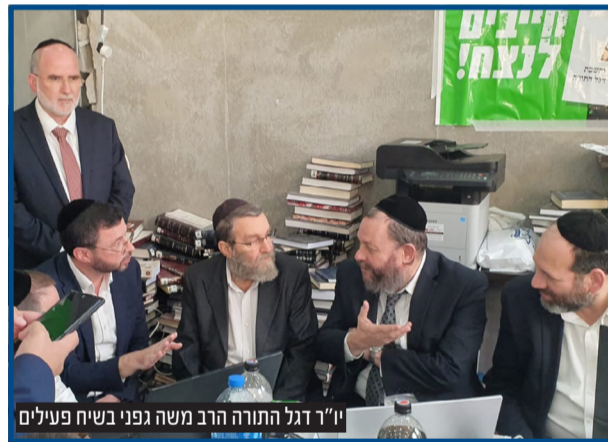
יו"ר דגל התורה הרב משה גפני בשיח פעילים