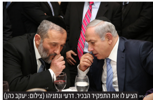
הציע לו את התפקיד הבכיר. דרעי ונתניהו

מיד לאחר השבעת הממשלה, יחל בליץ חקיקה של הקואליציה החדשה: פסקת התגברות, החזרת סוגיית הגיוס למצב של לפני ביטול חוק טל ב-2012, ביטול רפורמת הכשרות, ביטול הרפורמה בסלולר, ביטול העלאת המיסוי על משקאות מתוקים וחד פעמי, מניעת תחבורה ציבורית בשבת, שמירה על הסטטוס קוו, השוואת תקציבי מוסדות החינוך החרדים, חוק גיור שיבטיח גיור ע"י הרבנות הראשית, ביטול הקיצוץ המתוכנן בסבסוד מעונות יום לאברכים וביטול סעיף הנכד בחוק השבות