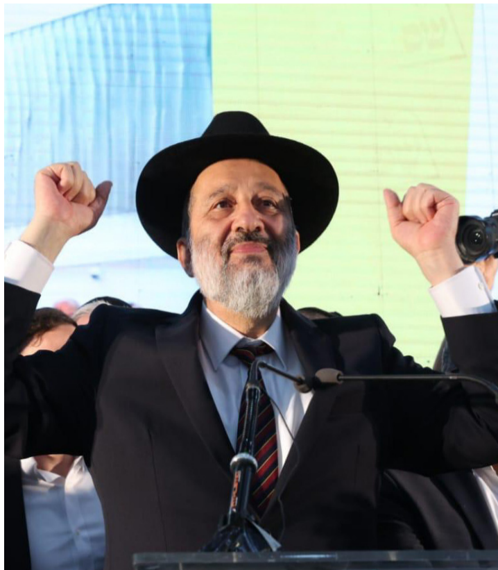
המנצח הגדול, דרעי חוגג 11 מנדטים