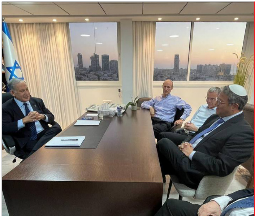
« בדרך למשרד לביטחון פנים, ח"כ איתמר בן גביר עם בנימין נתניהו

נתניהו לוחץ על דרעי לקחת את האוצר ולחסוך לו את כאב הראש, מול סמוטריץ' יטען נתניהו שדרעי קודם לו, משום שהוא מגיע בראשות סיעה של 11 מנדטים וסמוטריץ' מחזיק רק שבעה (שישה נוספים שייכים לעוצמה יהודית והאחד שייך לנעם), מול החברים בליכוד יסביר שדרישותיהן של השותפות הקואליציוניות קודמות לחלוקת השלל הפנימית. אבל דרעי אינו טיפש, הוא מודע למחיר התדמיתי הכבד שהוא עשוי לשלם, בפרט כמי שנושא את דגל מאבקן של השכבות החלשות - בהן שר האוצר אמור לפגוע, ולא מן הנמנע שהוא יסרב להצעה הלא כל כך מפתה