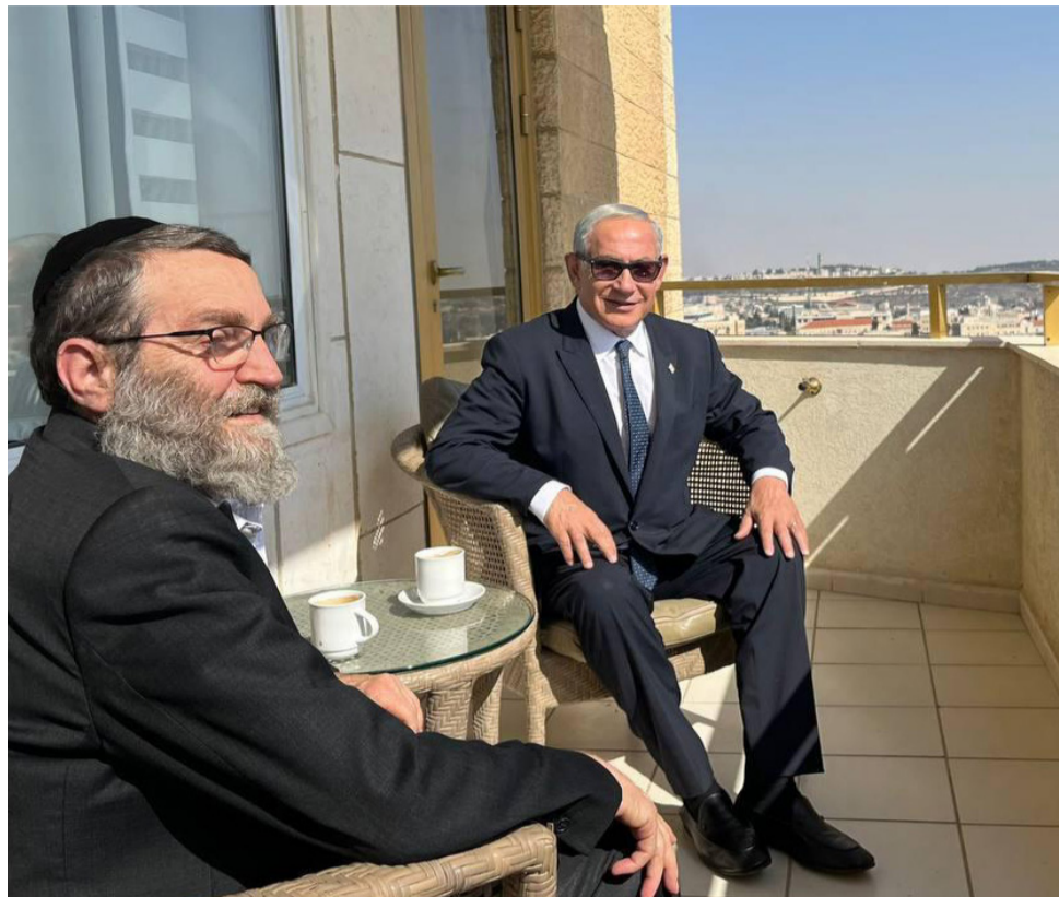
מו"מ על מי מנחות, נתניהו וגפני בפגישה השבוע

» בתסריט אפשרי לחלוטין, שכבר עלה במשרדי דגל התורה, תעדיף הסיעה הליטאית לקחת את הבעלות על פתרון מצוקת הדיור למגזר החרדי, לאור הלחצים הפנימיים הכבדים המגיעים מהציבור, ומתוך חשש שאגודת ישראל לא תוכל לספק לו את הפתרון הראוי. במקרה כזה, ינצל גפני את זכות הבכורה בבחירת התפקידים, ויכהן כסגן שר במעמד שר השיכון או ככזה שהשר המוצב מעליו יהיה מלכתחילה חותמת גומי. או אז, גולדקנופף יבחר במקומו בראשות ועדת הכספים, תפקיד שיחזור אחרי שנות הפוגה ארוכות לידיה של אגודת ישראל. בסך הכל, מדובר במחיר קואליציוני סביר ומינורלי, אם נזכור למשל את השלל שקיבלה מפלגת 'תקווה חדשה' בממשלה הקודמת על ששת מנדטים - סגנות ראש הממשלה, משרדי המשפטים, השיכון, החינוך והתקשורת, המשרד לענייני ירושלים ומורשת ותפקיד השר המקשר בין הכנסת והממשלה, סגן שר במשרד החינוך וראשות ועדת החינוך. תעריף כפול ויותר מזה שצפויה לדרוש יהדות התורה על שני פלגיה. צרות של עשירים בגדול, דרישותיהן של הסיעות החרדיות, גם בהינתן אי אלו חיכוכים וסוגיות שיש לפתור מול הציונות הדתית, הן החלק הקל עבור נתניהו. החלק המורכב יותר עבורו יהיה ההתמודדות עם דרישותיהן של הציונות הדתית ועוצמה יהודית. סמוטריץ' דורש את תיק הביטחון או האוצר, ובנוסף, שני תיקים נאים. בן גביר, כידוע, כבר נעול על המשרד לביטחון פנים, ובנוסף, גם הוא יבקש ככל הנראה שני