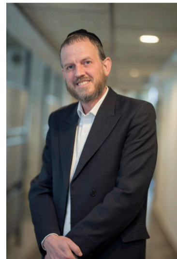
הכותב מכהן כחבר ועדת הבחירות המרכזית

כללו של דבר, נצחונו של גוש הימין בבחירות לכנסת ה-25, ברור ויציב, ואל לאיש להתנצל על כך שהן משקפות באופן מלא את רצון העם.