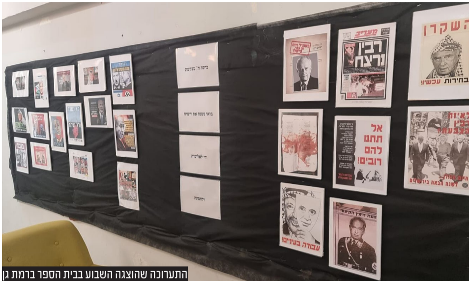
התערוכה שהוצגה השבוע בבית הספר ברמת ג

בעיריית ר"ג התנערו מהמיצג, שרת החינוך תקפה, בליכוד מיהרו להגיש תלונה והמורה נקרא לכירור. בהמשך התברר כי לצד נתניהו נתלו גם כרזות של רבין במדי אס-אס בכדי להדגיש שההסתה לא חלפה מן העולם. לגודל האבסורד, כותרת המיצג הייתה: די לאלמוות וההסתה. מי שמשתמש במיציגים מסיתים בכדי לקרוא למניעת הסתה, שקול למי שרוצה לכבות מדורה בוערת באמצעות חבית נפט.