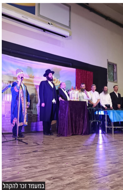
במעמד זכר להקהל