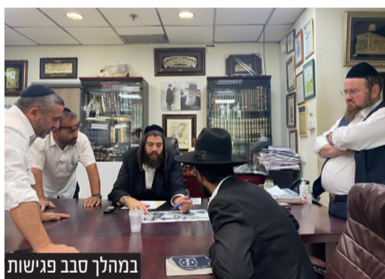
במהלך סבב פגישות