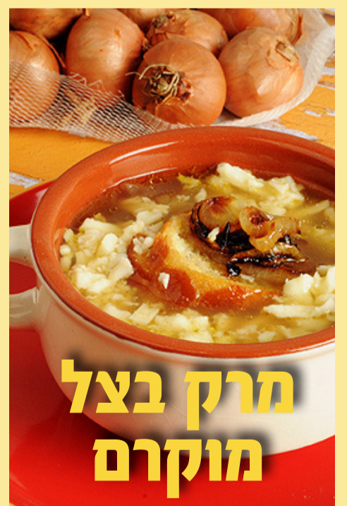
המתכון הופק בשיתוף אתי בטיטו - מתכונאית ובלוגרית.