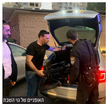
האופניים של גוי השבת

האופניים, ואלו הוחזרו אחר כבוד לגוי של שבת שיוכל גם בשבתות הבאות להעניק את שירותיו היעילים לתושבים.