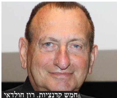
המש קדנציות. רון חולדאי