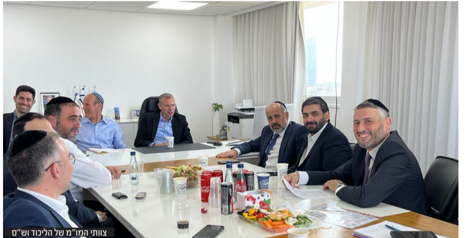
צוותי המו"מ של הליכוד ושי"ם

הח"כים המכהנים. אם נתניהו לא ימנה את דרמר לשר החוץ, ההערכה היא שלתפקיד ימונה אמיר אוחנה.