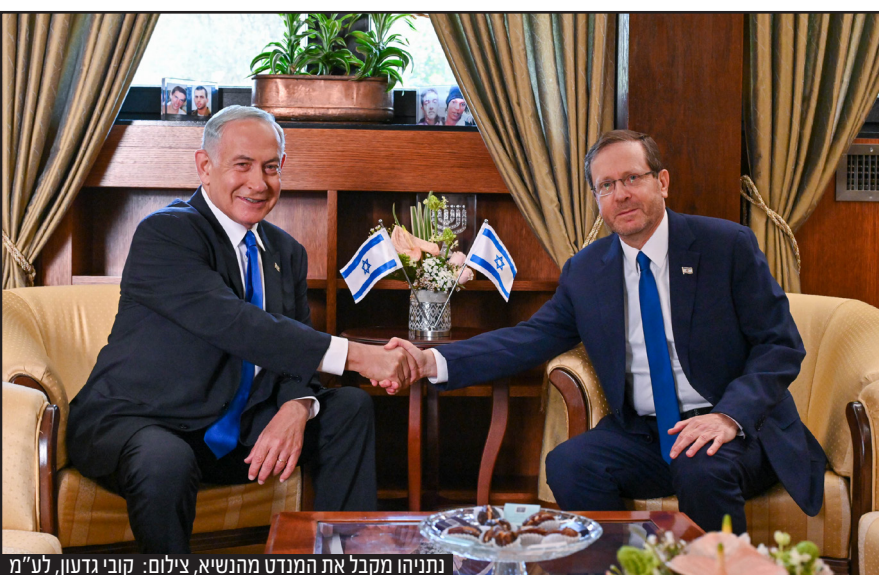
נתניהו מקבל את המנדט מהנשיא, צילום: קובי גדעון, לע"מ