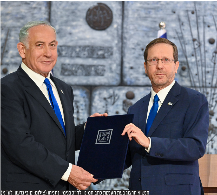
הנשיא הרצוג בעת הענקת כתב המינוי לח"כ בנימין נתניהו

בעת הטלת המנדט על ח"כ בנימין נתניהו אמר נשיא המדינה יצחק הרצוג: "לא נעלמה מעיני כמובן, העובדה כי כנגד ח"כ נתניהו מתנהל הליך משפטי בבית המשפט המחוזי בירושלים, ואינני מקל בכך ראש כלל וכלל. עם זאת חשוב לציין כי בית המשפט העליון כבר אמר את דברו בבירור" • נתניהו: "יש מי שמשמיע נבואות זעם על סוף המדינה והדמוקרטיה. אמרו את זה על בגין ועליו, זה לא היה נכון אז וזה לא נכון גם היום"