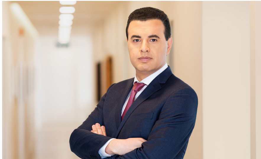
מאת: אלי כהן

ג' תושבת בני ברק פוצתה באמצעות עו"ד אלי מאור מבני ברק בסכום של 344,000 ש"ח בגין נפילה בבור במדרכה בעיר בני ברק בבין הזמנים, שבעקבותיה נפגעה בנזקי גוף