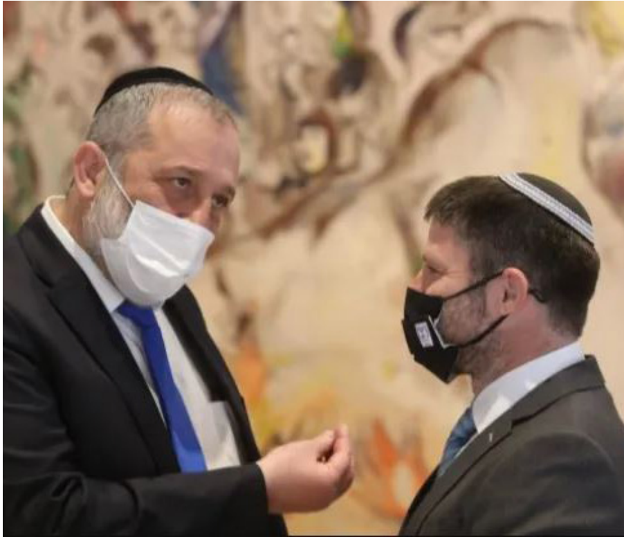
פלוונטר משולש, נתניהו, דרעי וסמוטריץ' מחפשים מוצא, צילום: Marc Israel Sellem/POOL

הסחורה למאות המשתתפים. הוא תקף בחריפות את מערכת המשפט, הבטיח שהקואליציה הקרובה תחליש את כוחה, הצהיר ש"כלי פסקת התגברות לא תהיה קואליציה" וקינח בחשיפה של סעיף בהסכם הקואליציוני המיועד, ולפיו כל "גזירות בנט וליברמן" תבוטלה לאלתר.