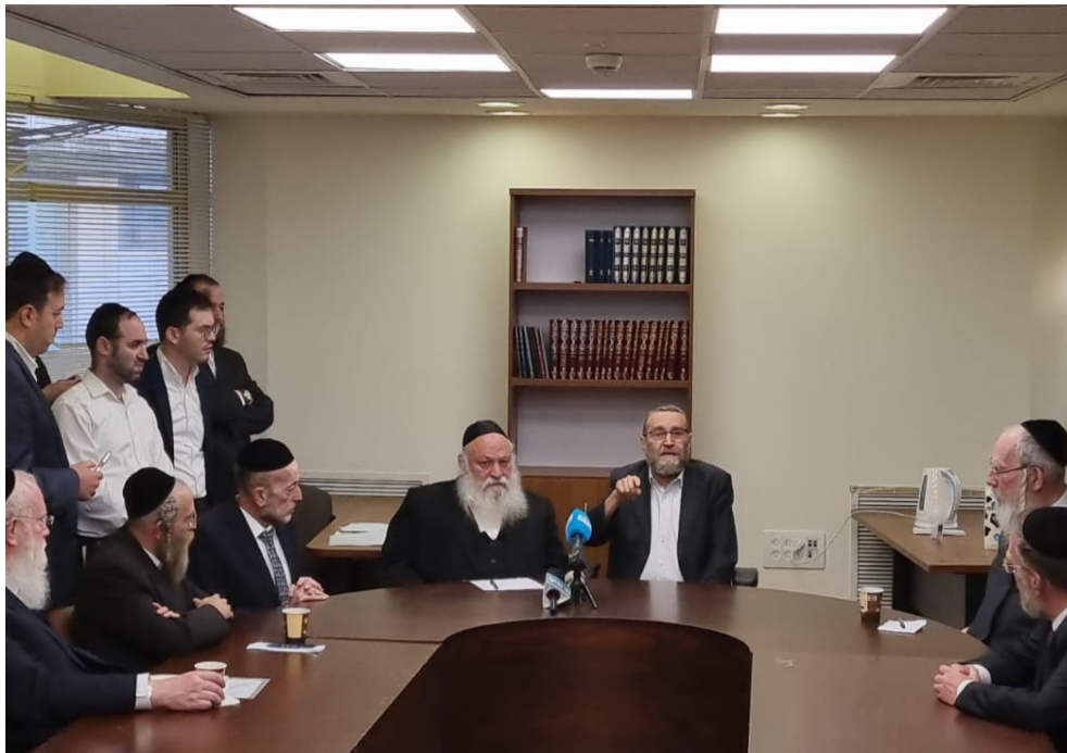
שבועה ח"כים, שבועה קולות. סיעת יהדות התורה

בש"ס בפרט, ובקואליציה כולה, גמרו אומר שלא לוותר וללכת בסוגיה הזו עד הסוף. אם היועמ"שית או בית המשפט העליון יקראו תיגר על סמכותה של הממשלה והכנסת, הם ימצאו מולם יריבים שווי ערך ונכונים לקרב.