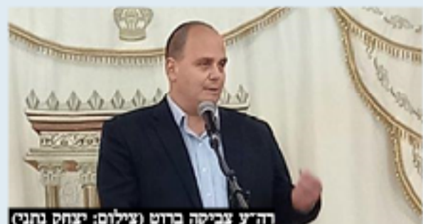
רה"ע צביקה ברוט

לפניהם שנה שלטת של עשייה ומוקדם עדיין לעסוק בבחירות המוניציפאליות, אך יחד עם זאת הם בטוחים שתושבי בת ים יעניקו לצביקה ברוט פעם נוספת את הניצחון אחרי שניכחו לראות את ההפכה האדירה שחולל בכל תחומי החיים בעיר בארבע השנים האחרונות.