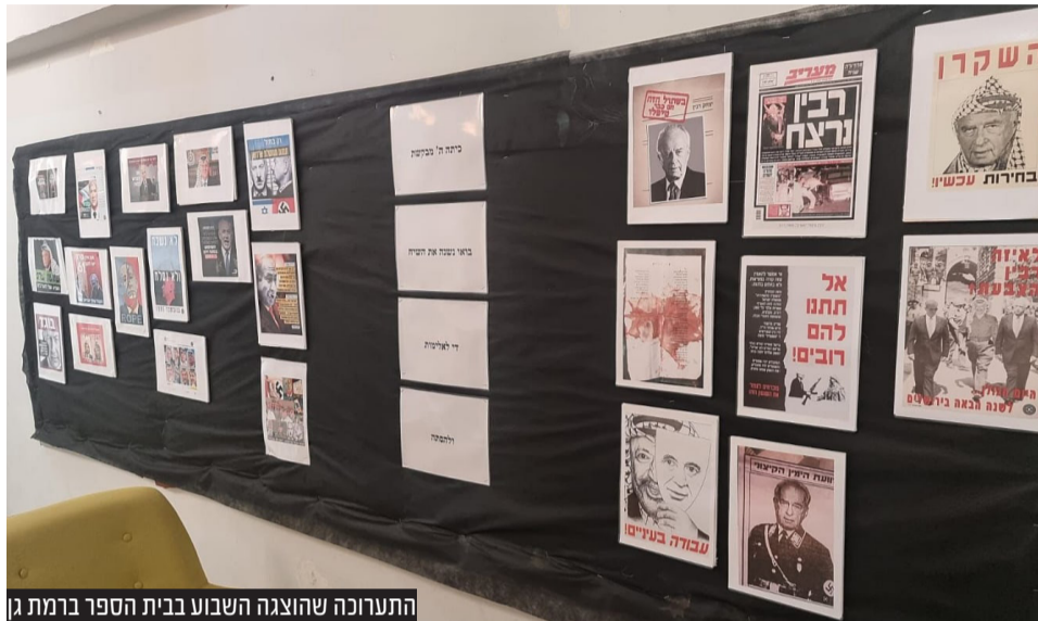
התערוכה שהוצגה השבוע בבית הספר ברמת גן

בעיריית ר"ג התנערו מהמיצג, שרת החינוך תקפה, בליכוד מיהרו להגיש תלונה והמורה נקרא לכיבוד. בהמשך התברר כי לצד נתניהו נתלו גם כרזות של רבין במדי אס-אס בכדי להדגיש שההסתה לא חלפה מן העולם. לגודל האבסורד, כותרת המיצג הייתה: די לאלמוות וההסתה. מי שמשתמש במיצגים מסיתים בכדי לקרוא למניעת הסתה, שקול למי שרוצה לכבות מדורה בוערת באמצעות חבית נפט.