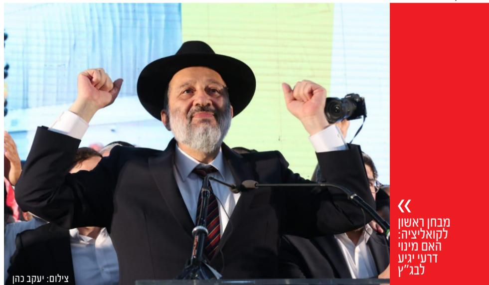
מבחן ראשון לקואליציה: האם מינוי דרעי יגיע לנב"ץ

סמוטריץ', אולי הדבר הכי רחוק מבנט שהפוליטיקה הסרוגה הוציאה מתוכה, הוא גם הדבר הכי דומה לו. מצד אחד, בניגוד לבנט הפרגמטיסט בעל הגמישות האידיאולוגית, סמוטריץ' הוא אידיאולוג למופת, ההתיישבות זורמת בעורקיו וישיבה בממשלה עם עבאס או מרצ היא תועבה בעיניו. מצד שני, לגמרי כמו בנט, סמוטריץ' - גם כשאינו מוקלט בסתר - לא לגמרי מחבב את נתניהו, ובנוסף, יש לו גם את אותה תחושת שליחות נשגבת, בעטייה הוא בטוח שהצלת ארץ ישראל כולה