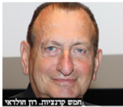
חמש קרנציות. רון חולדאי

ראש העיר תל אביב רון חולדאי טכנה כבר 5 קרנציות רצופות כראש העיר. הוא נבחר לראשונה לראשות העיר בבחירות המוניציפאליות 1998 לאחר שראש העיר הטכנה רוני טילוא הודיע כי אין כוונתו להתמודד לכהונה נוספת. חולדאי ניצח עם 50% תמיכה קול ל-25% לתמודד העיקרי טולד דודון ורובין.