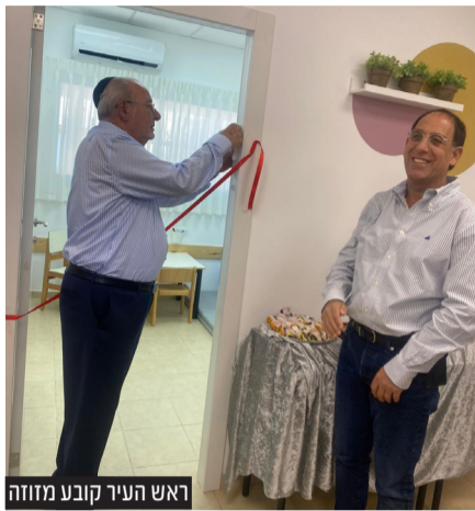
ראש העיר קובע מזוזח

מינהל החינוך בעיריית רחובות פתח בשבוע האחרון מרכז לגיל הרך המיועד לציבור החרדי ברח' ההגנה 46