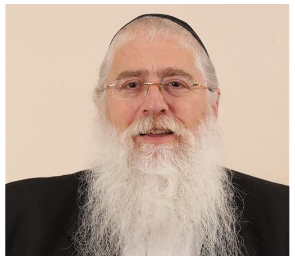
פרוש. שר לענייני ירושלים ומסורת