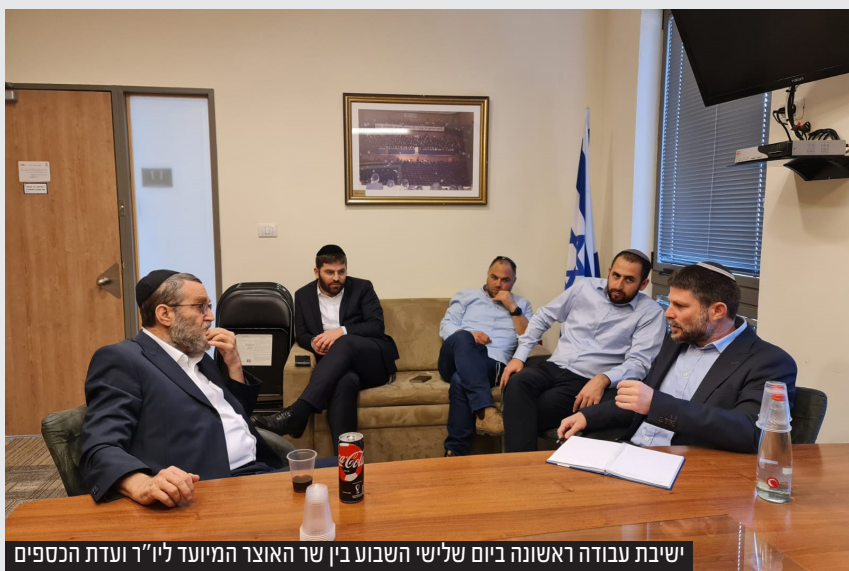
ישיבת עבודה ראשונה ביום שלישי השבוע בין שר האוצר המיועד ליו"ר ועדת הכספים

חמישה שרים יכהנו מטעם ש"ס כאשר יו"ר המפלגה יכהן כשר הפנים והבריאות במחצית הראשונה של הקדנציה ושר האוצר בחצי השני. עוד ארבעה נציגים של ש"ס יכהנו כשרים במשרד הפנים, החינוך, הרווחה והדתות. ביהדות התורה יכהנו שני שרים - השיכון וירושלים ומסורת, שני סגני שרים - בתחבורה וברווחה, יו"ר ועדת הכספים ועוד שלושה ראשי ועדות | עמ' 8