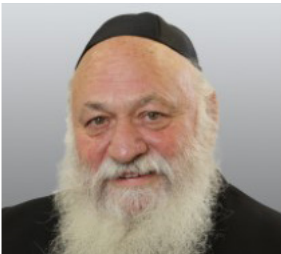
גולדקנופף. שר השיכון