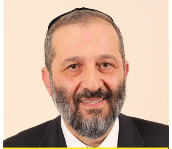
דרעי. שר הפנים והבריאות