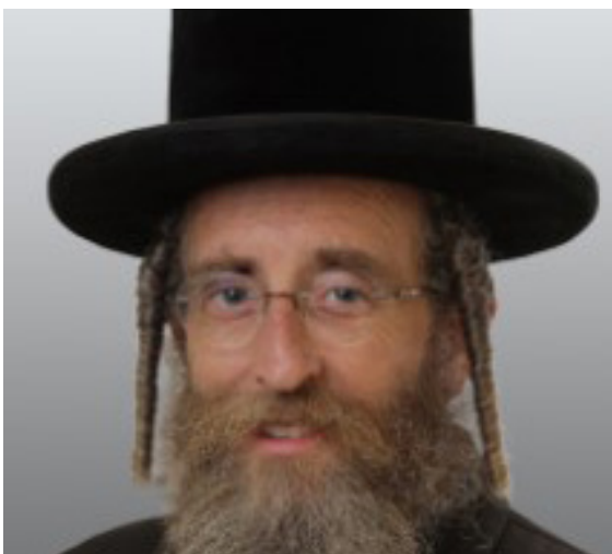
סלר. סגן שר הרווחה