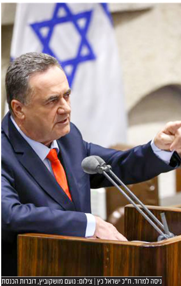
ניסה למרוח. ח"כ ישראל כץ

במאמר תחת הכותרת "בניגוד לטענות, אריה דרעי לא הואשם או הורשע בהעלמת מס", כותבים עוה"ד מזרחי וקריגל כי "השיח הציבורי הנוגע לעבירות המס בהן הורשע ח"כ אריה דרעי עושה לו עוול חמור. ניתוח מקצועי של האירועים מעלה