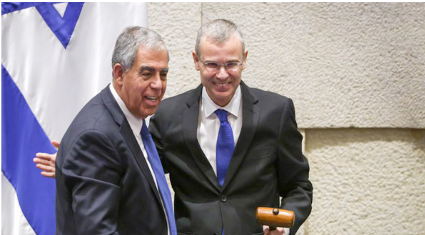
זה שיוצא וזה שנכנס, זמנית. ראשי הכנסת מיקי לוי ויריב לוין

» בינתיים, העניק נשיא המדינה לנתניהו בשישי האחרון עשרה ימים נוספים מתוך הארבעה עשר שהתבקש לתת. על זה יוכל נתניהו להוסיף עוד שבוע להשלמת הליכי חקיקה מרגע שיבשר לנשיא כי עלה בידו להרכיב ממשלה ואולי גם את ארבעת הימים הנותרים אם יואיל הנשיא להעניק לו ארכה נוספת. מאחורי הקלעים, בוחש הרצוג באלגנטיות, בניסיון לחולל שינוי של הרגע האחרון ולשלב את גנץ בממשלה, במקום או לצד נציגי הציונות הדתית ועוצמה יהודית, ולכל הפחות לייצר ערוץ שכזה