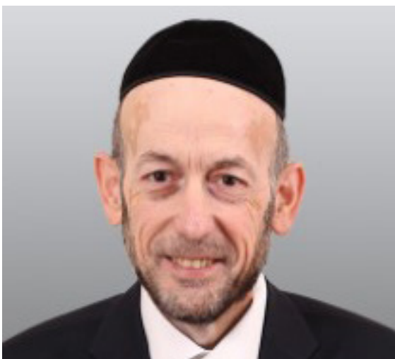
מקלב. סגן שר התחבורה