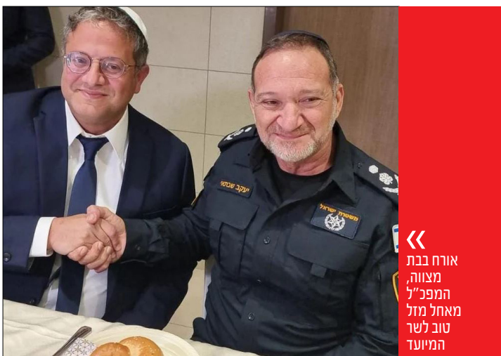
« אורח בבת מצווה, המפכ"ל מאחל מזל טוב לשר המיועד

ולא רק בחינוך, נושא הדיור זוכה לטיפול נאה עם התייחסות נרחבת לתכנון ובנייה עבור המגזר החרדי. בכך שגם הכלי המרכזי למימוש הדרישה - משרד השיכון - יהיה בידיה של המפלגה, אולי יהיה ניתן לראות אור בקצה המנהרה. גם בנושא התחבורה נדרשים שיפורים, מביטול רפורמת מיכאלי ועד הרחבת התקציבים ותגבור משמעותי של הקווים בערים החרדיות. אפילו סוגיית הגניזה זוכה לסעיף משלה, שיפטור את הטמנתה מתשלום אגרה מיוחדת