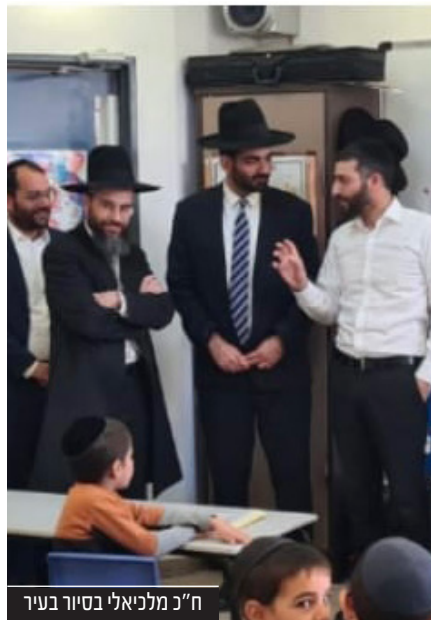
ח"כ מלכיאלי בסיור בעיר

יו"ר סיעת ש"ס בכנסת, חה"כ מיכאל מלכיאלי קיים בתחילת השבוע סיור עומק במוסדות התורה והחינוך בעיר יחד רה"ע הגב' עליזה בלוך • מלכיאלי: "התרשמתי מאד מרה"ע הגב' בלוך אשר שמה את נושא החינוך במקום הראשון וחרף האתגרים הרבים - פועלת רבות בנושא חשוב זה"