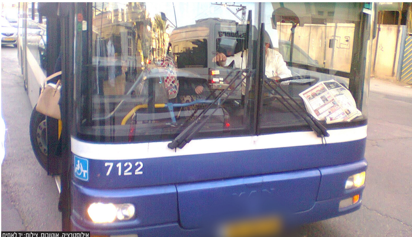
אילוסטרציה, אוטובוס, צילום: יד לאחים

מדובר בנתון כואב שהולך והופך לעובדה בחודשים ובשנים האחרונות • לפי הנתונים המטופלים בעצם ימים אלו, התופעה אינה פוסחת על שום קהילה או עדה • ביד לאחים מצביעים על נקודות התורפה, שמים אצבע על נורות האזהרה והגורמים להתרחבות התופעה, ממליצים על כללי עזרה ראשונה עם היחשפות לכל גילוי של כל אחת מהנקודות המתוארות