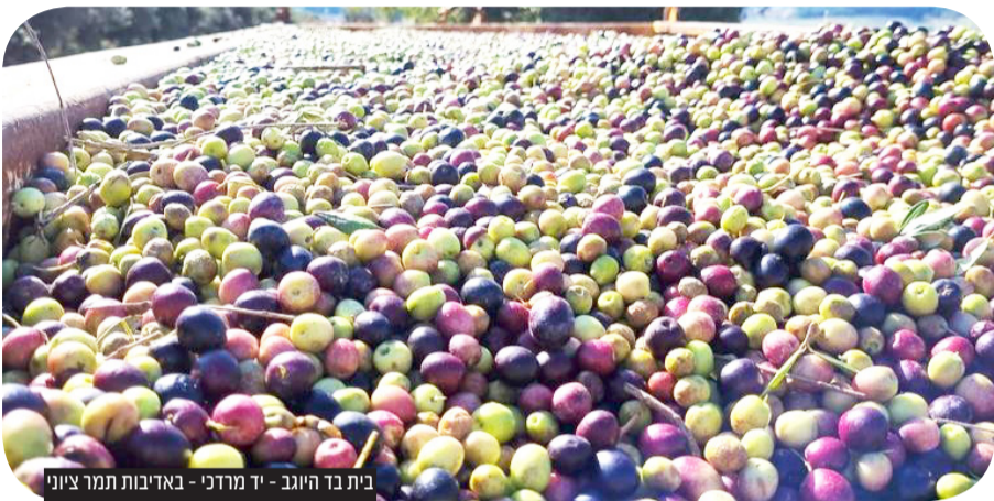
בתבד היוגב - יד מודני - באדיבות תמר ציוני

שמן זית הוא מוצר בסיסי בכל מטבח ומרכיב בולט בתזונה הים תיכונית • אז מה זה "כתית מעולה", מהי "כבישה קרה" ומהי רמת החמיצות המומלצת?