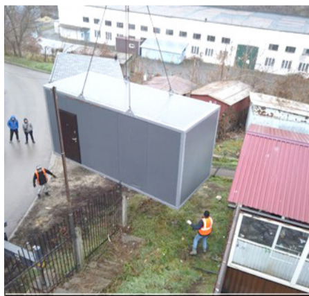
התקנת מערכת חימום במתחם הציון

לאור המלחמה בין רוסיה ואוקראינה ופגיעות ממושכות בתשתית החשמל, עסקני חסידות ברסלב עשו מאמצים כבירים בכדי להתקין במתחם הציון באומן מערכות ההסקה וגנרטור תעשייתי שיספקו את צריכת החשמל והחימום לקראת חודשי החורף הקרים