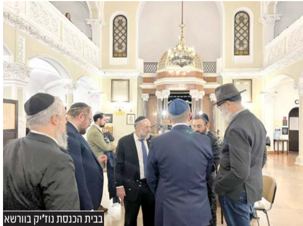
בבית הכנסת נוז'יק בבורשא