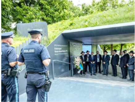
באזכרה ל"א הנרצחים במהלך כינוס ועידת רבני אירופה

הרשויות בגרמניה סבורות שמשמרות המהפכה האיראניות עומדות מאחורי שורה של התקפות על בתי כנסת במדינה בדורטמונד, בבוכום ובאסן • בכל בתי הכנסת בגרמניה מתקיימת שמירה הדוקה של המשטרה סביב בתי הכנסת