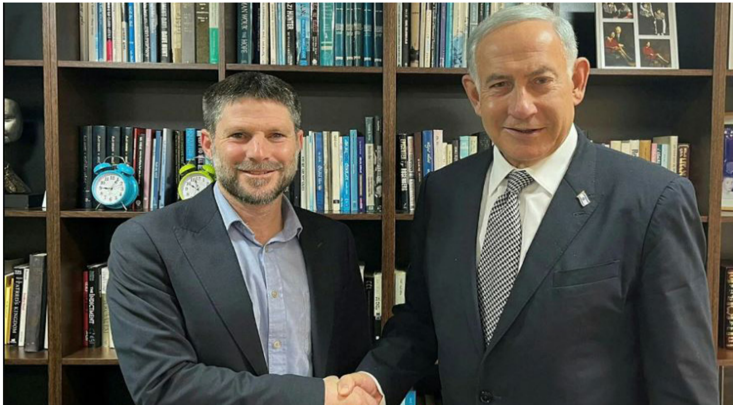
לוחצים ידיים ומסמנים וי, ראש הממשלה ושר האוצר המיועדים