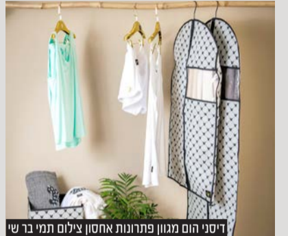
דיסני הום מגוון פתרונות אחסון

החורף כבר כאן וזה אומר שאם עד כה הצלחתם להתחמק, עכשיו כבר באמת אין מנוס וחייבים להתכונן לאחת המטלות המייגעות והמתסכלות רבים מאיתנו - סידור וארגון הארון והחלפת בגדי הקיץ בבגדי החורף • טיפים פרקטיים ופתרונות אחסון יעילים לסידור ארון נוח וקל לחורף