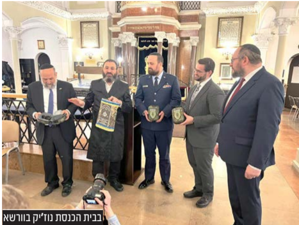
בבית הכנסת נוז'יק בבורשא