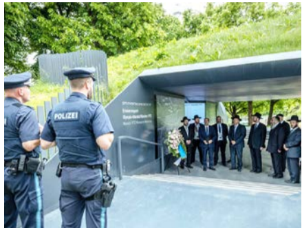
באזכרה ל"א הנרצחים במהלך כינוס ועידת רבני אירופה

הרשויות בגרמניה סבורות שמשמרות המהפכה האיראניות עומדות מאחורי שורה של התקפות על בתי כנסת במדינה בדורטמונד, בבוכום ובאסן • בכל בתי הכנסת בגרמניה מתקיימת שמירה הדוקה של המשטרה סביב בתי הכנסת