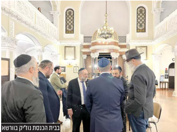
בבית הכנסת נוז'יק בורשא