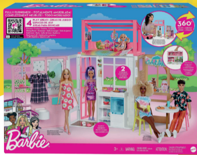
בית בובות ברבי