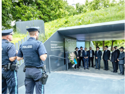
באזכרה ל"א הנרצחים במהלך כינוס ועידת רבני אירופה

הרשויות בגרמניה סבורות שמשמרות המהפכה האיראניות עומדות מאחורי שורה של התקפות על בתי כנסת במדינה בדורטמונד, בבוכום ובאסן • בכל בתי הכנסת בגרמניה מתקיימת שמירה הדוקה של המשטרה סביב בתי הכנסת