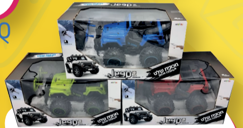
מכונית על שלט בטענת