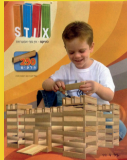
לבני עץ סטיקס