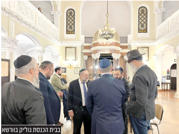
בבית הכנסת נוז'יק בבורשא