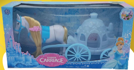
כרכרה חד קרן