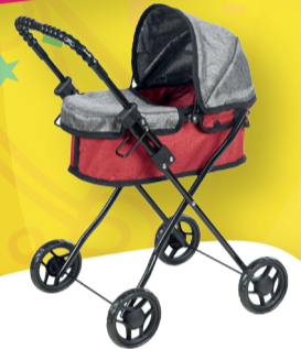
עגלת שכיבה לבובה