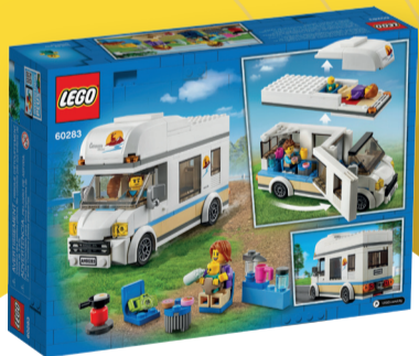
לגו סיטי קראון קמפינג