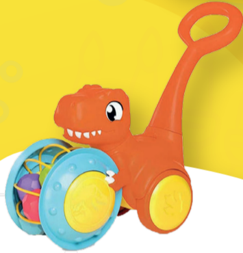
הליכון תומי מעודד זחילה