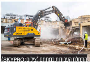
התחלת העבודות במתחם

כשנתיים וחצי לאחר שקיבל תוקף בוועדה המחוזית, החלו השבוע קבוצת דמרי וקבוצת אופיר, בטקס חגיגי, בעבודות ההריסה והבניה במתחם פינוי בינוי מהגדולים בפתח תקווה במתחם שלום אשר בפתח תקווה • 750 דירות חדשות יבנו במקום בהיקף השקעה של כמיליארד שקל