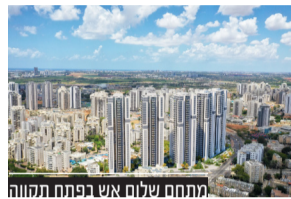
מתחם שלום אשר בפתח תקווה