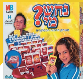
נחש מי קודקוד