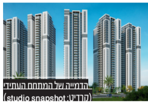
הדמיה של המתחם החדש (studio snapshot)