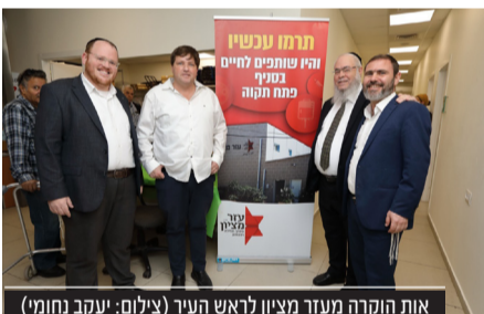
אות הוקרה מעד מציון לראש העיר