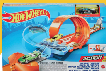
מסלול אקשן הוט ווילס