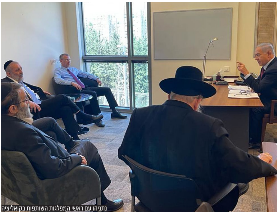
נתניהו עם ראשי המפלגות השותפות בקואליציה

ההסכמים הקואליציוניים מוכנים, נותרו חילוקי דעות אחרונים מול יהדות התורה בנוגע לחוק הגיוס וחוק השבות, אולם במפלגות החרדיות טוענים כי גם לכך תימצא הנוסחה להעברת החוק • נתניהו יודיע לנשיא שעלה בידו, ומהרגע שיו"ר הכנסת הזמני יריב לוין יודיע על כך למליאת הכנסת, יישאר בידי נתניהו שבוע ימים עד להשבעתה של הממשלה