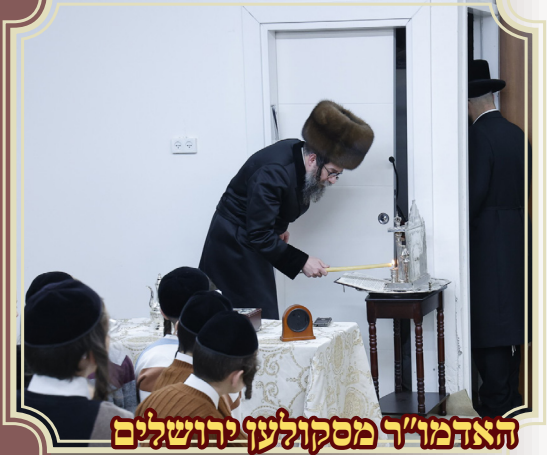
האדמו"ר מסקולען ירושלים