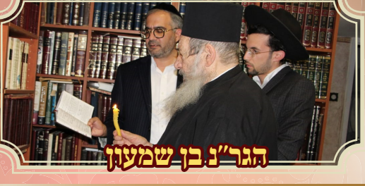
הגר"נ בן שמעון