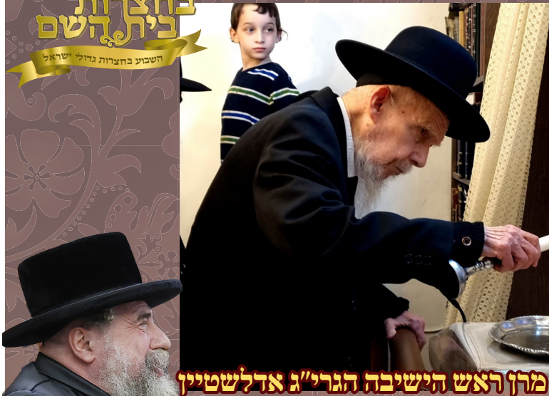
מרן ראש הישיבה הגר"ג אדלשטיין