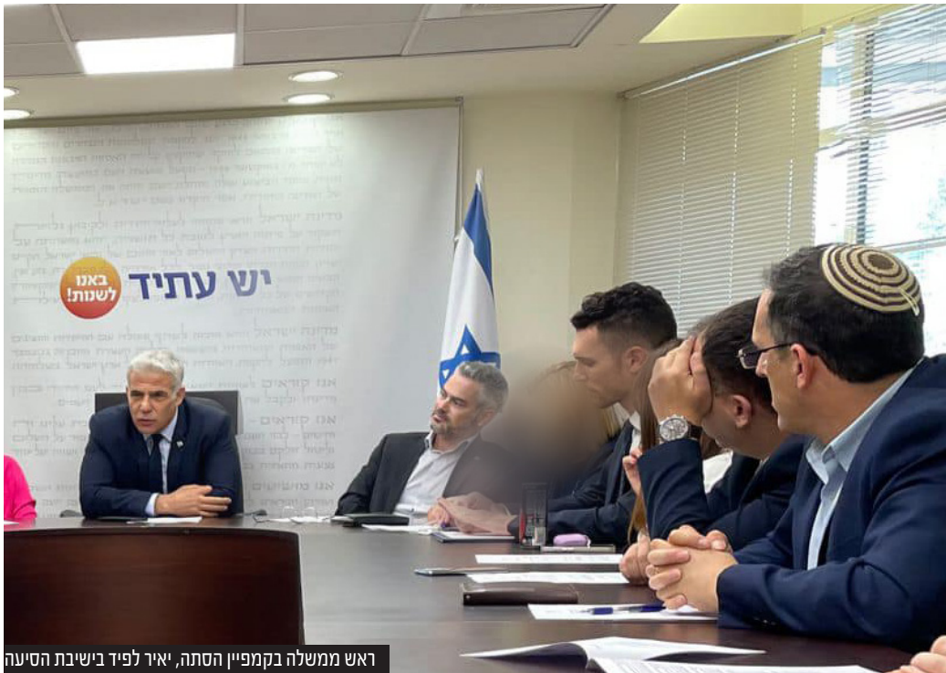
ראש ממשלה בקמפיין הסתה, יאיר לפיד בישיבת הסיעה

שתי תוצאות אחרות אפשריות, שתיהן גרועות אפילו יותר מבחינתו: בראשונה, מסע ההמרדה וההסתה 'מצליח' יתר על המידה ומחולל כאן שסע בלתי ניתן לאיחוי, עימותים פיזיים בין קבוצות אוכלוסייה ואולי אפילו תופעה מוגברת של ירידה מהארץ - שעיקרה דווקא במחנה המצביעים שלו. השנייה, מצב בו בוחריו הגוש מחפשים 'משיח' חדש שינהיג אותם, ופונים למועמד חלופי, כזה