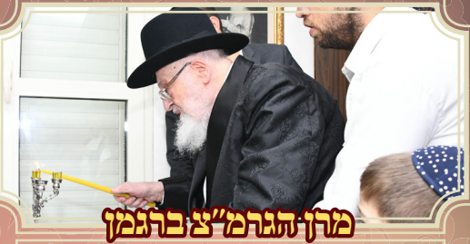
מרן הגרמ"צ ברגמן