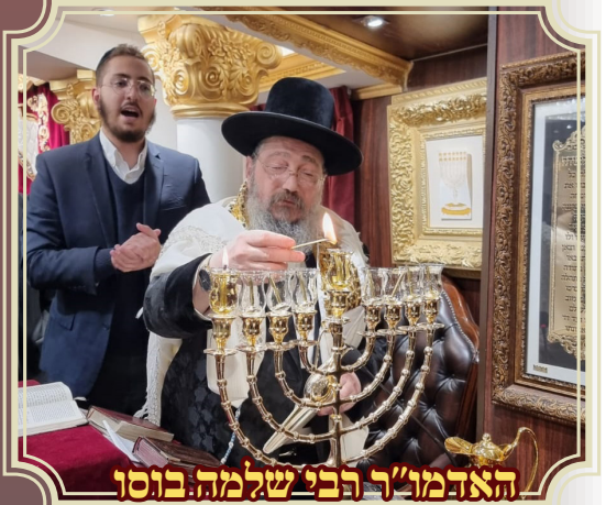
האדמו"ר רבי שלמה בוסן