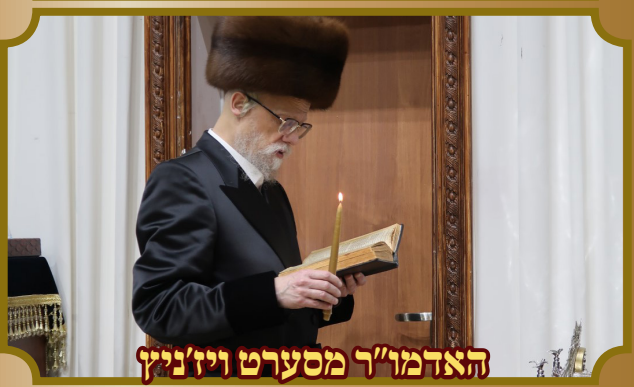
האדמו"ר מסערט ויז'ניץ