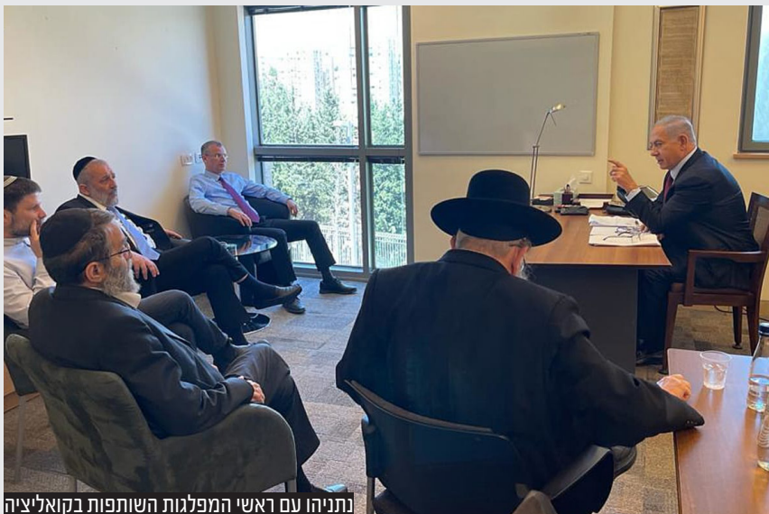
נתניהו עם ראשי המפלגות השותפות בקואליציה

ההסכמים הקואליציוניים מוכנים, נותרו חילוקי דעות אחרונים מול יהדות התורה בנוגע לחוק הגיוס וחוק השבות, אולם במפלגות החרדיות טוענים כי גם לכך תימצא הנוסחה להעברת החוק. נתניהו יודיע לנשיא שעלה בידו, ומהרגע שיו"ד הכנסת הזמני יריב לוין יודיע על כך למליאת הכנסת, יישאר בידי נתניהו שבוע ימים עד להשבעת הממשלה | עמ' 10