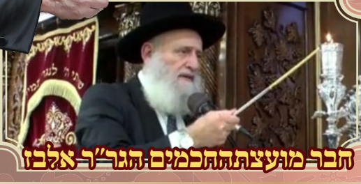
הבר מועצת ההכמנים הגר"ר אלבז