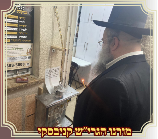
מורנו הגר"ש קניבסקי