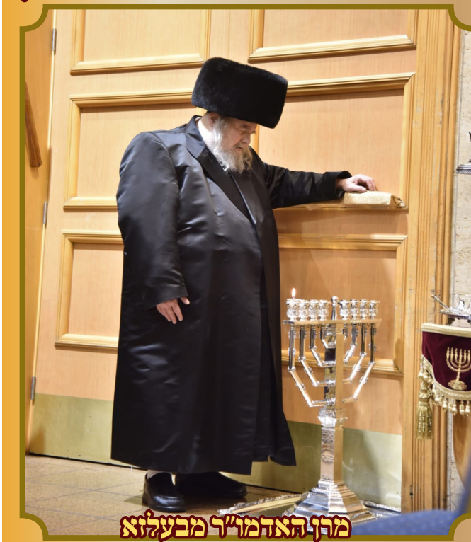
מרן האדמו"ר מבעלזא