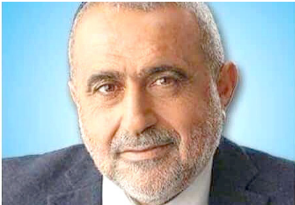
העיר ליאת שוחט.

שוחט, אור יהודה הפכה לבית חם עבור ציבור שומרי התורה והמצוות.