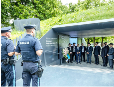
באזכרה ל"א הנרצחים במהלך כינוס ועידת רבני אירופה

הרשויות בגרמניה סבורות שמשמרות המהפכה האיראניות עומדות מאחורי שורה של התקפות על בתי כנסת במדינה בדורטמונד, בבוכום ובאסן • בכל בתי הכנסת בגרמניה מתקיימת שמירה הדוקה של המשטרה סביב בתי הכנסת