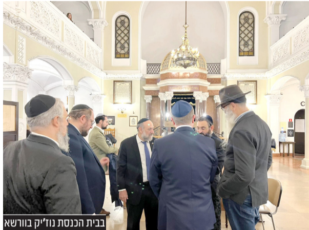
בבית הכנסת נוז'יק בורשא