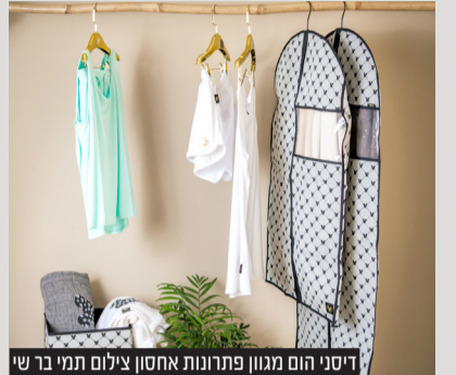
דיסני הום מגוון פתרונות אחסון

החורף כבר כאן וזה אומר שאם עד כה הצלחתם להתחמק, עכשיו כבר באמת אין מנוס וחייבים להתכונן לאחת המטלות המייגעות והמתסכלות רבים מאיתנו - סידור וארגון הארון והחלפת בגדי הקיץ בבגדי החורף. טיפים פרקטיים ופתרונות אחסון יעילים לסידור ארון נוח וקל לחורף