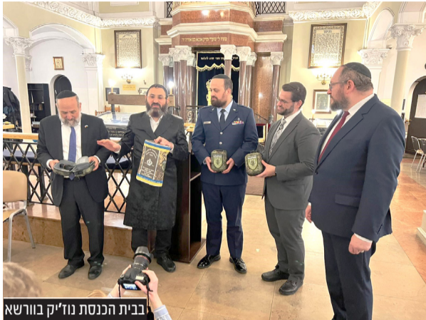
בבית הכנסת נוז'יק בורשא