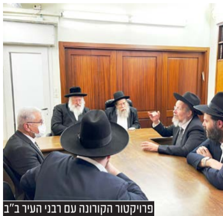
פרויקטור הקורונה עם רבני העיר ב"ב

הגרחי"א לנדא: "פיקוח נפש דוחה את כל התורה כולה, צריך להילחם בתופעת המידע הכוזב נגד החיסונים, שגורמת סכנה לאנשים" • הגרש"צ רוזנבלט: "כולם רואים שמאז הופעת החיסונים, המחלה ירדה, ודאי שזוהי ההשתדלות המחויבת מן התורה" • הגר"מ בן שמעון: "אני מבקש מכל האוכלוסייה בסיכון גבוה לשמוע בקול הרופאים וללכת להתחסן כנגד אומיקרון וכנגד שפעת"