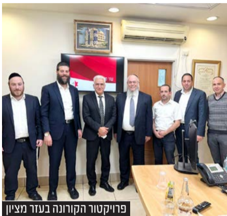
פרויקטור הקורונה בעזר מציון