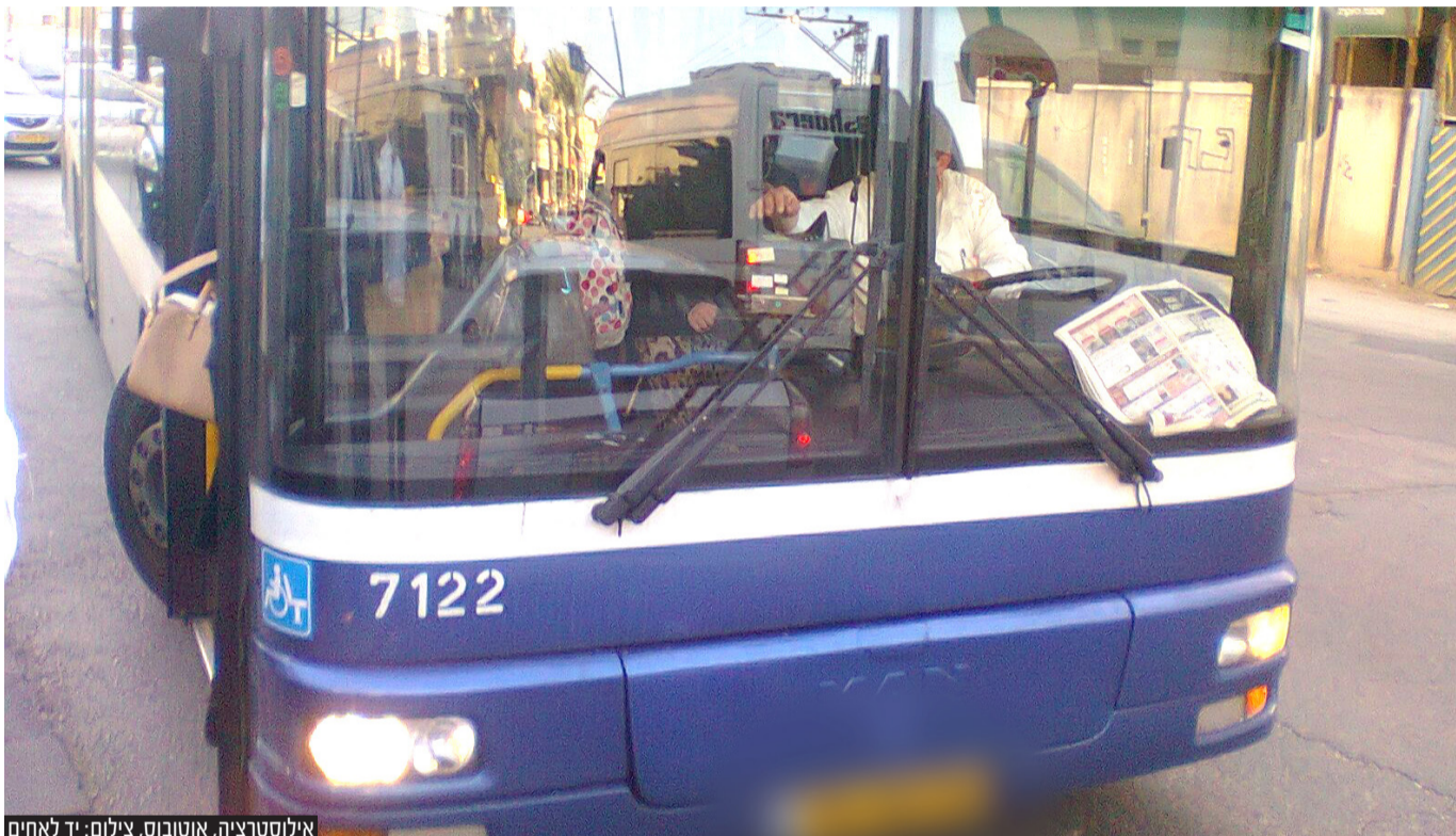
אילוסטרציה, אוטובוס

מדובר בנתון כואב שהולך והופך לעובדה בחודשים ובשנים האחרונות • לפי הנתונים המטופלים בעצם ימים אלו, התופעה אינה פוסחת על שום קהילה או עדה • ביד לאחים מצביעים על נקודות התורפה, שמים אצבע על נורות האזהרה והגורמים להתרחבות התופעה, ממליצים על כללי עזרה ראשונה עם היחשפות לכל גילוי של כל אחת מהנקודות המתוארות