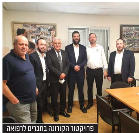
פרויקטור הקורונה בחברים לרפואה