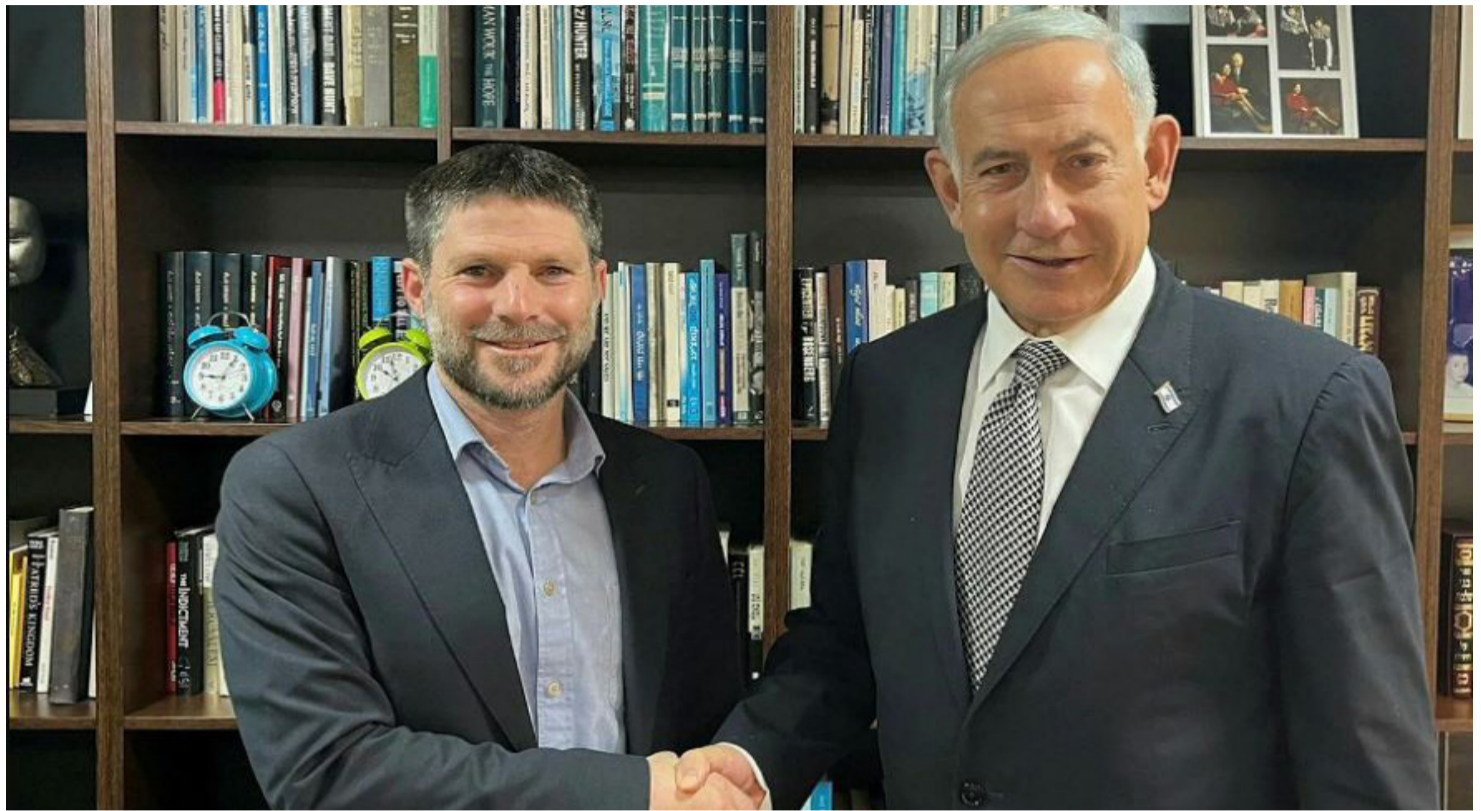
לוחצים ידיים ומסמנים וי, ראש הממשלה ושר האוצר המיועדים

» בציונות הדתית יכולים לסמן וי משולש והם מקפידים לשרר מסר של שיתוף פעולה גם למפלגות החרדיות. בשנה וקצת שהעבירו באופוזיציה, אמר סמוטריץ' לא אחת לדרעי ולגפני כי מבחן שיתוף הפעולה האמיתי שלהם יהיה כאשר תוקם ממשלת הימין, כעת, הוא מתכוון לעמוד בדבריו. ההבנה שבניגוד למחנה רק לא ביבי שסימל את הממשלה הקודמת, כאן ישנם ערכים משותפים המלכדים את המחנה הלאומי, תסייע לצדדים להגיע להבנות גם בנושאים רגישים כמו מינויי רבנים ודיינים, למשל