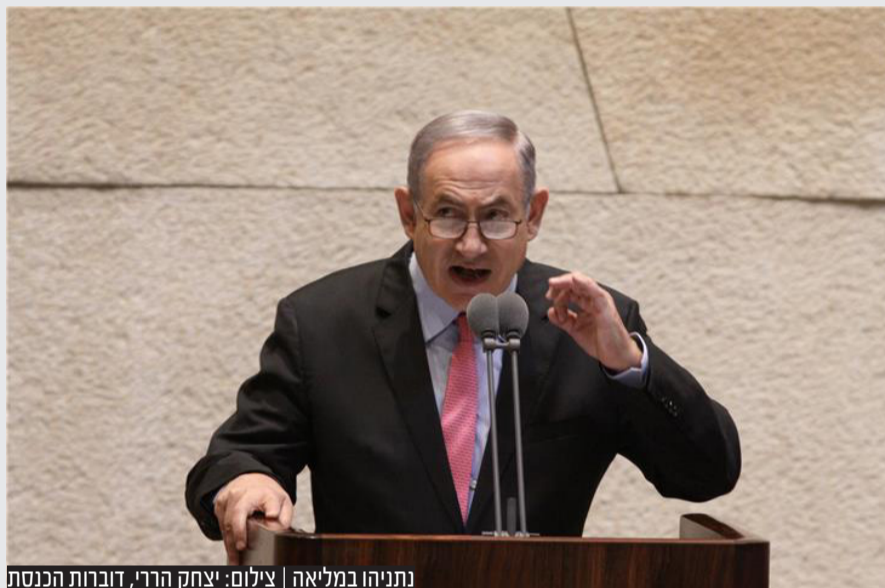
נתניהו במליאה

בתום שבוע מתוח בתוך יהדות התורה ורק לאחר ששר השיכון המיועד יצחק גולדקנופף הודיע כי הוא מוותר על חברותו בקבינט המדיני-ביטחוני, חתמה דגל התורה על ההסכם הקואליציוני. ביום חמישי צפוי נתניהו להשביע את ממשלתו השישית, לאחר שהסתיים בליץ החקיקה שדרשו דרעי, סמוטריץ' וכן גביר • בג"צ דחה את העתירה שביקשה למנוע את מינויו של דרעי לשר בטענה "שהעתירה הקדימה את זמנה" | עמ' 10