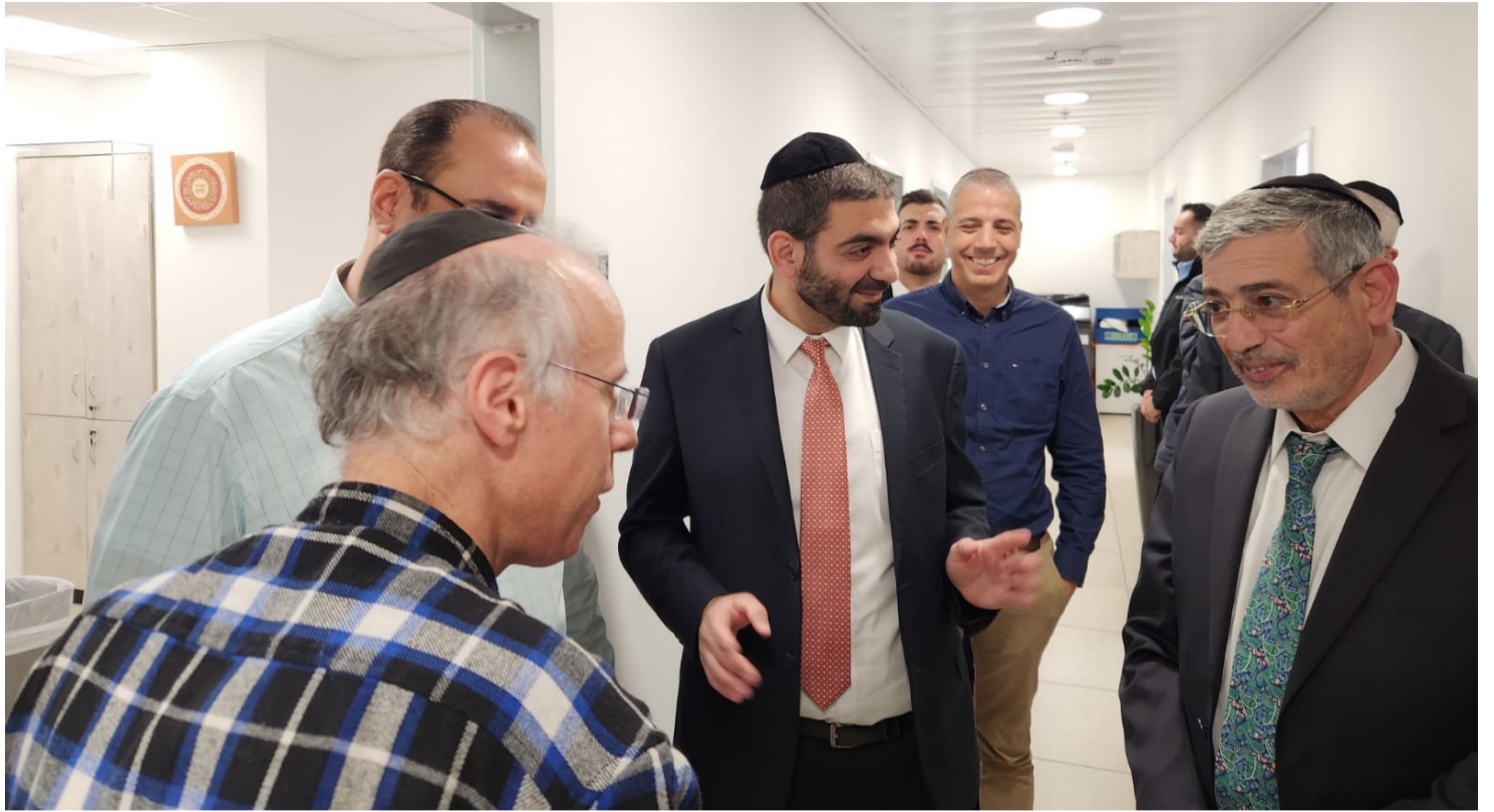
מהפנה במשרד הדתות, השר והמנכ"ל בסיור מקצועי