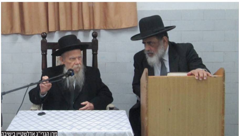
מרן הגר"ש אדלשטיין בישיבה