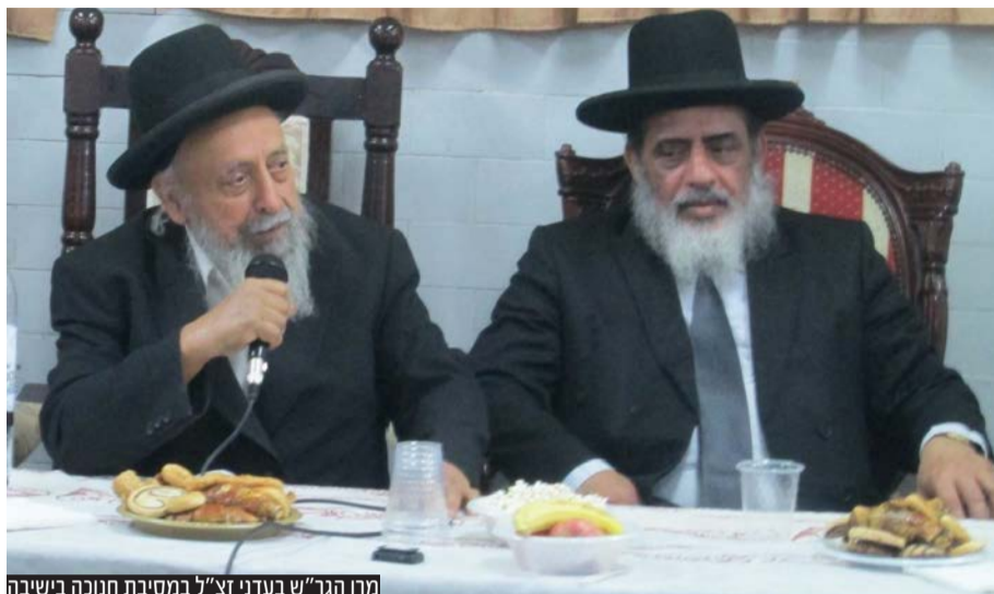
מרן הגר"ש בעדני זצ"ל במסיבת חנוכה בישיבה