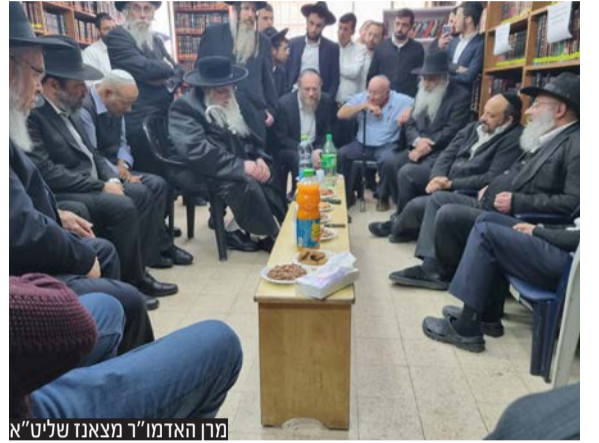
מרן האדמו"ר מצאנז שליט"א