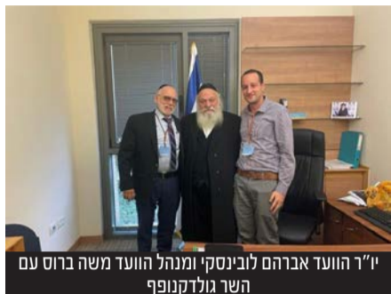
יו"ר הוועד אברהם לובינסקי ומנהל הוועד משה ברוס עם השר גולדקנופף

ראשי הוועד הודו לשר הרב גולדקנופף על פעילותו וציינו לשבח את העובדה שיהדות התורה וש"ס הכניסו להסכמים הקואליציוניים את נושא הר הזיתים תחת אחריות משרדו • השר מצדו הבטיח לפעול ולממש את ההסכם ולהביא לתקציבים שישפרו את המצב