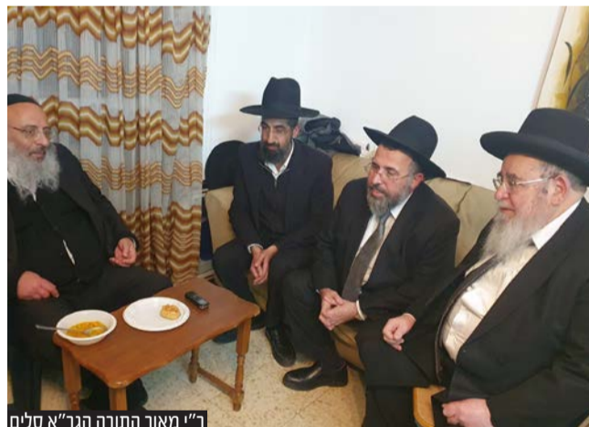
ר"י מאור התורה הגר"א סלים