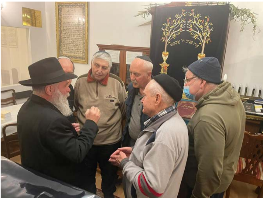
מסע החילוץ של זקני הקהילה היהודית בקייב ללודז' שבפולין