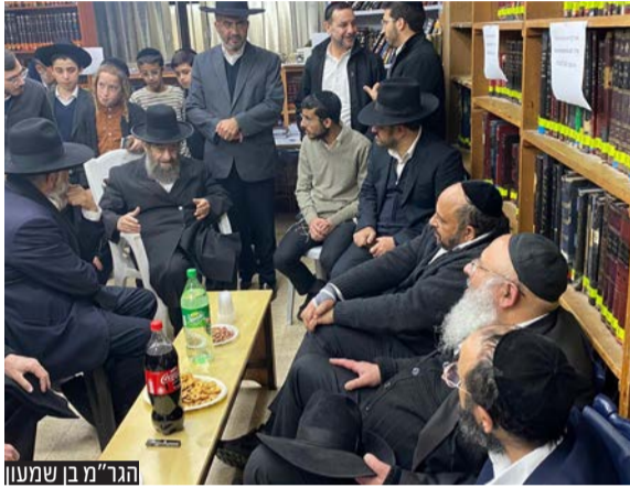
הגר"מ בן שמעון