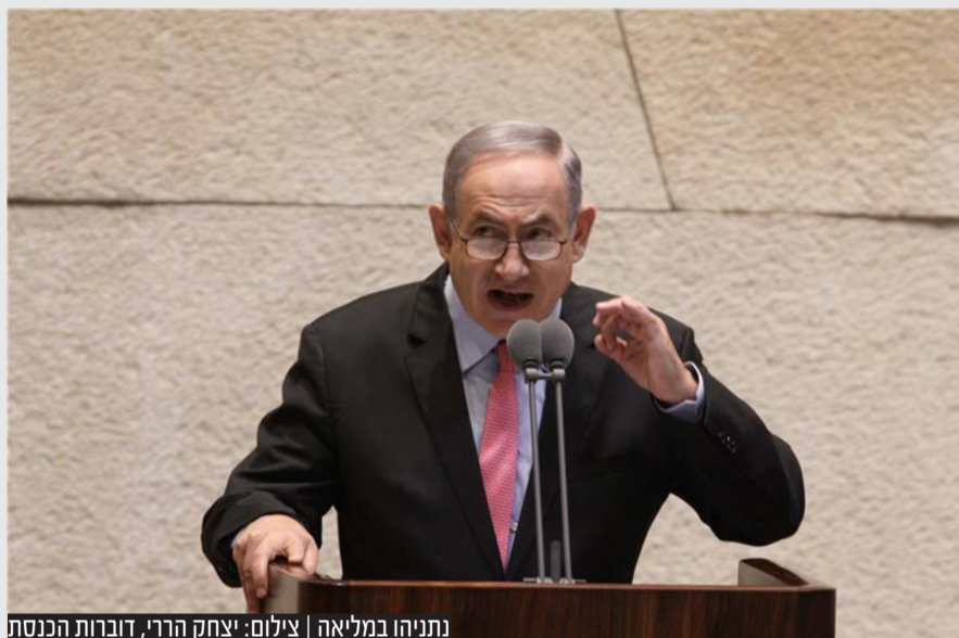
נתניהו במליאה

בתום שבוע מתוח בתוך יהדות התורה ורק לאחר ששר השיכון המיועד יצחק גולדקנופף הודיע כי הוא מוותר על חברותו בקבינט המדיני-ביטחוני, חתמה דגל התורה על ההסכם הקואליציוני. ביום חמישי צפוי נתניהו להשביע את ממשלתו השישית, לאחר שהסתיים בליץ החקיקה שדרשו דרעי, סמוטריץ' ובן גביר. בג"צ דחה את העתירה שביקשה למנוע את מינויו של דרעי לשר בטענה "שהעתירה הקדימה את זמנה" | עמ' 10