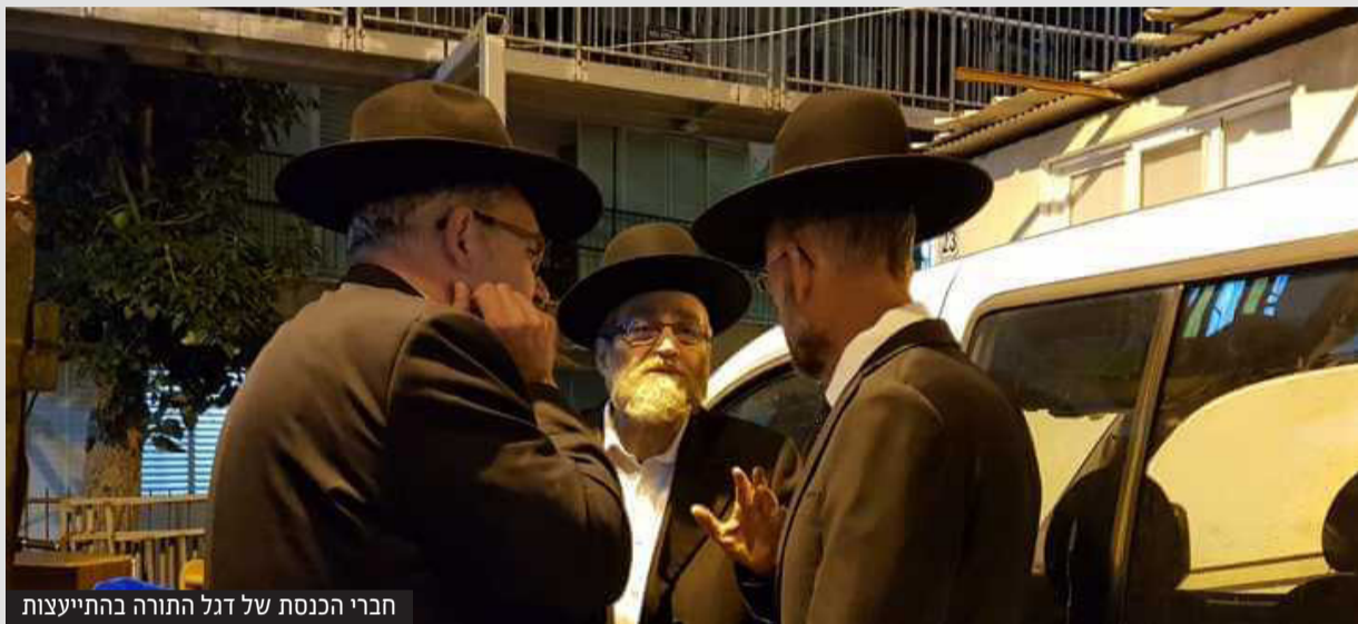
חברי הכנסת של דגל התורה בהתייעצות

אחרי שבבחירות הקודמות דגל התורה התמודדה עצמאית בירושלים, ביתר וחיפה, המגמה צפויה להתרחב: בכל עיר שבה אין חשש לאיבוד קולות של הציבור החרדי, אגודת ישראל ודגל התורה צפויות להתמודד ברשימות נפרדות גם בבני ברק, פ"ת, אלעד, מודיעין עילית, בית שמש ועמנואל