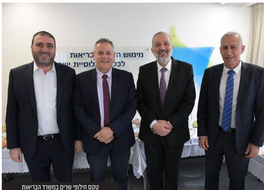
טקס חילופי שרים במשרד הבריאות

מניעת תחבורה ציבורית בשבת: אמנם שרת התחבורה היא מירי רגב, אך בשל העובדה שסגן שרת התחבורה הוא ח"כ אורי מקלב, בנוסף לכהונתו כסגן שר במשרד רה"מ, הטיפול בנושא שמירת הסטטוס קוו בתחבורה הציבורית מונח לפתחו. כפי שנהגו בעבר, לא בטוח שלצאת בהצהרות פומביות על שמירת שבת במרחב הציבורי יסייע לקידום העניין.