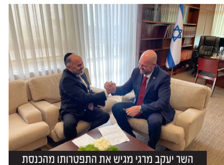
השר יעקב מרגי מגיש את התפטרותו מהכנסת

יצחק גולדקנופף, יו"ר ועדת הכספים משה גפני, סגן שרת התחבורה וסגן שר במשרד רה"מ אורי מקלב, סגן שר במשרד לענייני ירושלים ומסורת מאיר פרוש, סגן שר הרווחה יעקב טסלר, יו"ר ועדת הפנים יעקב אשר, יו"ר ועדת העבודה והרווחה ישראל אייכלר ויו"ר הוועדה לפניות הציבור יצחק פינדרוס.