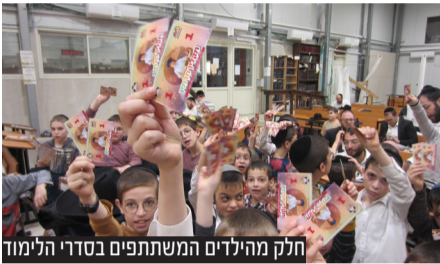
חלק מהילדים המשתתפים בסדרי הלימוד

לקיר, כאשר בכל רחבי העיר בהיכליה ובתי מדרשיותיה בכל פינה, נשמע קול התורה ברמה כאשר השעות שלאחר הדלקת הנרות שהיו בעבר כ'שעות בית' - הפכו לשעות תוססות של בית המדרש בלכידות קהילתיות ורוממות תורנית מיוחדת שחוללה מהפך אמיתי במהותם של ימי החנוכה כלשון חז"ל וכפי שעוררו רבותינו מאורי הדורות: 'מאי חנוכה? דתנו רבנן!' בריבוי לימוד וקול התורה כשהוא מוסיף והולך ומנחיל בלבבות את עיקר הגם ומצוותיו לדורות.