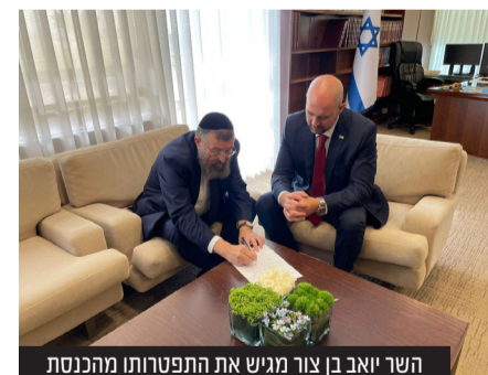
השר יואב בן צור מגיש את התפטרותו מהכנסת

עכשיו זה בידיהם של שר הפנים והבריאות אריה דרעי, שרי הרווחה יעקב מרגי ויואב בן צור, השר לשירותי דת מיכאל מלכיאלי, שר במשרד החינוך חיים ביטון, סגן שר הפנים והבריאות משה ארבל, סגן שר החקלאות משה אבוטבול, יו"ר סיעת ש"ס ויו"ר ועדת הכנסת העתידי ח"כ ינון אזולאי, יו"ר ועדת הבריאות אוריאל כוס, יו"ר ועדת החינוך יוסף טייב, חברי הכנסת הטריים - יונתן משריקי ונתנאל חייק, שר השיכון