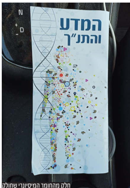
חלק מהחומר המיסיונרי שחולק

וקוראים לו לפנות למוקד החירום ולדווח על כל פעילות מיסיונרית. "אנו מפצירים בציבור לפקוח את העיניים ולחייג למוקד החירום שלנו שמספרו *9234 בכל פעם שתפגשו בפעילות המיסיונרית".