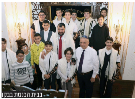
בבית הכנסת בבקו

מתקדמת ששומרת על קשר הדוק עם ישראל והעולם המערבי. בתקוה כי ישקלו מחדש את החלטתם."