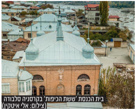
בית הכנסת 'ששת הכיפות' בקרסניה סלבודה