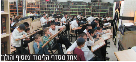
אחד מסדרי הלימוד 'מוסיף והולך'