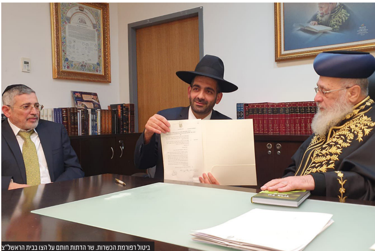
ביטול רפורמת הנשורות. שר הדתות חותם על הצו בבית הראשון

יאלצו לקושש אותם פעם אחר פעם. את הקמתה של הרשות סיקרנו כאן בהרחבה כבר בממשלת נתניהו-גנץ, כעת, היא צפויה לקבל דחיפה רצינית.