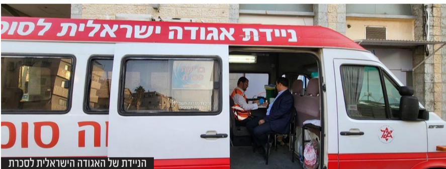
הניידת של האגודה הישראלית לסכרת