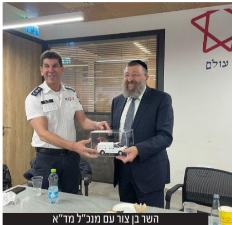
השר בן צור עם מנכ"ל מד"א