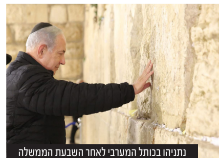
נתניהו בכותל המערבי לאחר השבעת הממשלה

השוואת תקציבי מוסדות החינוך החרדים: בנספח להסכמים הקואליציוניים של יהדות התורה, הובטח השוואת תקצוב מוסדות החינוך החרדים. בנוסח