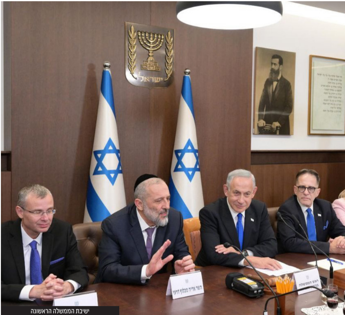
ישיבת הממשלה הראשונה

פסקת ההתגברות: ויכוח משפטי וציבורי נוקב מתנהל בנושא פסקת ההתגברות. במפלגות החרדיות ביקשו תחילה להתנות את תמיכתן בהשבעת הממשלה בהעברת פסקת ההתגברות עוד בטרם השבעת הממשלה. בסופו של דבר העיסוק בנושא נדחה, אך קרוב לוודאי שהוא יעלה לסדר היום, כאשר שר המשפטים יריב לוין יכריז על תוכניותיו לרפורמה משפטית מקיפה.