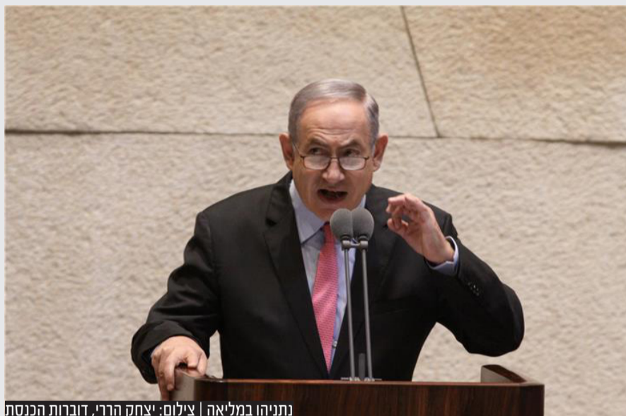
נתניהו במליאה

בתום שבוע מתוח בתוך יהדות התורה ורק לאחר ששר השיכון המיועד יצחק גולדקנופף הודיע כי הוא מוותר על חברותו בקבינט המדיני-ביטחוני, חתמה דגל התורה על ההסכם הקואליציוני. ביום חמישי צפוי נתניהו להשביע את ממשלתו השישית, לאחר שהסתיים בליץ החקיקה שדרשו דרעי, סמוטריץ' ובן גביר. בג"צ דחה את העתירה שביקשה למנוע את מינויו של דרעי לשר בטענה "שהעתירה הקדימה את זמנה" | עמ' 10