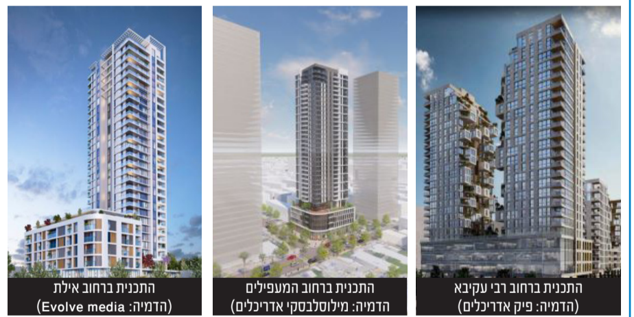
התכנית ברחוב אילת (הדמיה: Evolve media)

התכנית השלישית היא ברח' המעפילים 29-31, בשכונת תל גיבורים. מדובר בתוכנית התחדשות עירונית לפינוי-בינוי הכוללת איחוד וחלוקה וקובעת ייעודי קרקע, שימושים וזכויות למגורים, תעסוקה ומסחר. התוכנית כוללת הפרשה לטובת פריצת דרך ברחוב מבצע סיני וחיבורו למעפילים, וכן הרחבת המעפילים בה יעבור קו המטרו M1. התוכנית כוללת הוראות להריסת 2 מבני שיכונים הכוללים 36 יח"ד ומציעה מגדל אחד בעירוב שימושים הכולל שילוב בנייה מגדלית של מגורים מעל 4 קומות מסד, סה"כ 155 יח"ד.